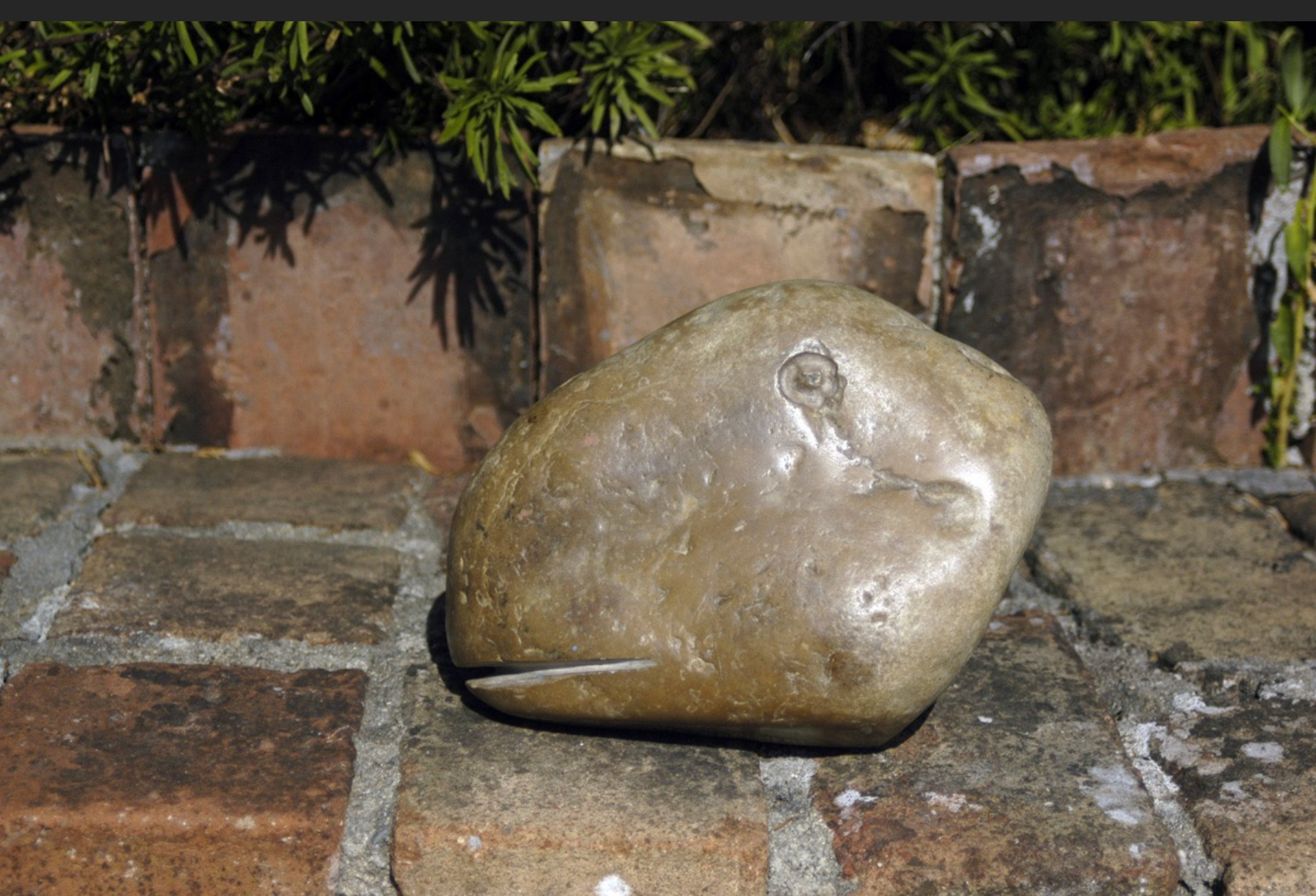
BÊTE, PIERRE D'ARAGON, 20 x 16 cm, pierre