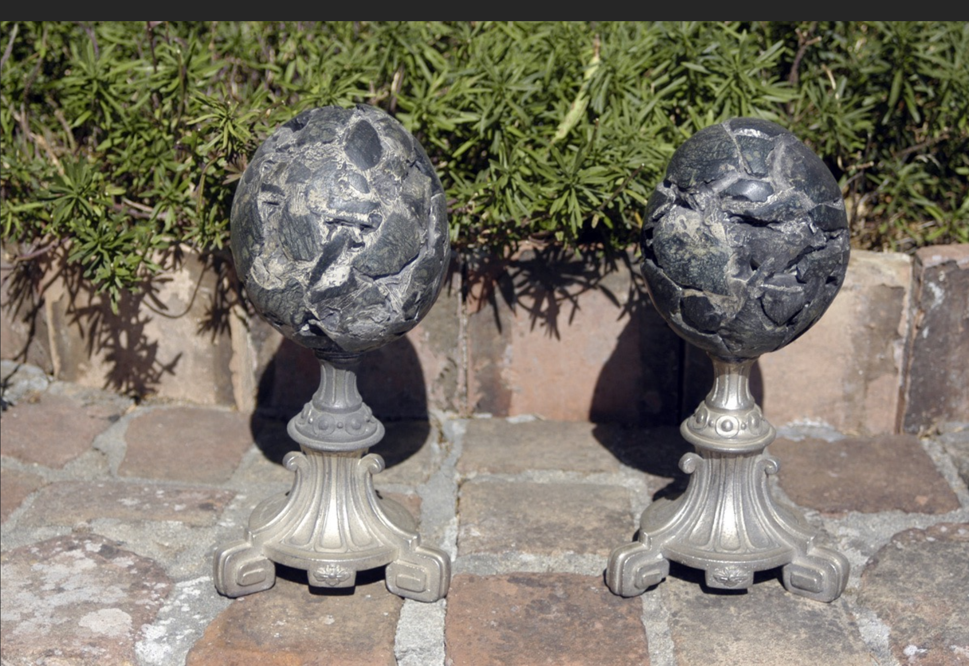
ŒUFS SACRÉS, 50 x 14 cm, assemblage pierre et métal