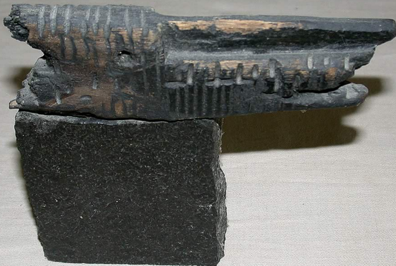
TÊTE DE CROCODILE SUR SOCLE, 26 x 30 cm, bois et marbre