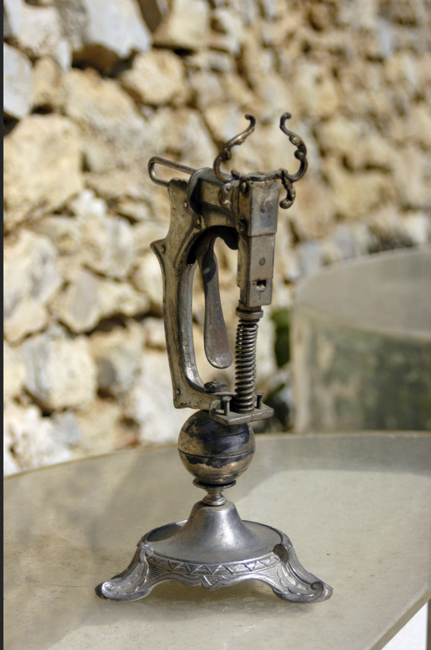
TAUREAU, 32 x 18 x 16 cm, assemblage