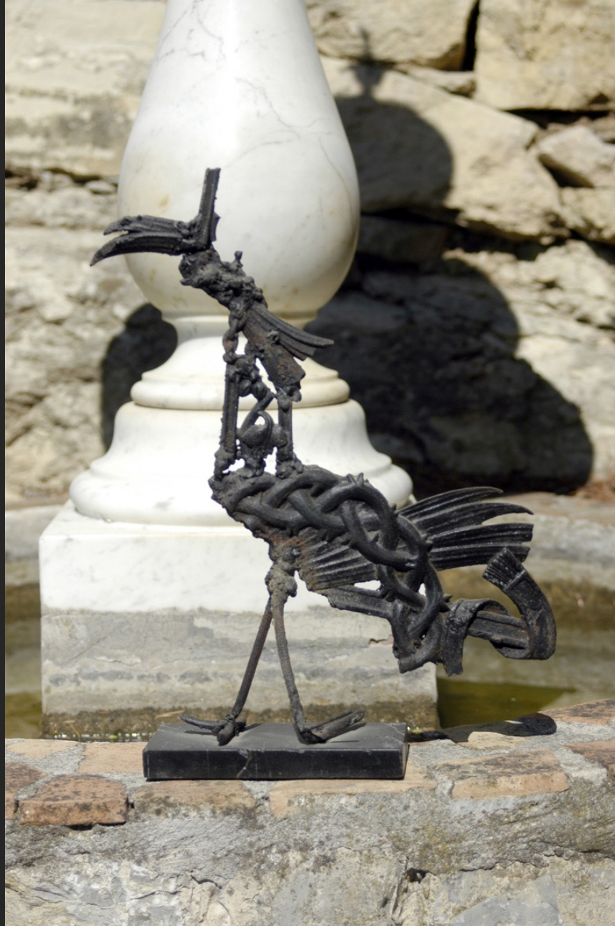
OISEAU, 39,5 x 27 cm, assemblage, bronze