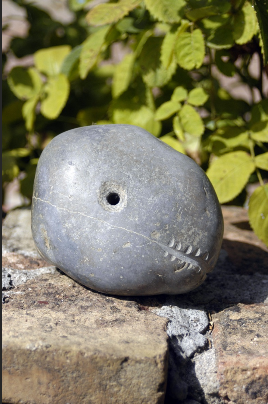
BÊTE, PIERRE D'ARAGON, 9 x 13 cm, pierre