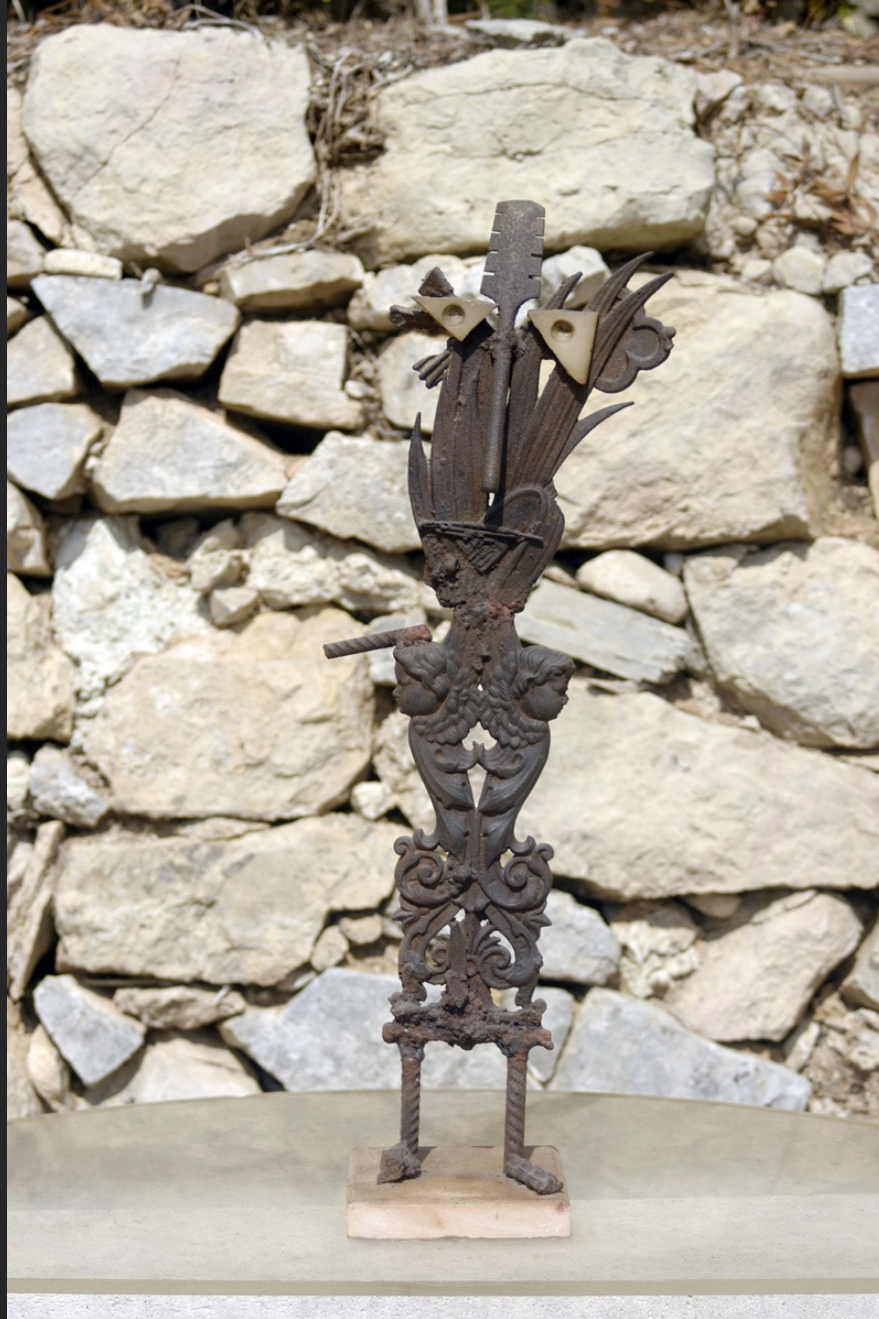
HOMME SORCIER, 58 x 18 x 5 cm, assemblage, métal