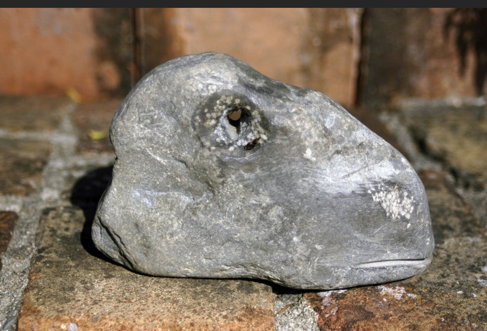
BÊTE, PIERRE D'ARAGON, 41 x 19 x 13 cm, pierre