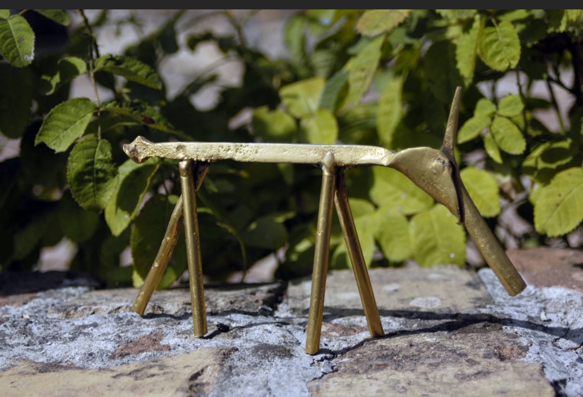
CHÈVRE, 22 x 14,5 cm, assemblage métal