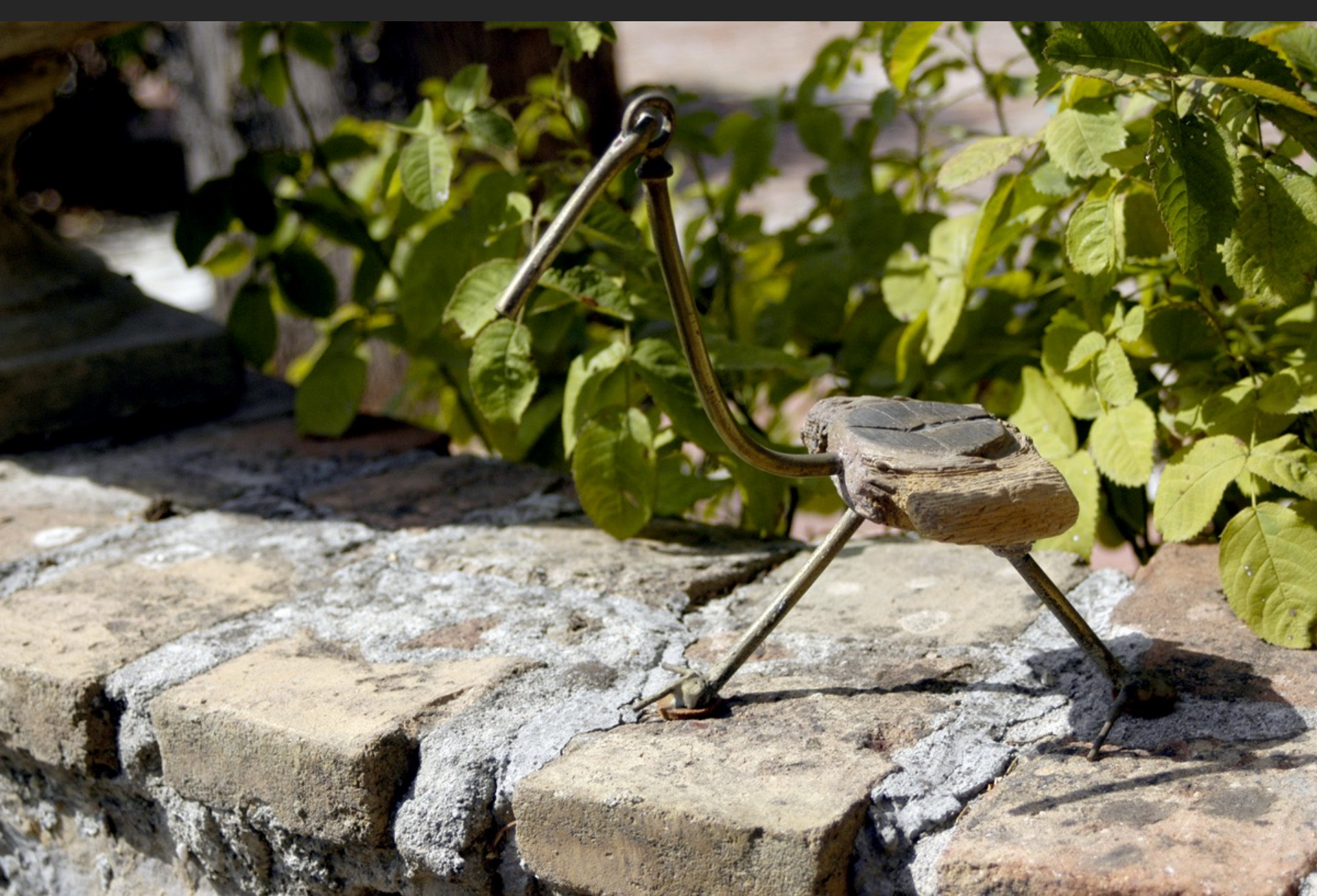
OISEAU, 22,5 x 21 x 13 cm, assemblage