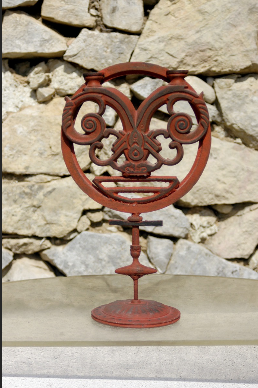
PERSONNAGE ROUGE, 38 x 22 cm, assemblage, fonte