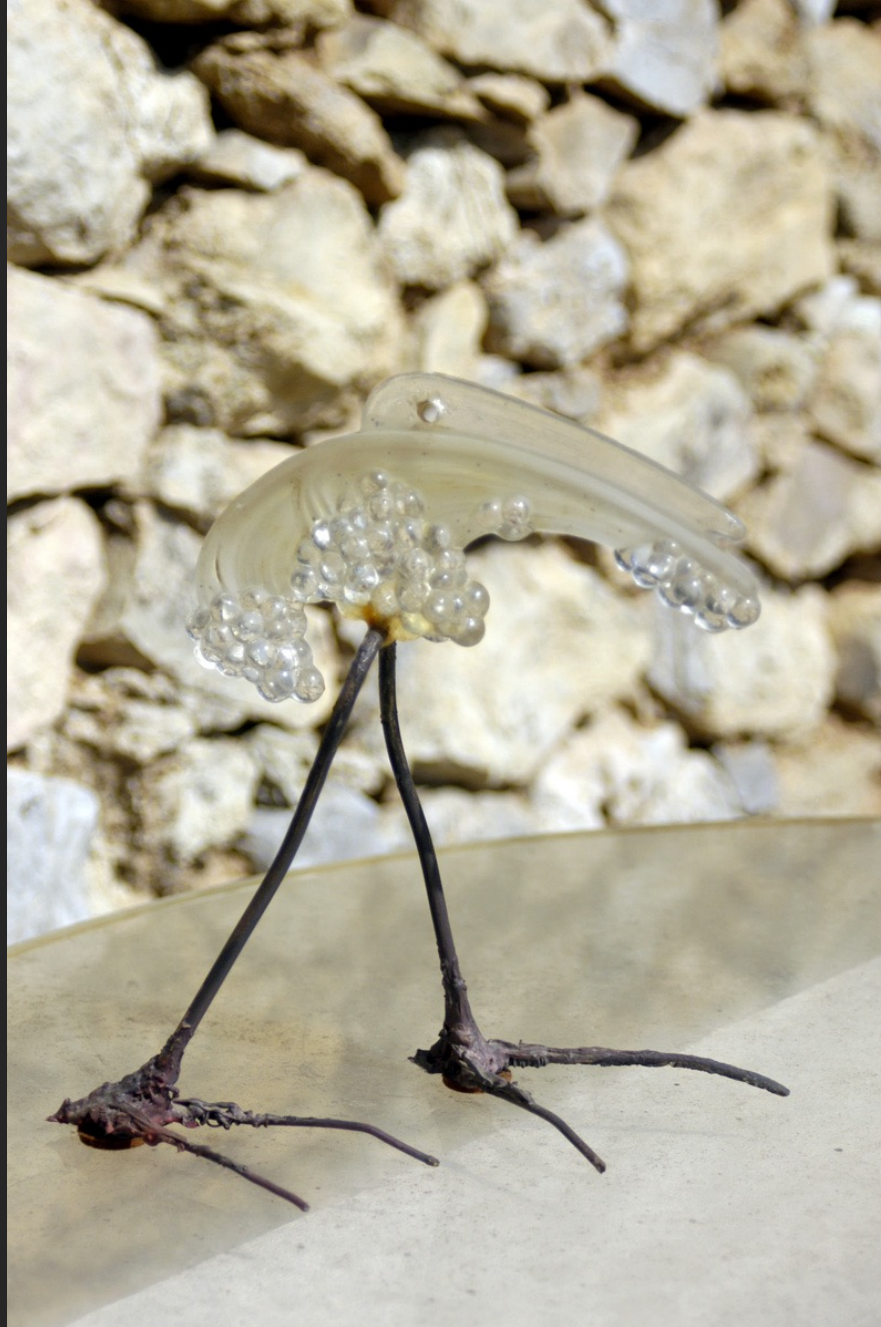
OISEAU, 23 x 22 x 14 cm, assemblage