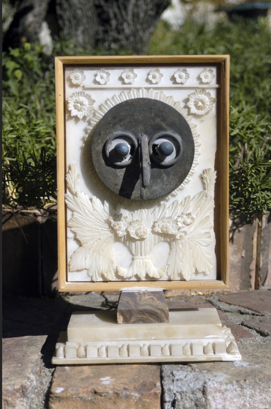
CHOUETTE, 34 x 21 cm, assemblage