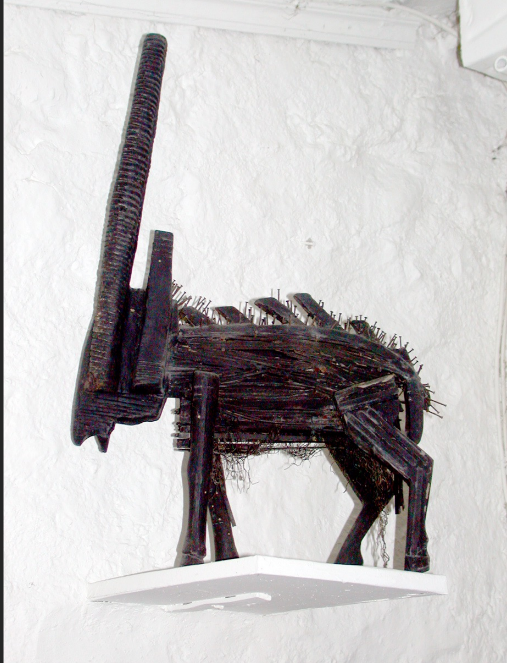
RARE SPECIMEN D'ANIMAL AFRICAIN, 62 x 40 cm, bois et métal