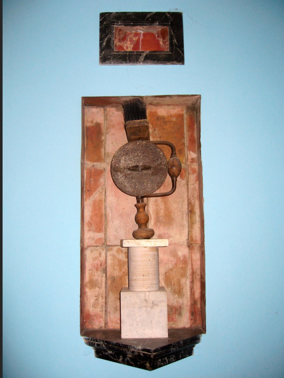
ÉTRUSQUE, 65 x 20 x 16 cm, assemblage