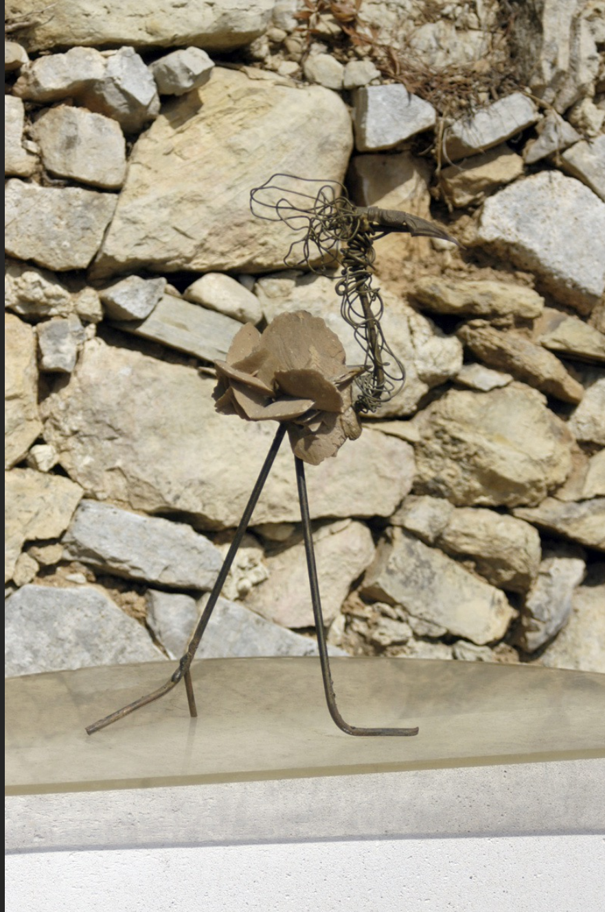
OISEAU ROSE DES SABLES, 44 x 26 x 11 cm, assemblage