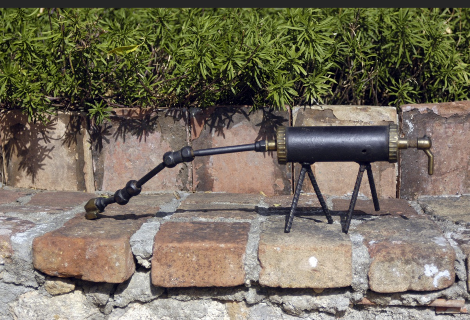
ANIMAL BROUTANT, 13,5 x 47 x 9 cm, assemblage métal