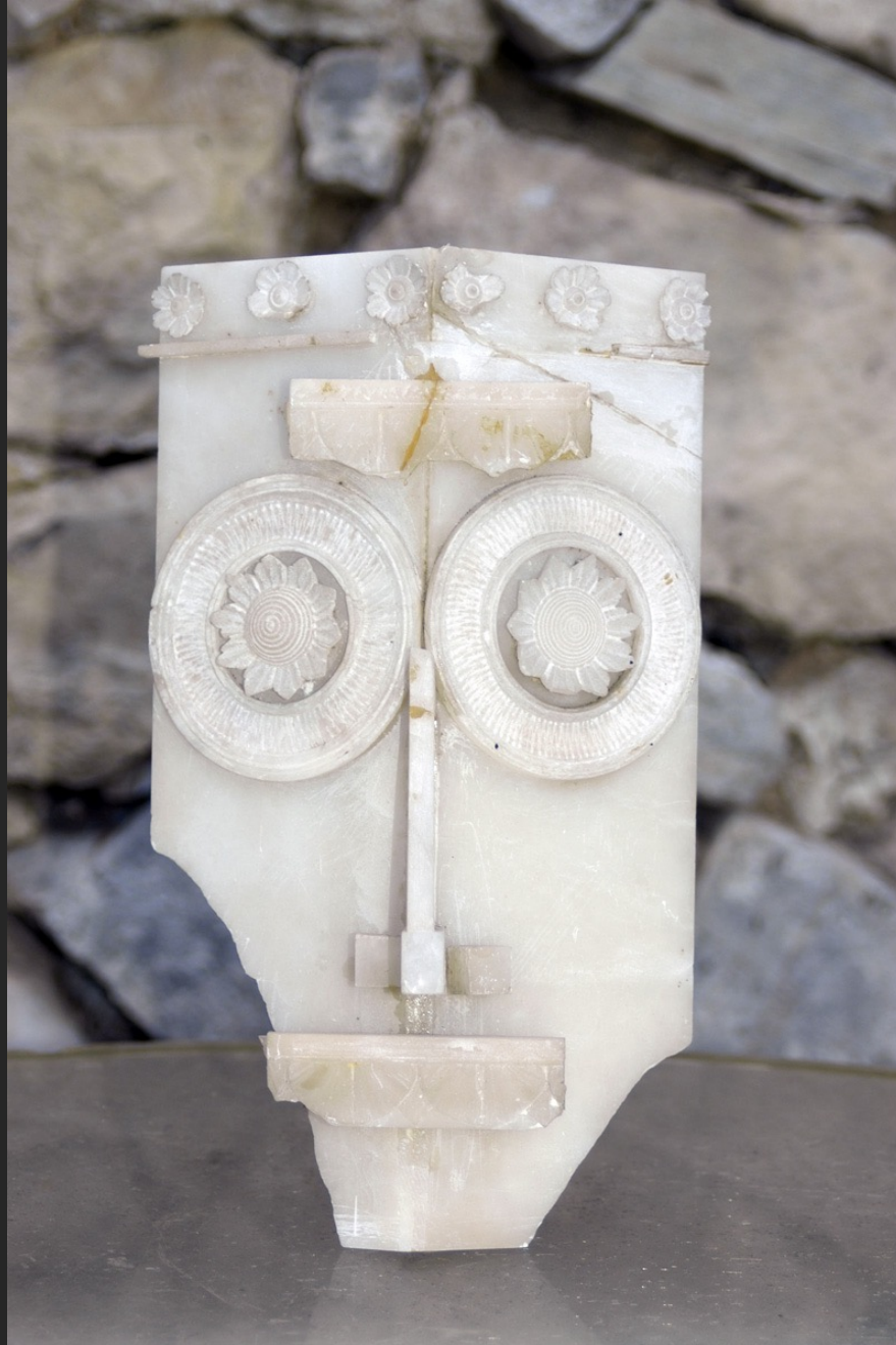
MASQUE, 25 x 14 cm, assemblage, marbre blanc