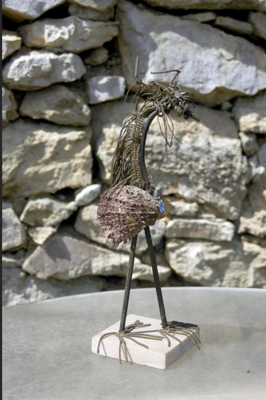
OISEAU, 35 x 13 cm, assemblage