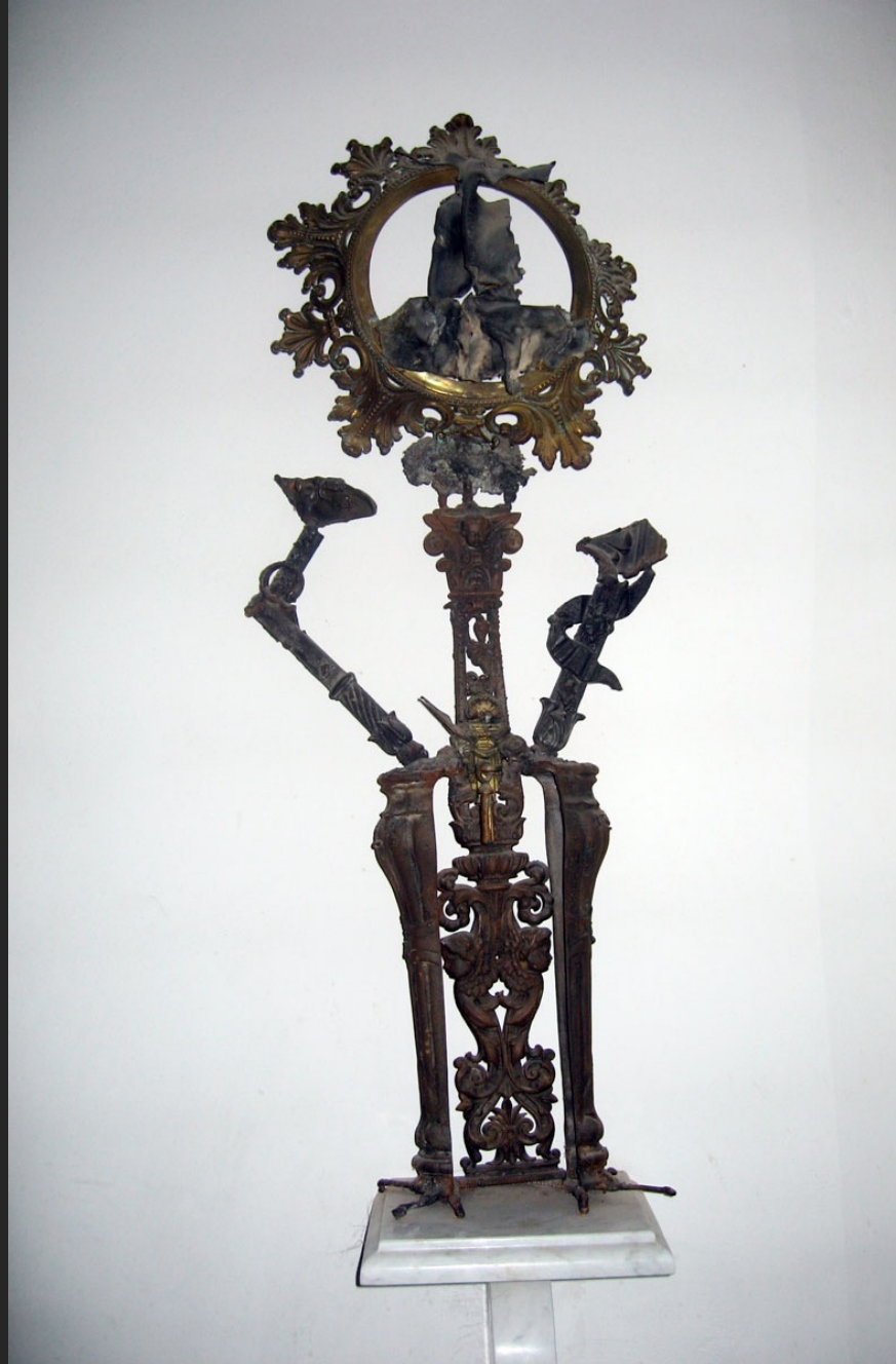
CRUCIFIX, 97 x 40 x13 cm, assemblage métal