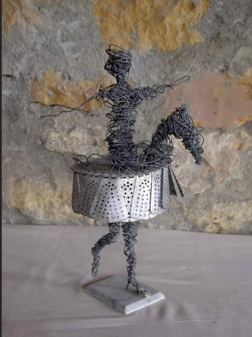
CAVALIER ET CHEVAL EN ARMURE, 30 x 20 cm, assemblage, fer et aluminium