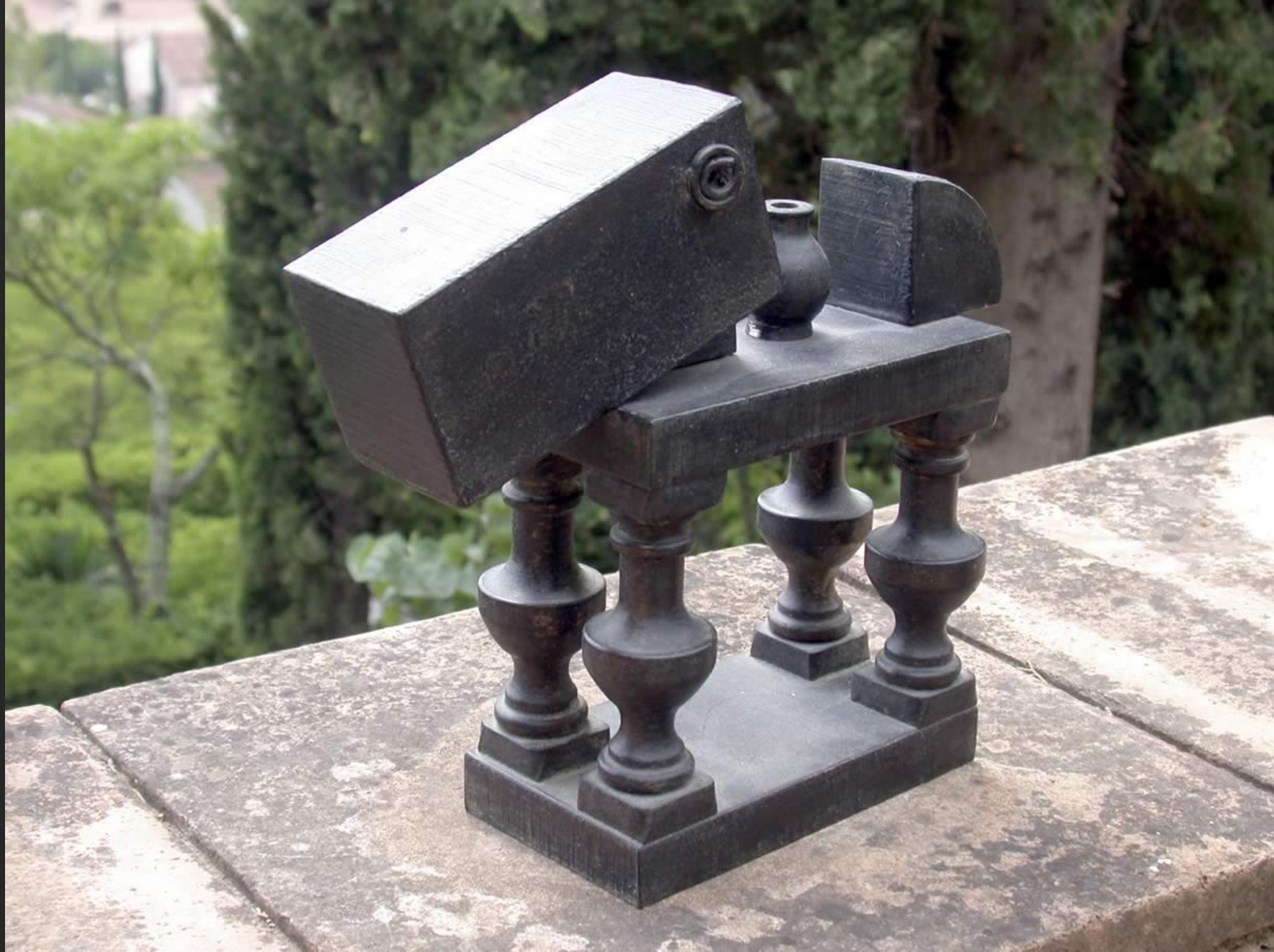
CHEVAL II, 23 x 24 cm, bronze