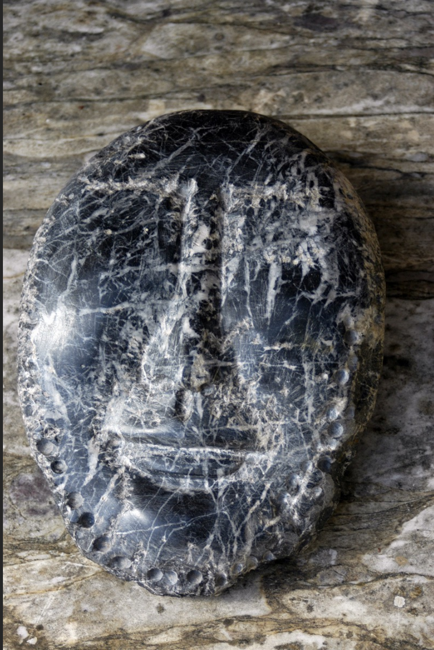
MASQUE, 26 x 19 cm, marbre