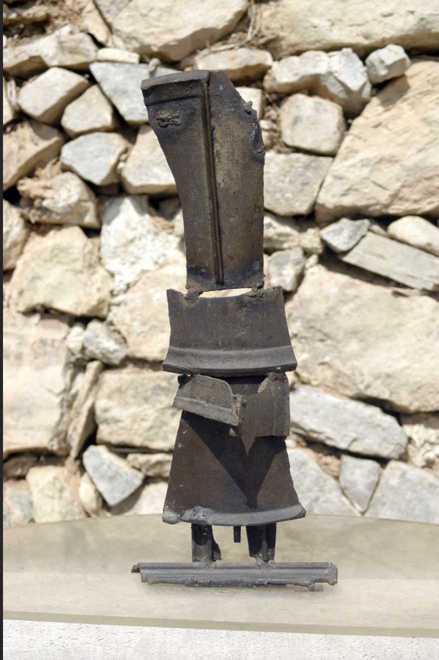
PERSONNAGE, 48 x 19 x 10 cm, assemblage, métal