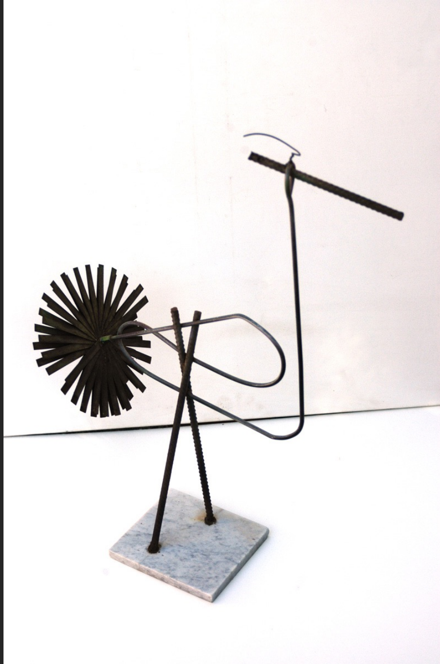
OISEAU, 54 x 52 x 18 cm, assemblage métal