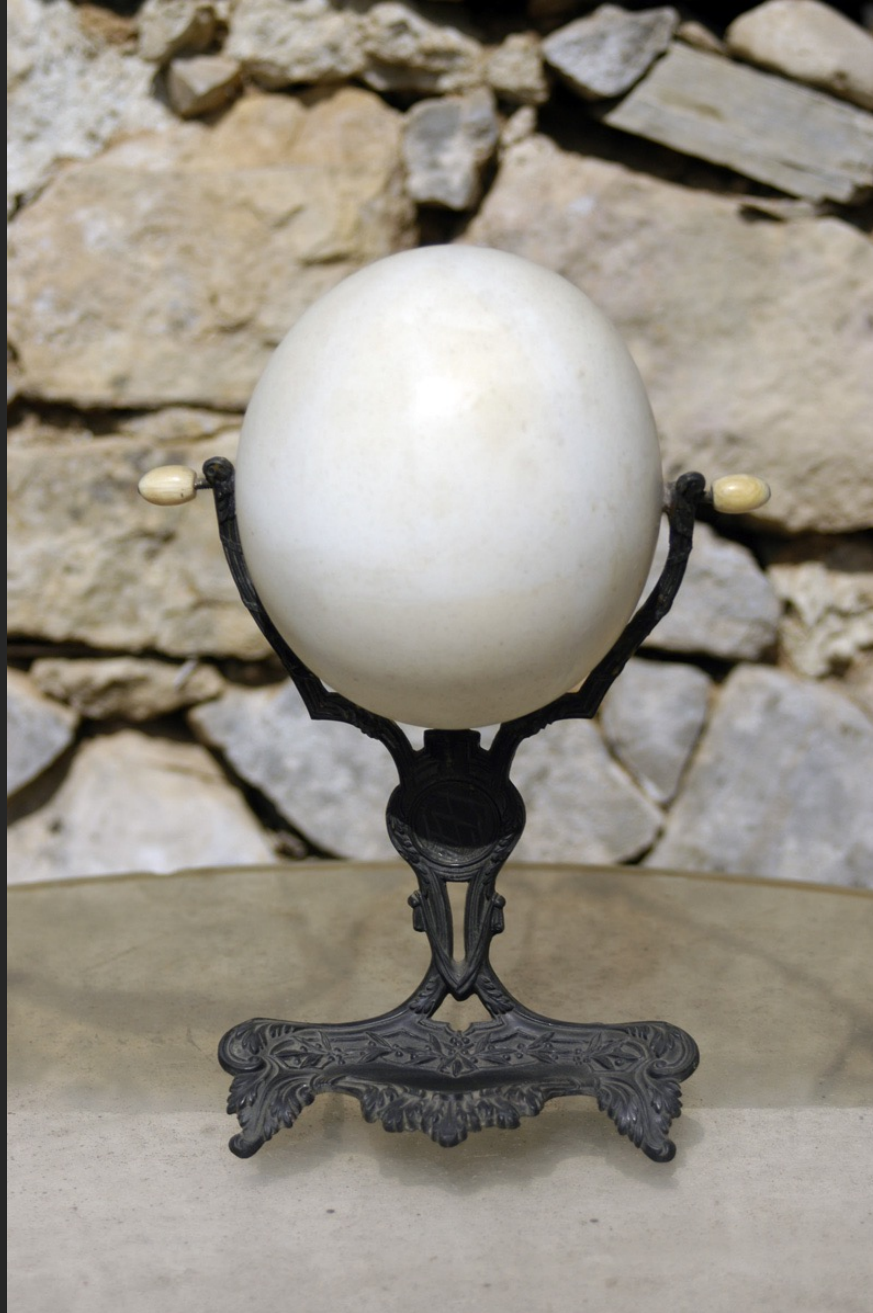
LE MIROIR DU TEMPS, 29 x 20 x 13 cm, assemblage