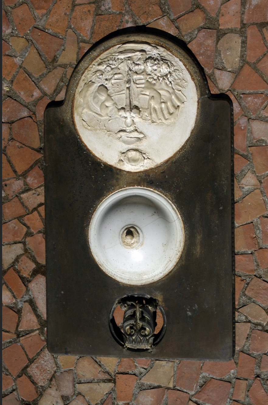
PERSONNAGE, 65 x 38 x 7 cm, assemblage, bois, métal et plâtre