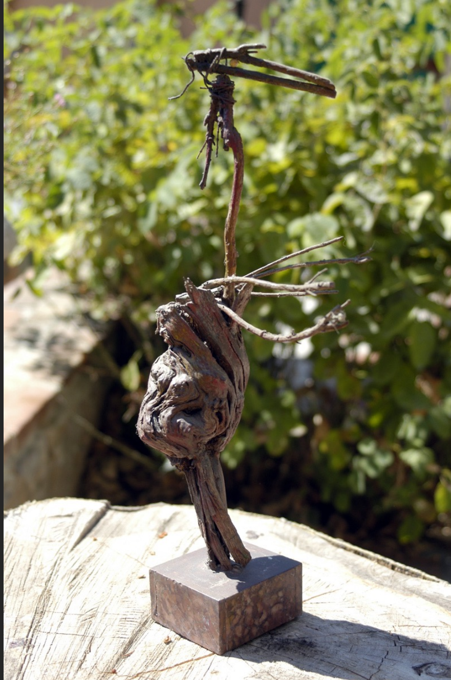
OISEAU BRUN, 36 x 16 cm, assemblage bois