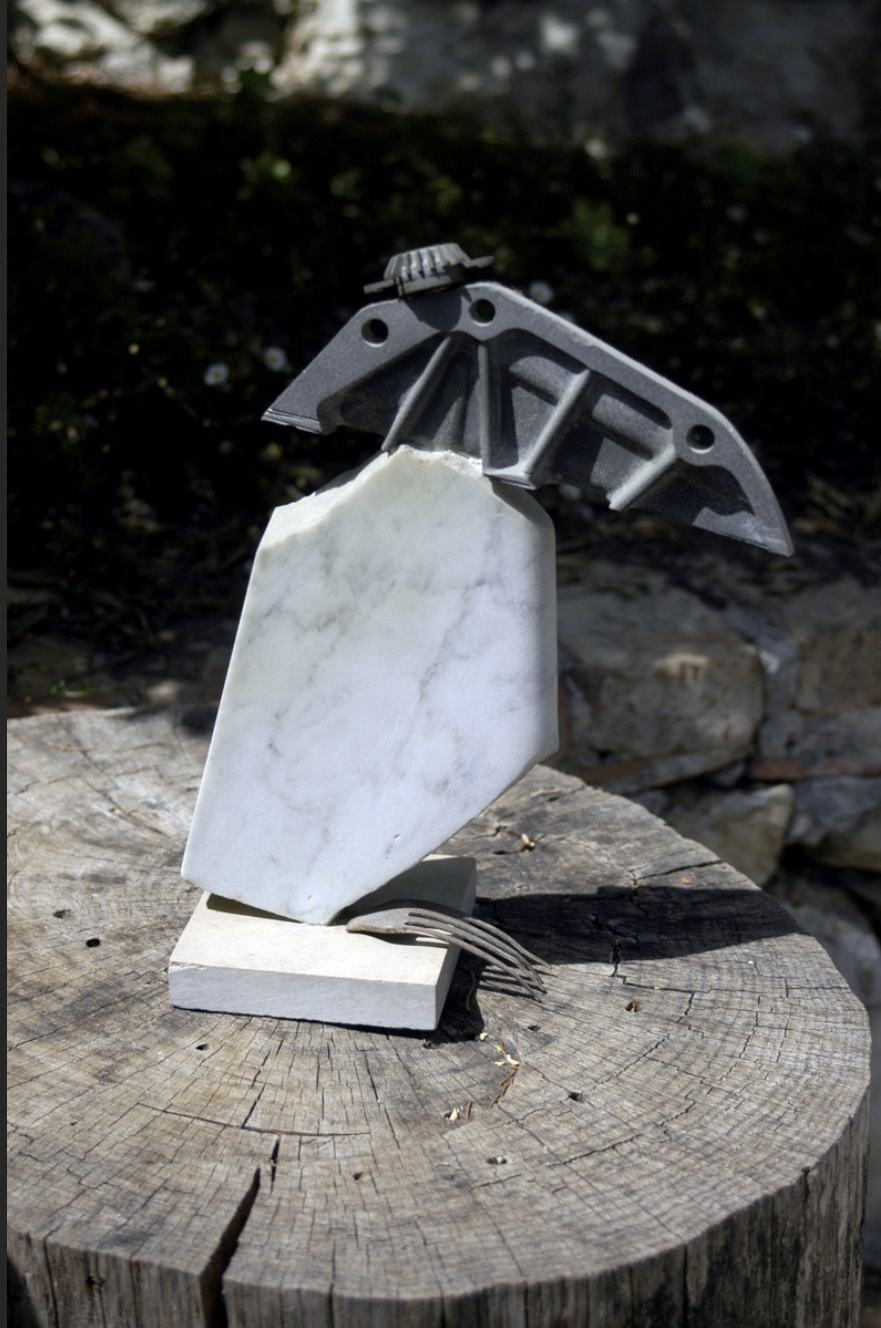
OISEAU, 28 x 22 cm, assemblage métal et marbre