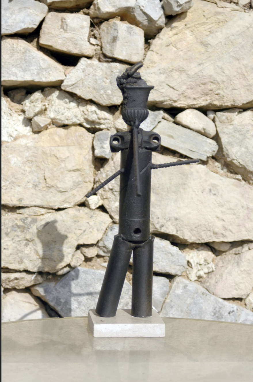
PERSONNAGE, 41 x 19 x 13 cm, assemblage, métal