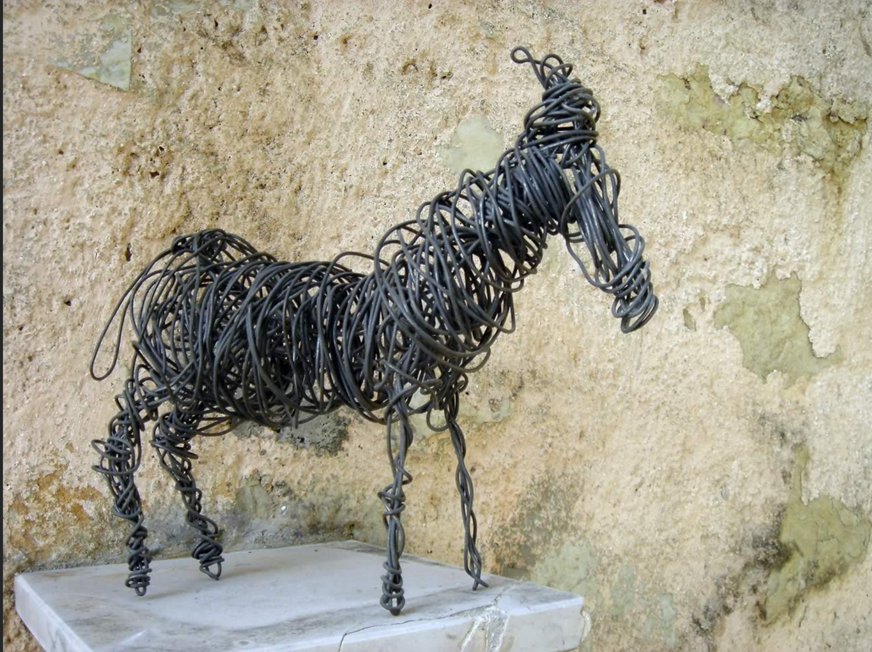
ÂNE, 21 x 26 cm, fil de fer