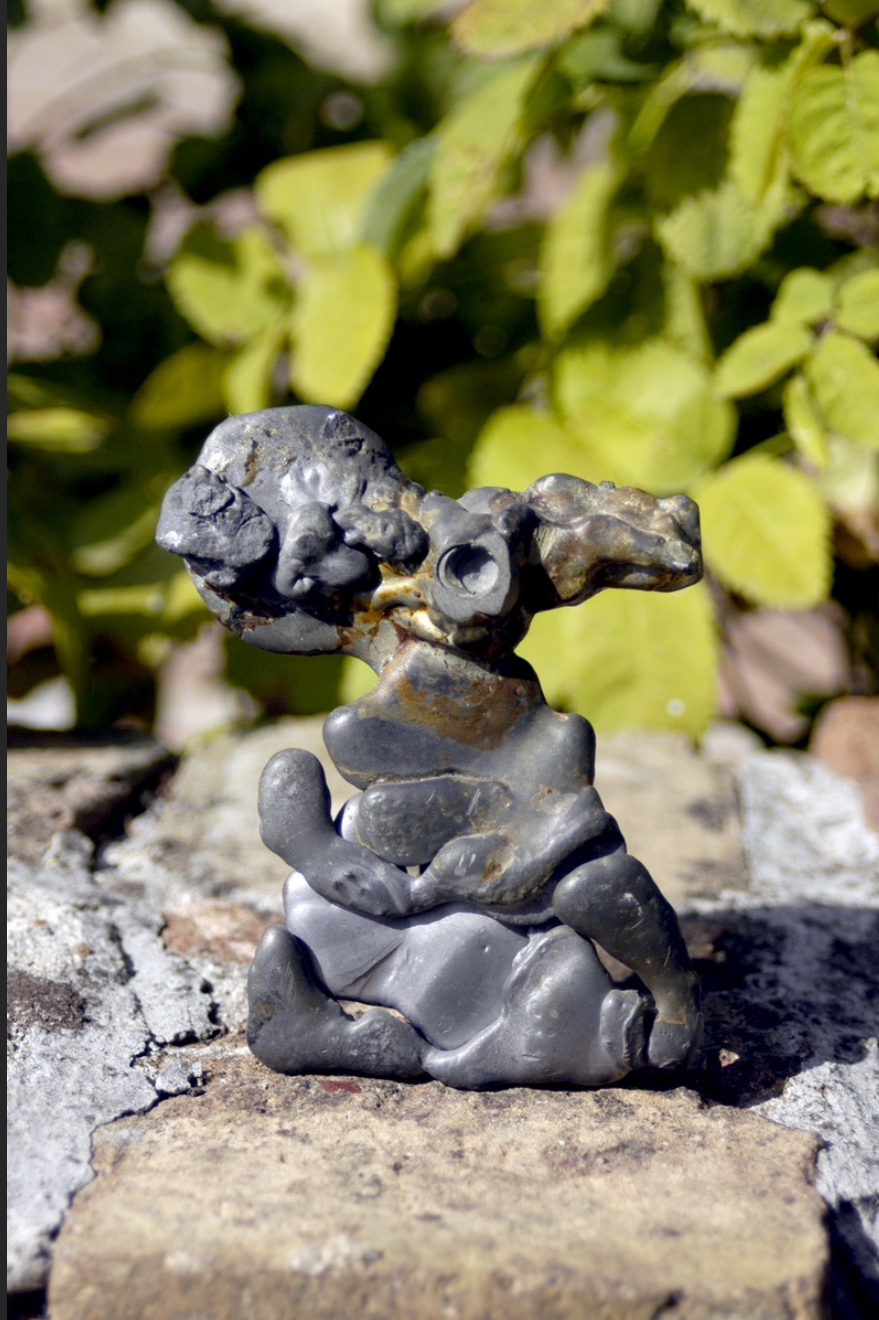
FIGURE, 11 x 8,5 cm, plomb