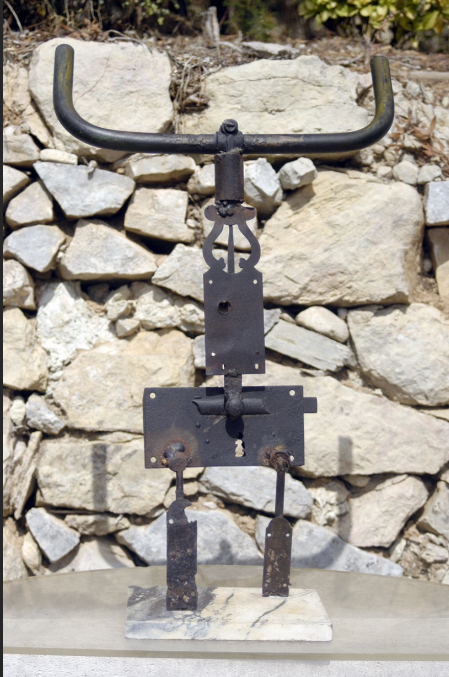
HOMME TAUREAU, 69 x 42 x 14 cm, assemblage, métal