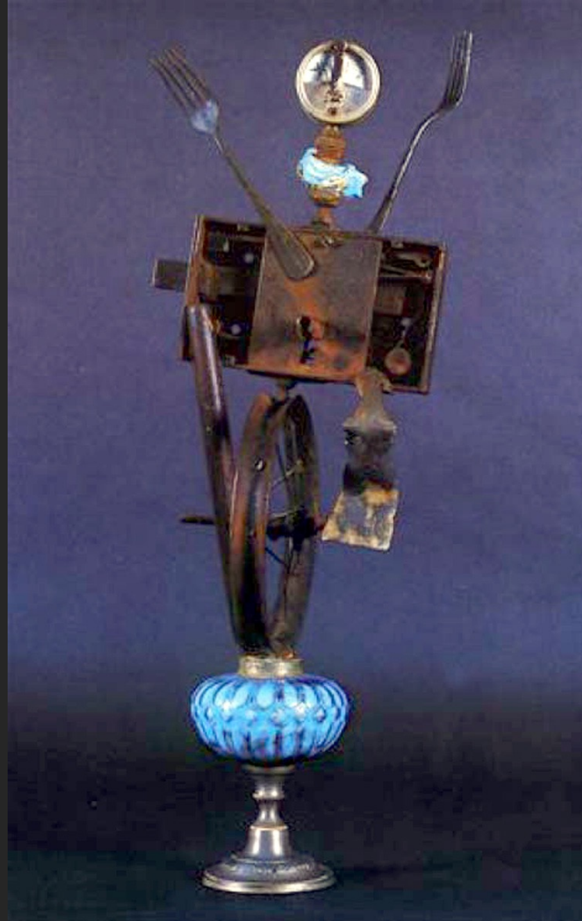
LE CYCLISTE FUNAMBULE DU CIRQUE MEDRANO, 43 x 17 cm, assemblage, verre et métal