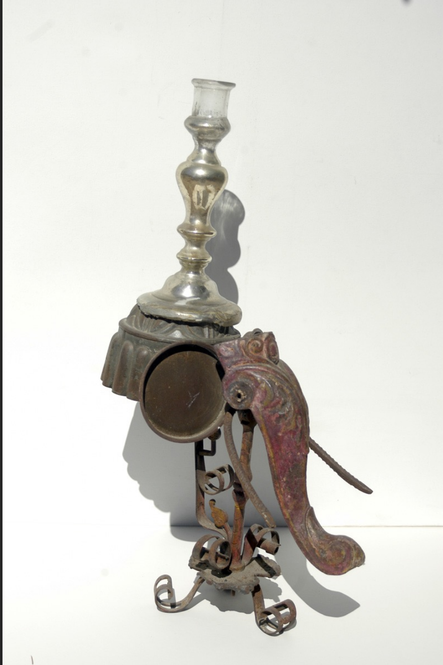
ÉLÉPHANT DE PARADE II, 55,5 x 20 cm, bougeoir métal et verre argenté