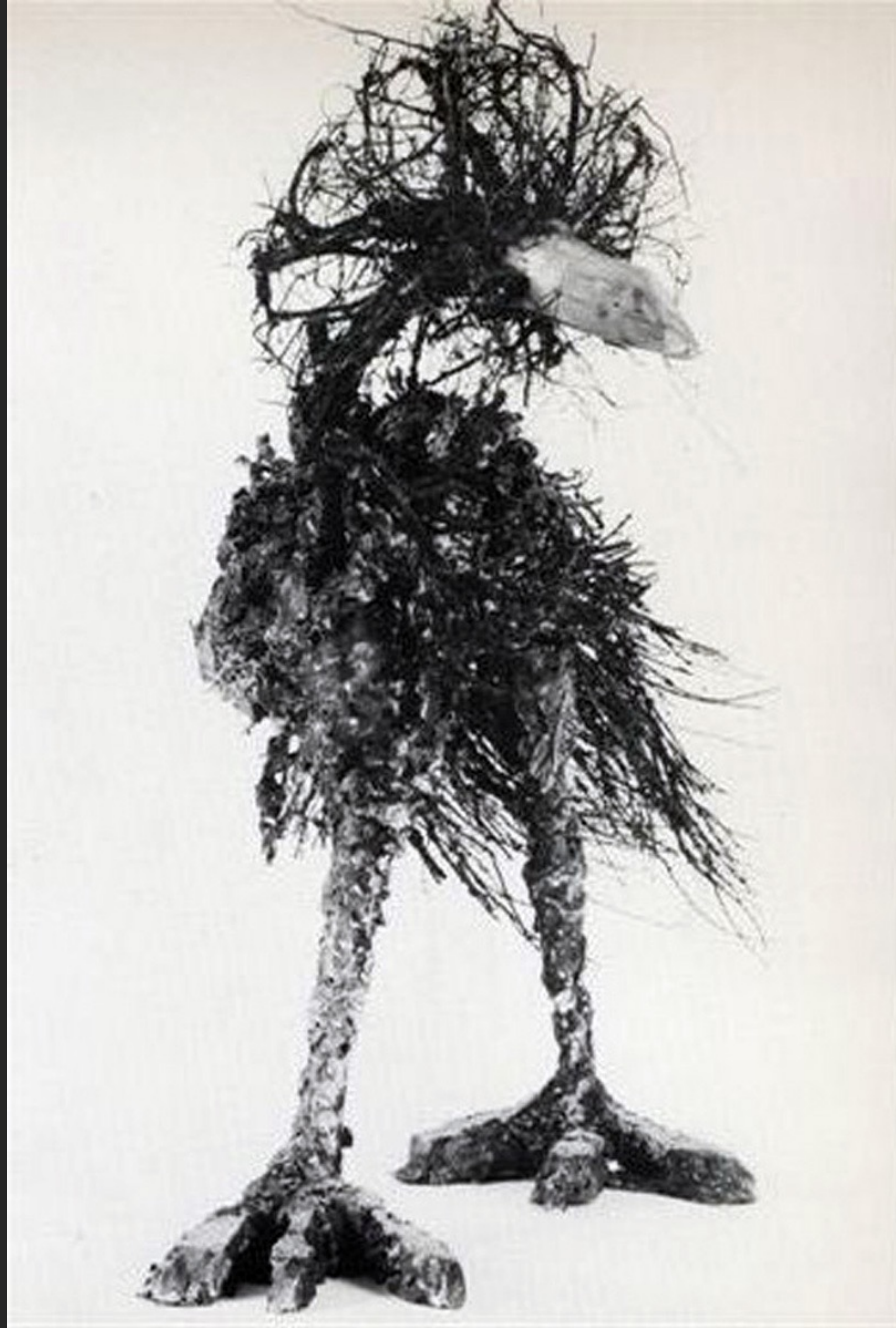
MISTER PICKWICK, OISEAU FANTASTIQUE, 90 x 80 x 50 cm, bois et plâtre