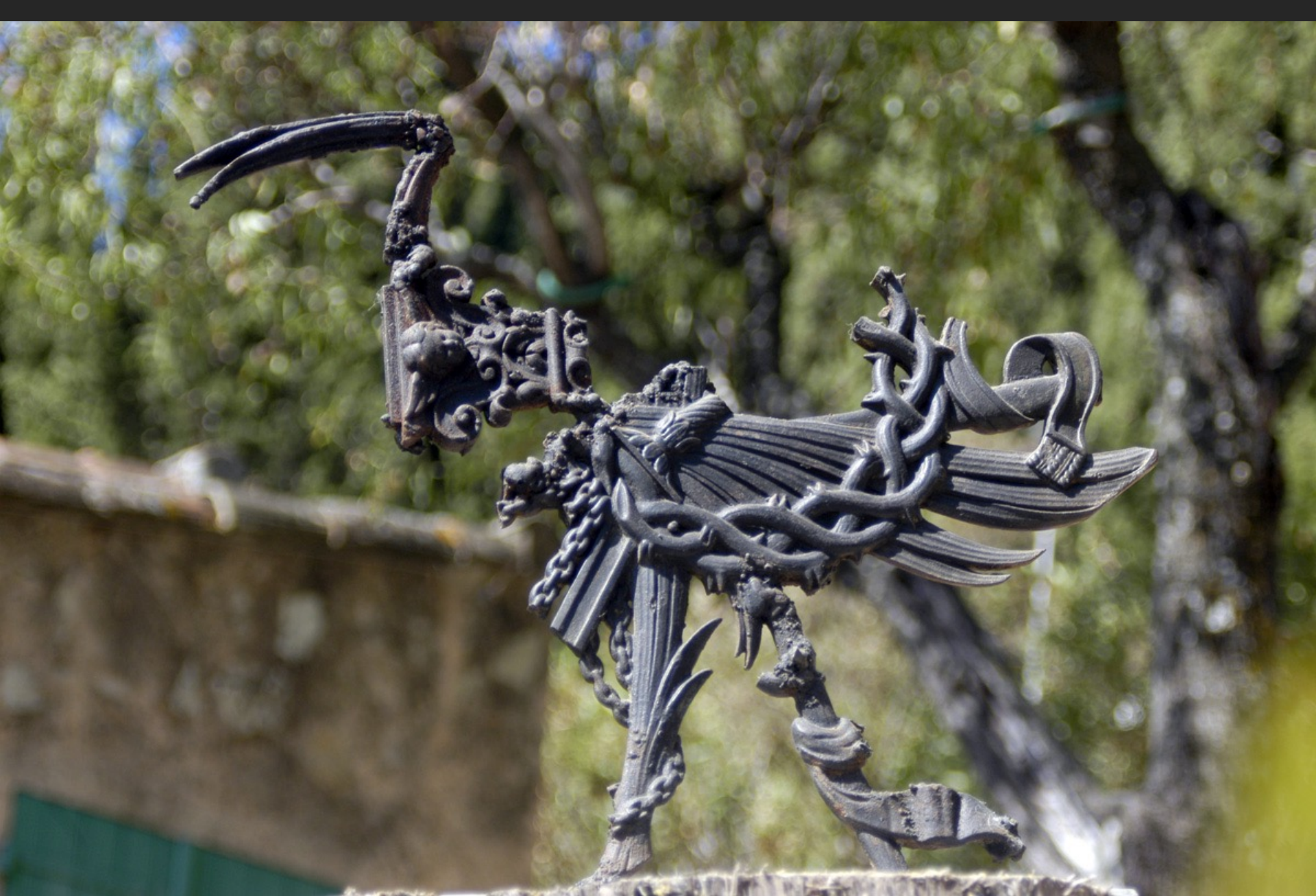
GRAND OISEAU, 41 x 46 cm, assemblage, bronze