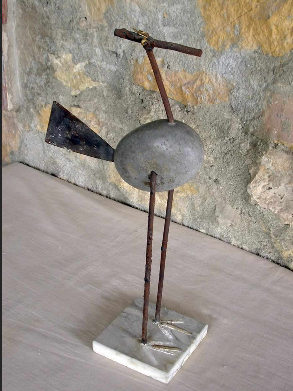
OISEAU-SPATULE, 45 x 22 cm, assemblage, galet, métal et bois