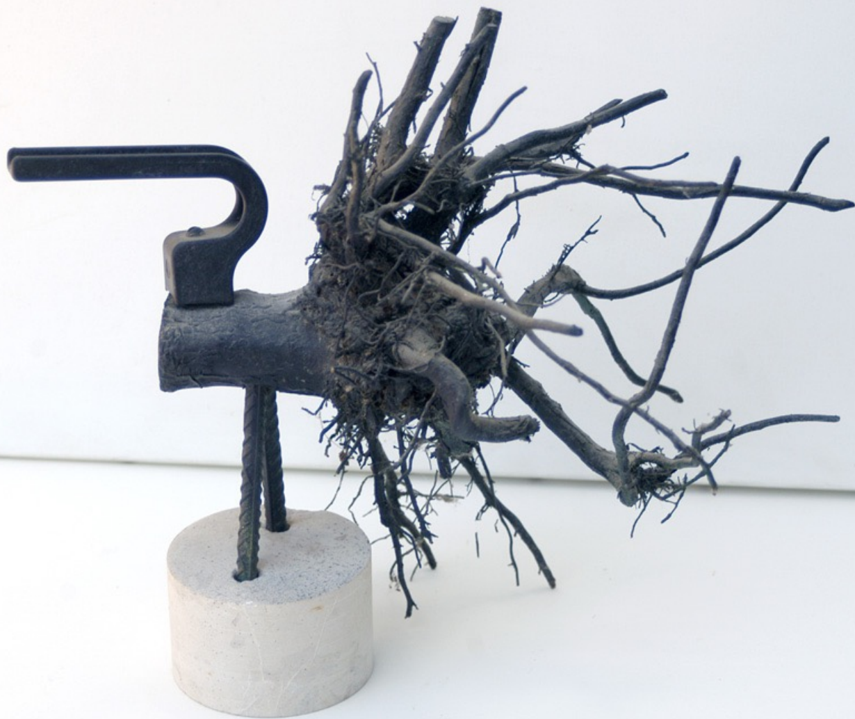
OISEAU NOIR, 26 x 34 cm, assemblage bois et métal