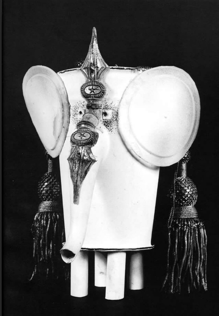
ÉLÉPHANT SACRÉ, 27 x 19 cm, fer et passementerie, bronze