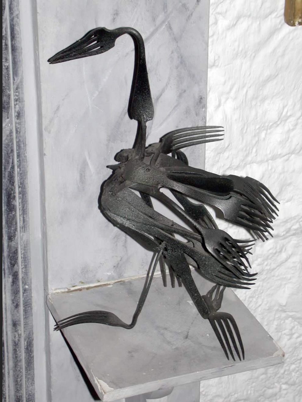
L'OISEAU AUX FOURCHETTES, 37 x 26 cm, assemblage, fer