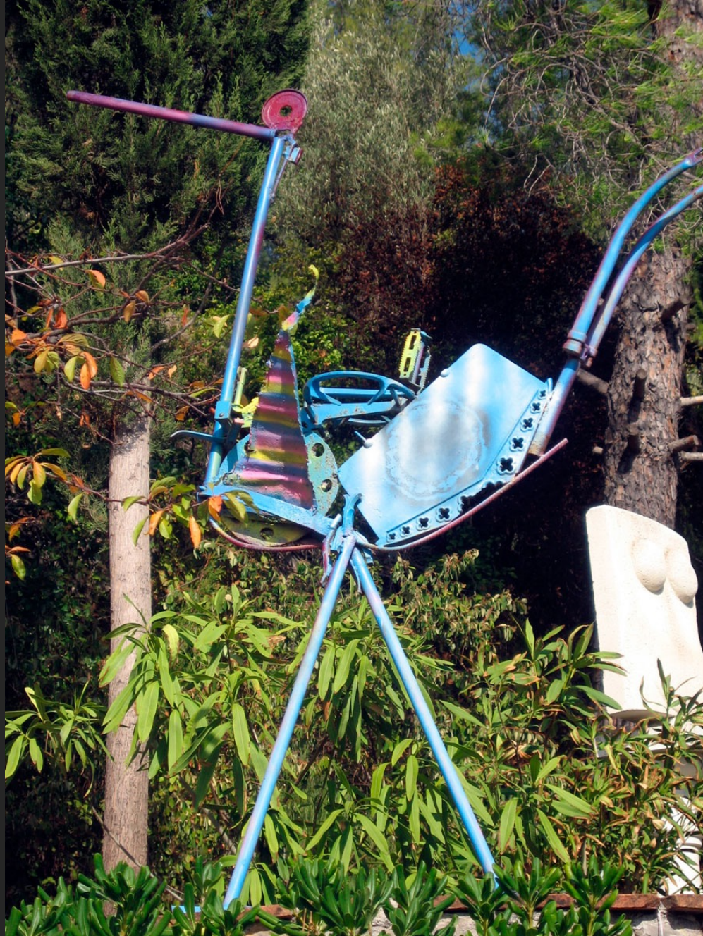
GRAND OISEAU BLEU, 155 x 127 x 52 cm, assemblage