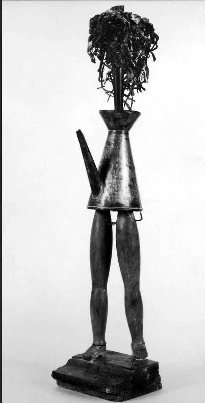
HOMMAGE À TOULOUSE-LAUTREC, 57 x 13 cm, assemblage, fer et bois