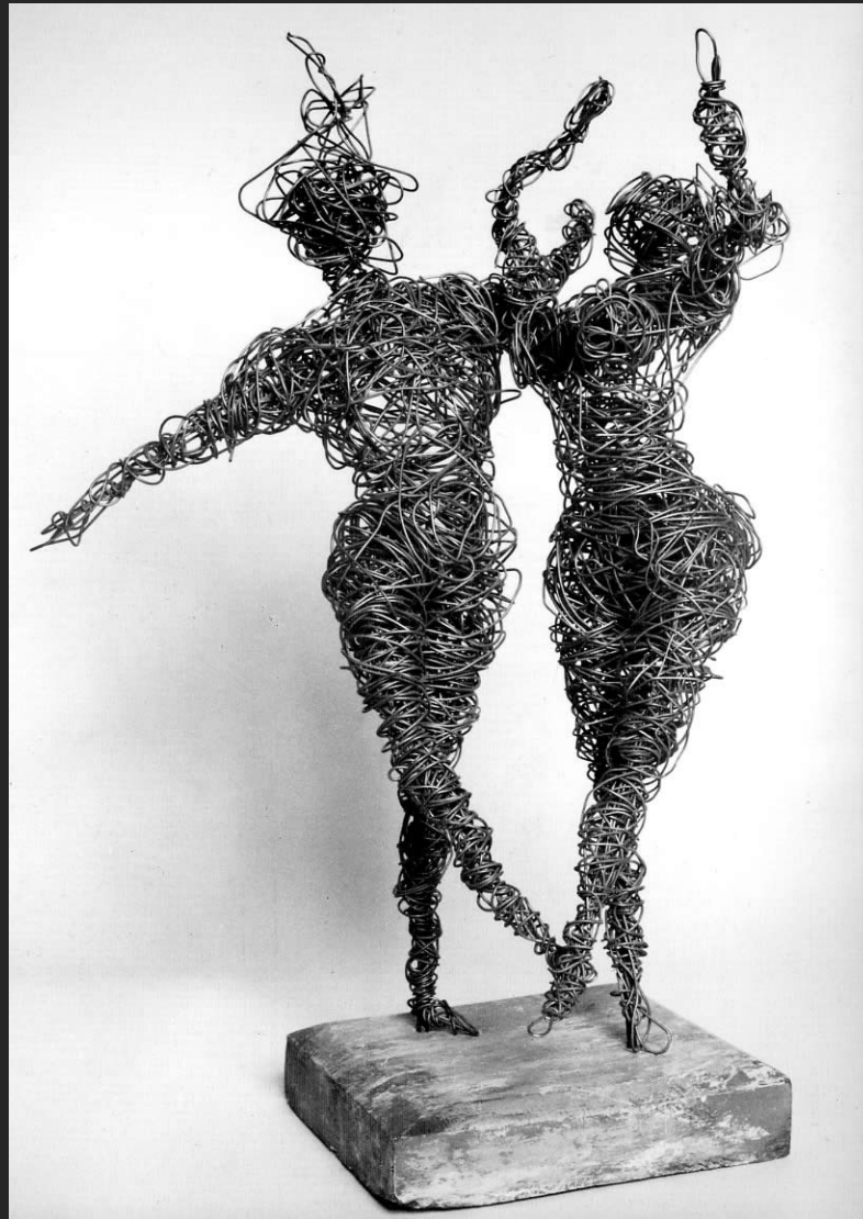
COUPLES DE DANSEURS (HOMMAGE AU MARQUIS DE CUEVAS), 59 x 26 cm, fil de fer