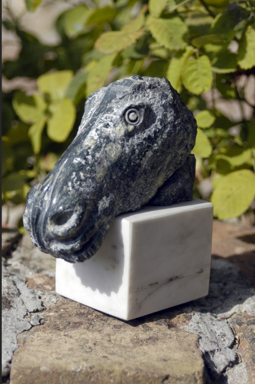
TÊTE DE CHEVAL, 15 x 14 cm, pierre