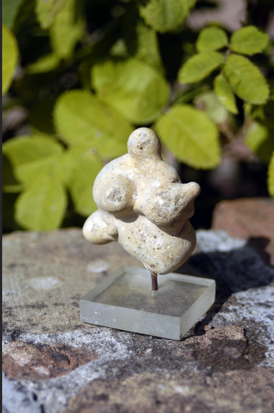
SILHOUETTE, 7 x 5,5 cm, pierre