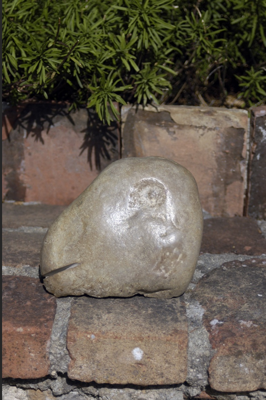
BÊTE, PIERRE D'ARAGON, 15 x 18 cm, pierre