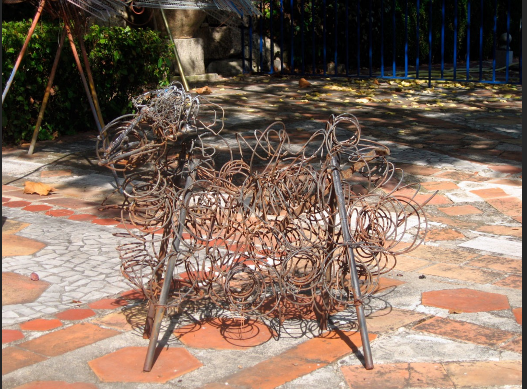
MOUTON, 66 x 82 x 55 cm, assemblage