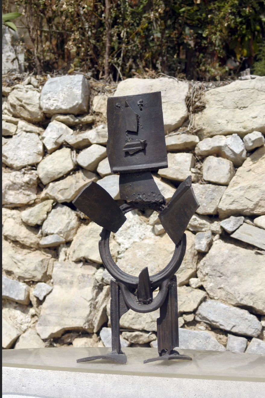
PERSONNAGE, 55,5 x 25 x 13 cm, assemblage, métal