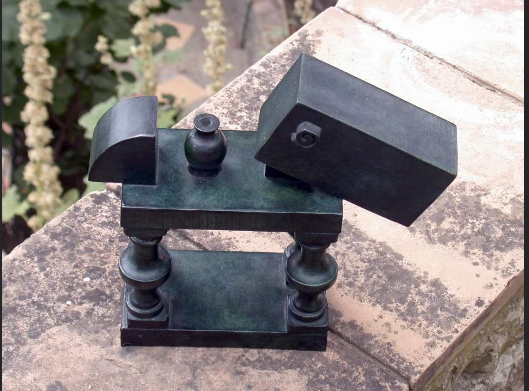
CHEVAL I, 23 x 24 cm, bronze