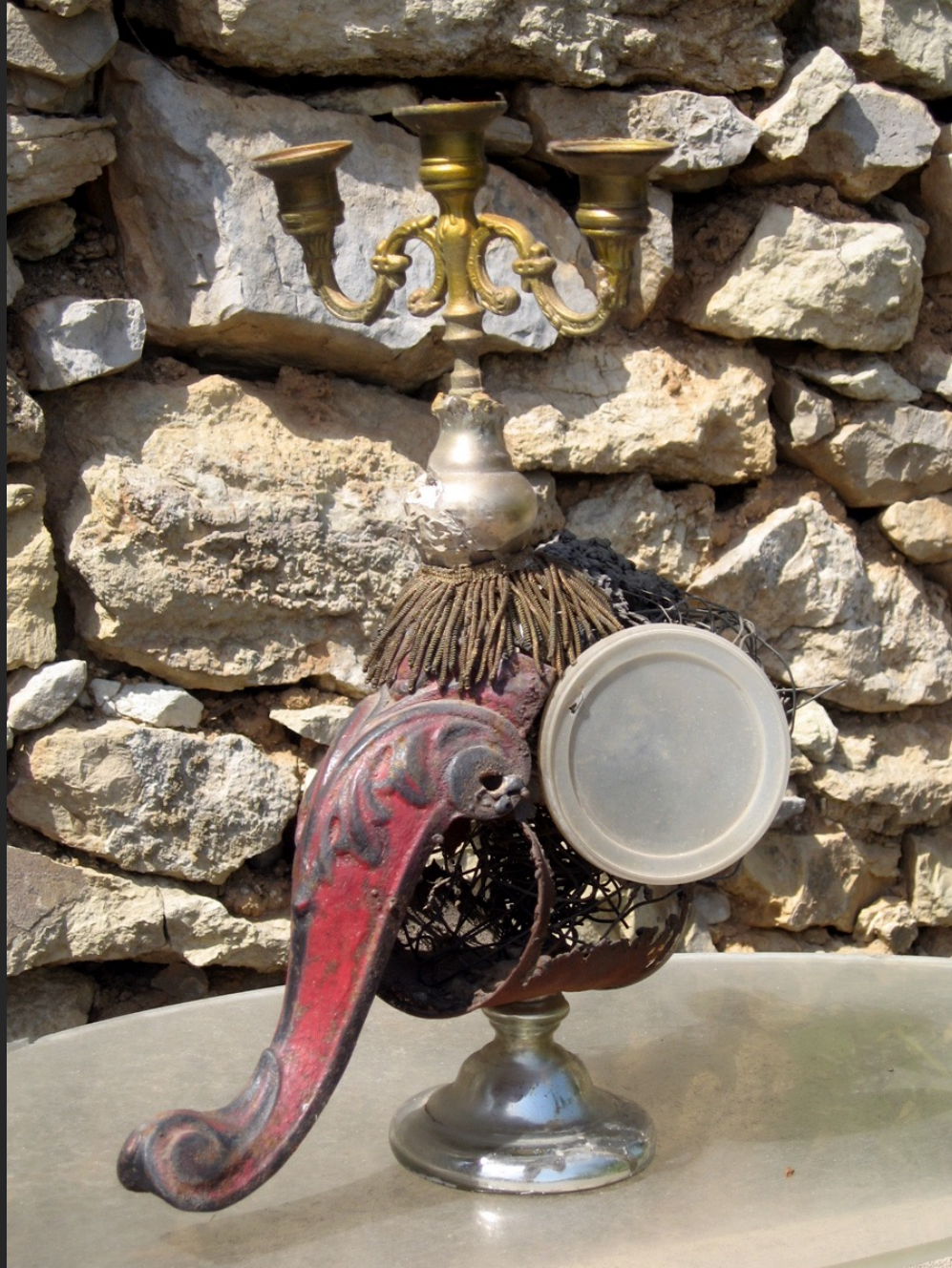
ÉLÉPHANT DE PARADE I, 39 x 25 cm, bougeoir métal et verre argenté