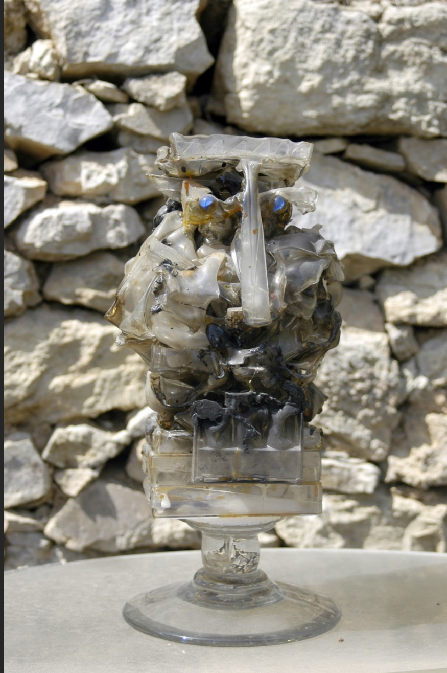
GUERRIER, 45 x 22 x 20 cm, assemblage, verre et plastique