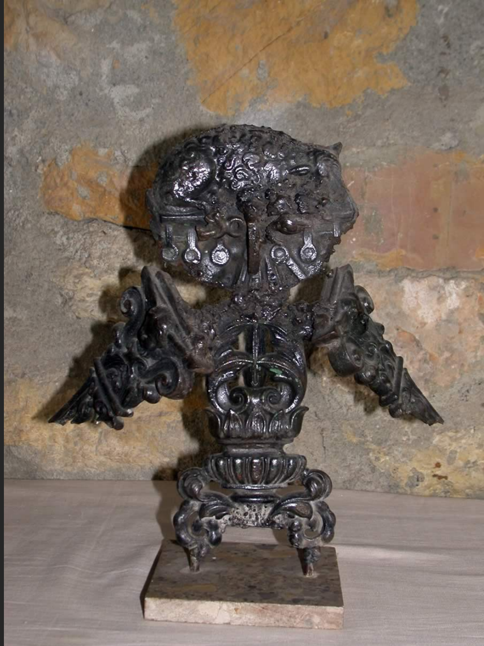
OISEAU DE NUIT, 27 x 20 cm, fonte