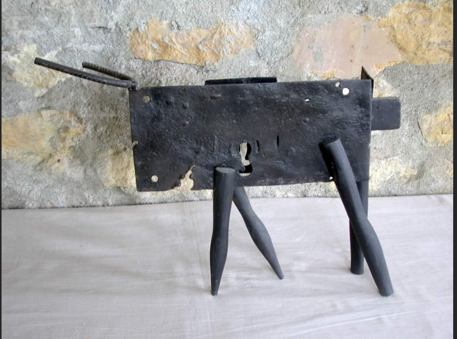
TAUREAU SERRURE, 32 x 45 cm, assemblage, métal et bois