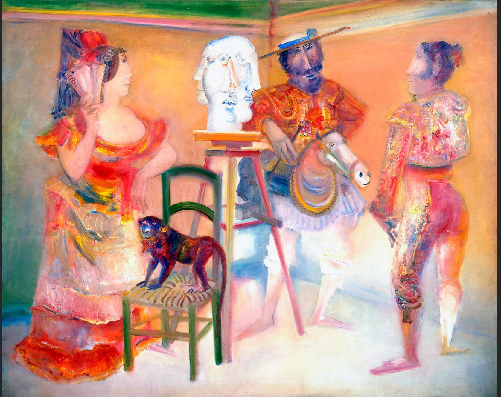
PORTRAIT, 1974-75, huile sur toile, 204 x 265 cm