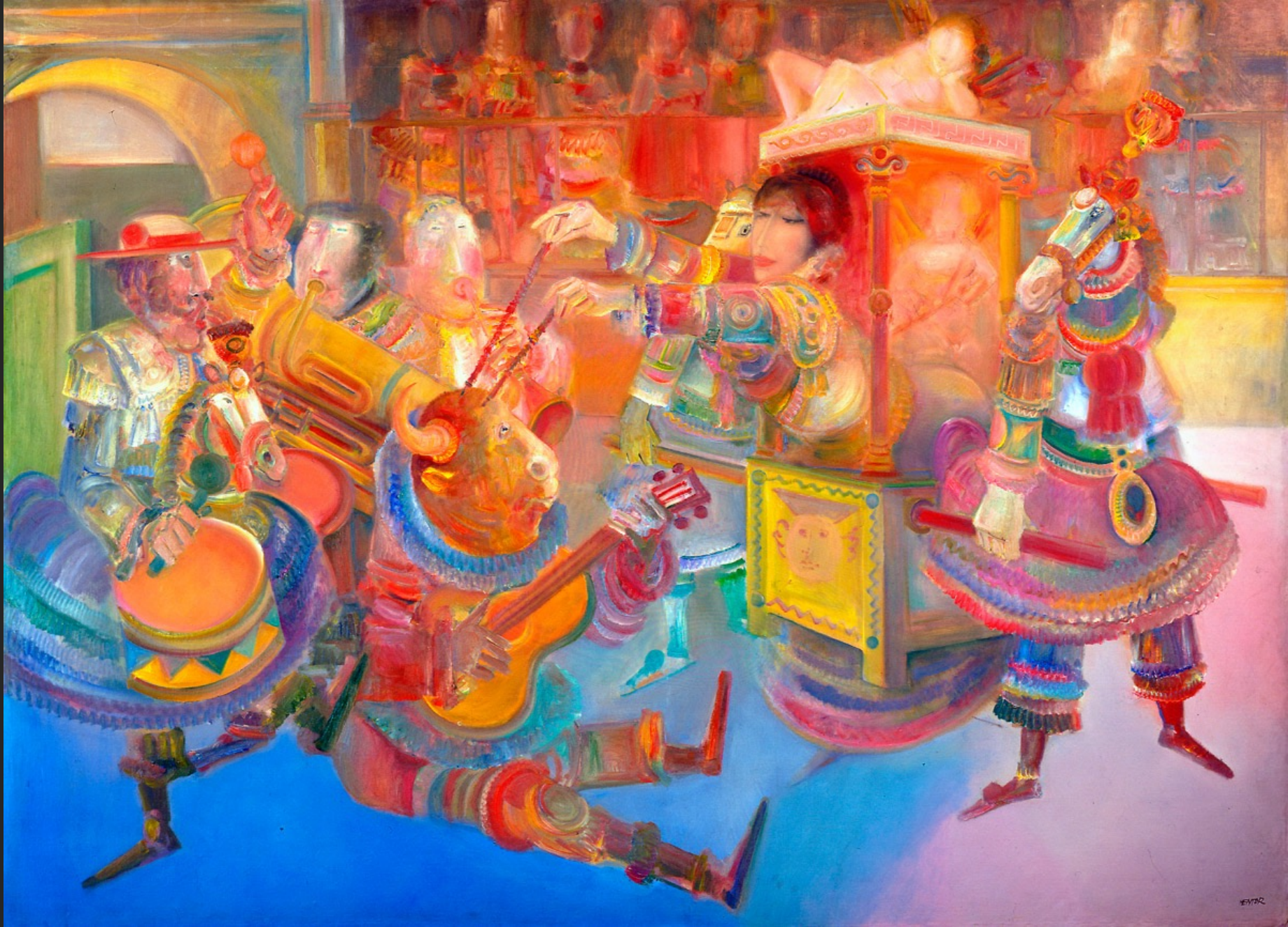
SÉRÉNADE, 1974-75, huile sur toile, 204 x 282 cm