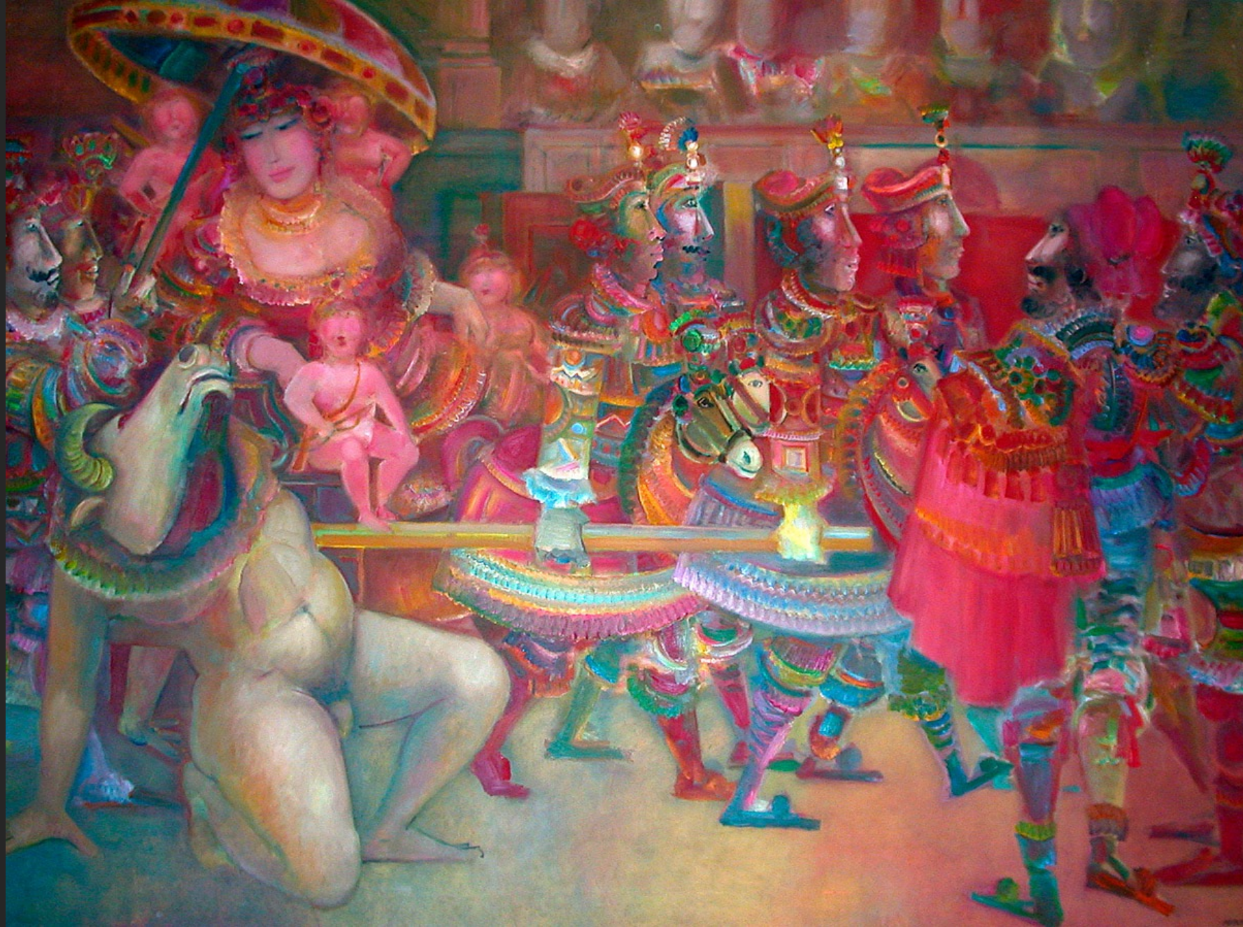
GÉNUFLEXION, 1974-75, huile sur toile, 204 x 280 cm