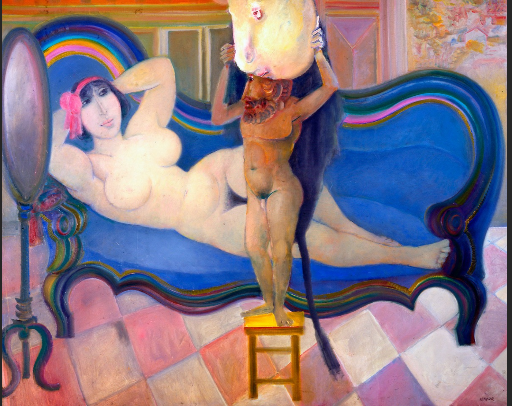
NU AU CANAPÉ BLEU, 1974-75, huile sur toile, 192 x 212 cm