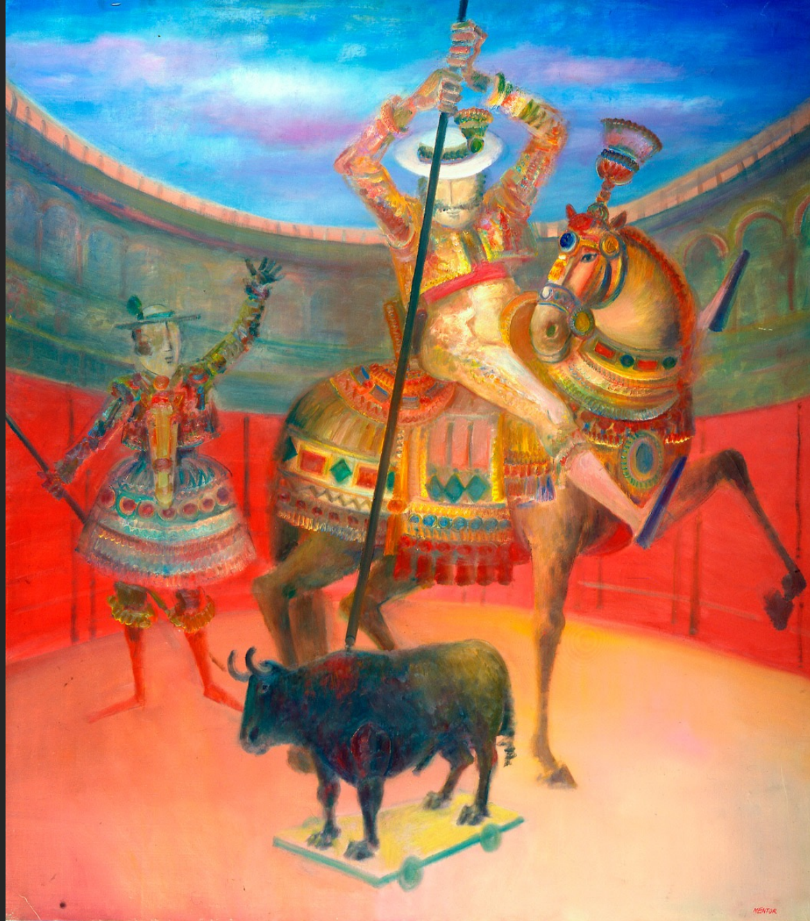
LA REVANCHE, 1974-75, huile sur toile, 220 x 292 cm