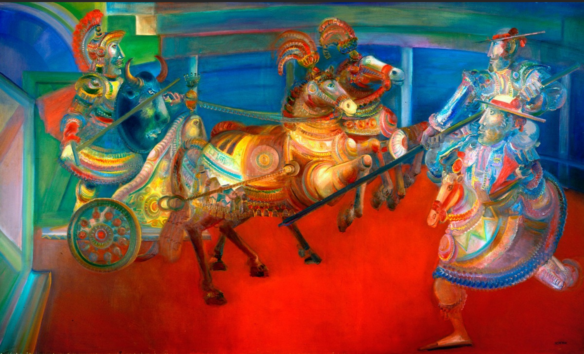
LA SURPRISE, 1974-75, huile sur toile, 192 x 84 cm