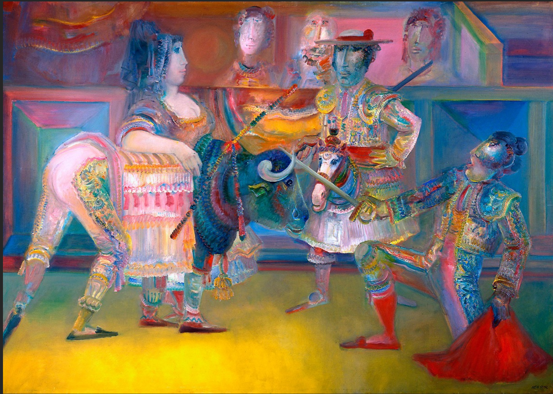
LE FAUX MATADOR, 1974-75, huile sur toile, 192 x 273 cm