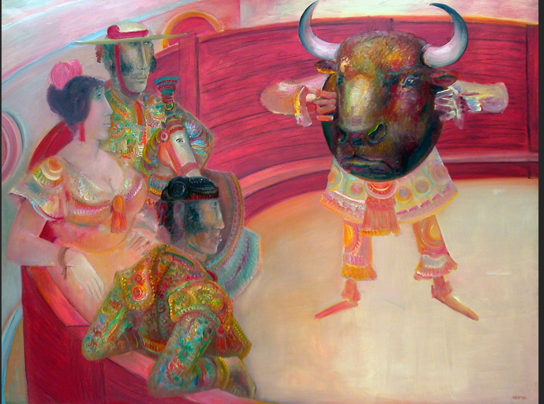
LE MASQUE, 1974-75, huile sur toile, 192 x 253 cm