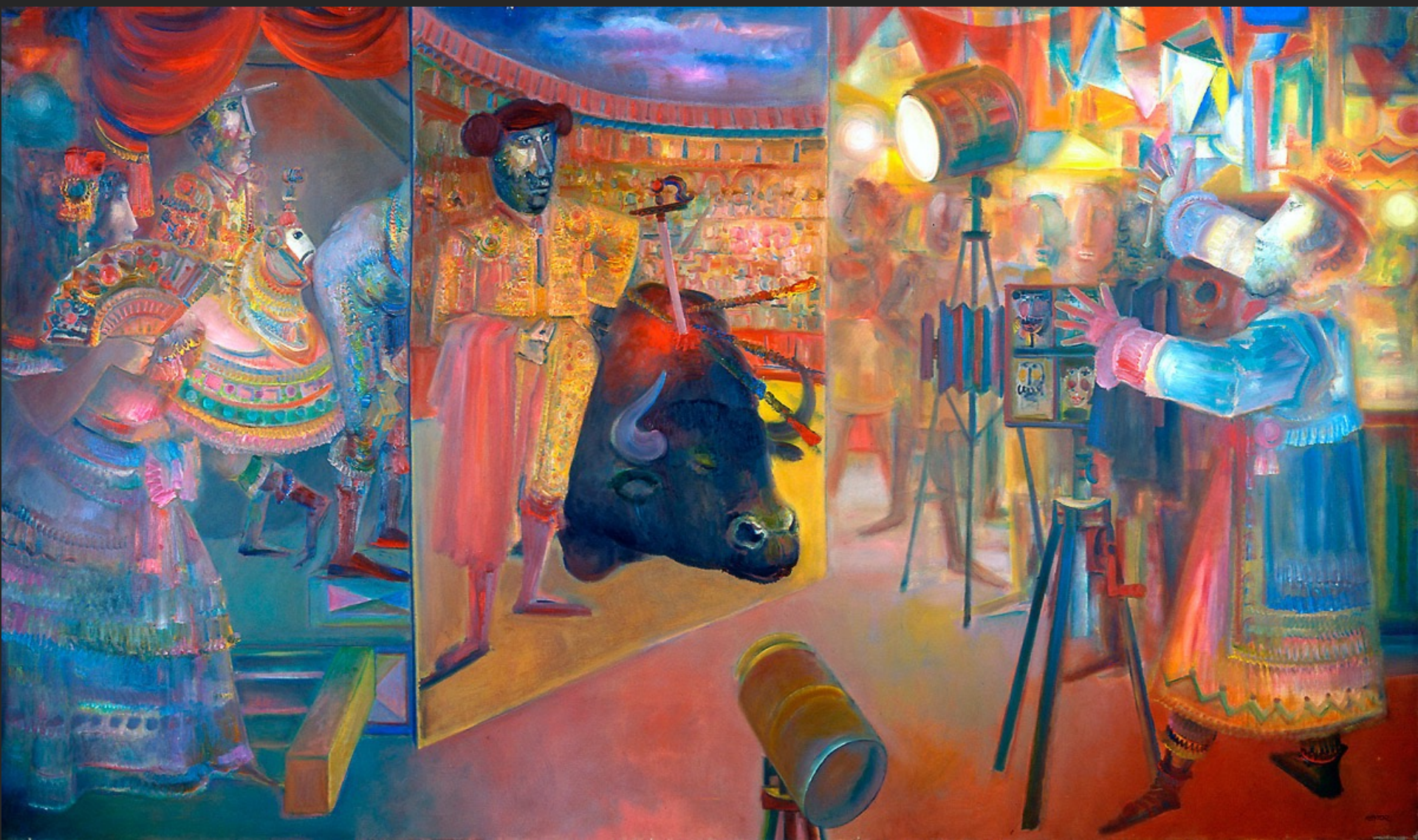
LE PHOTOGRAPHE, 1974-75, huile sur toile, 191 x 285 cm