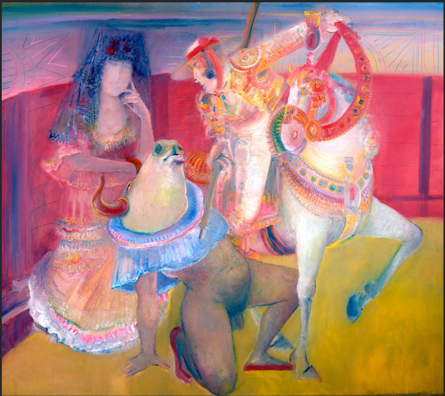
LA MANOLA, 1974-75, huile sur toile, 204 x 234 cm