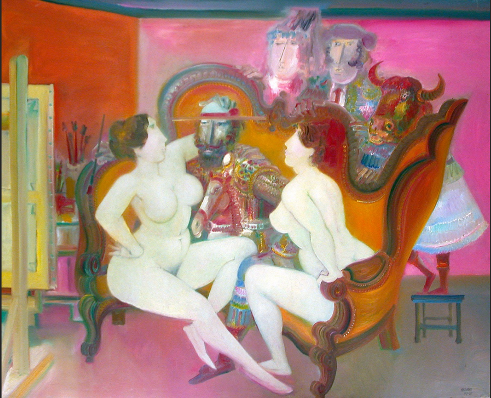
LES DEUX MODÈLES, 1974-75, huile sur toile, 192 x 256 cm