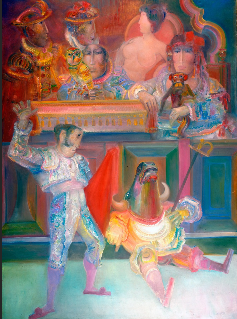
LE JUGEMENT, 1974-75, huile sur toile, 260 x 193 cm