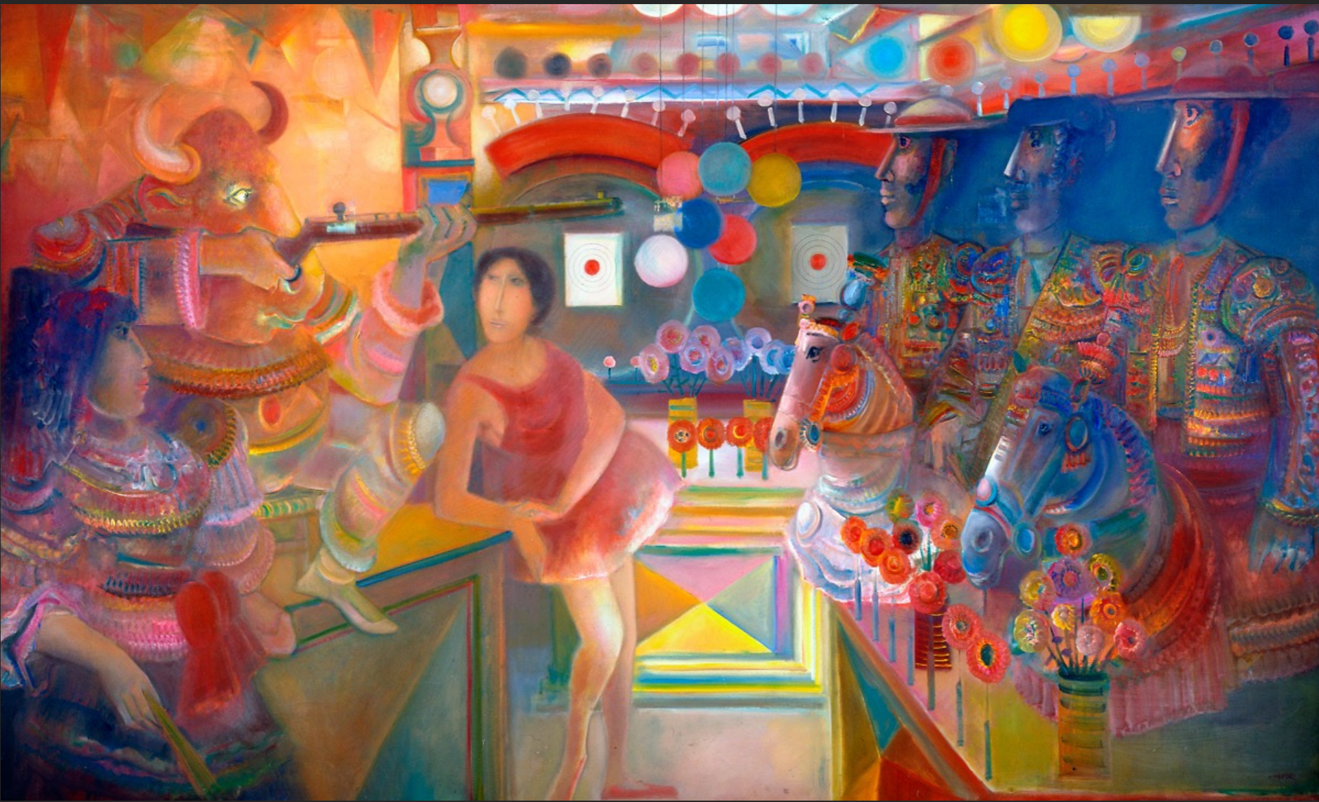
LE TIR FORAIN, 1974-75, huile sur toile, 204 x 336 cm