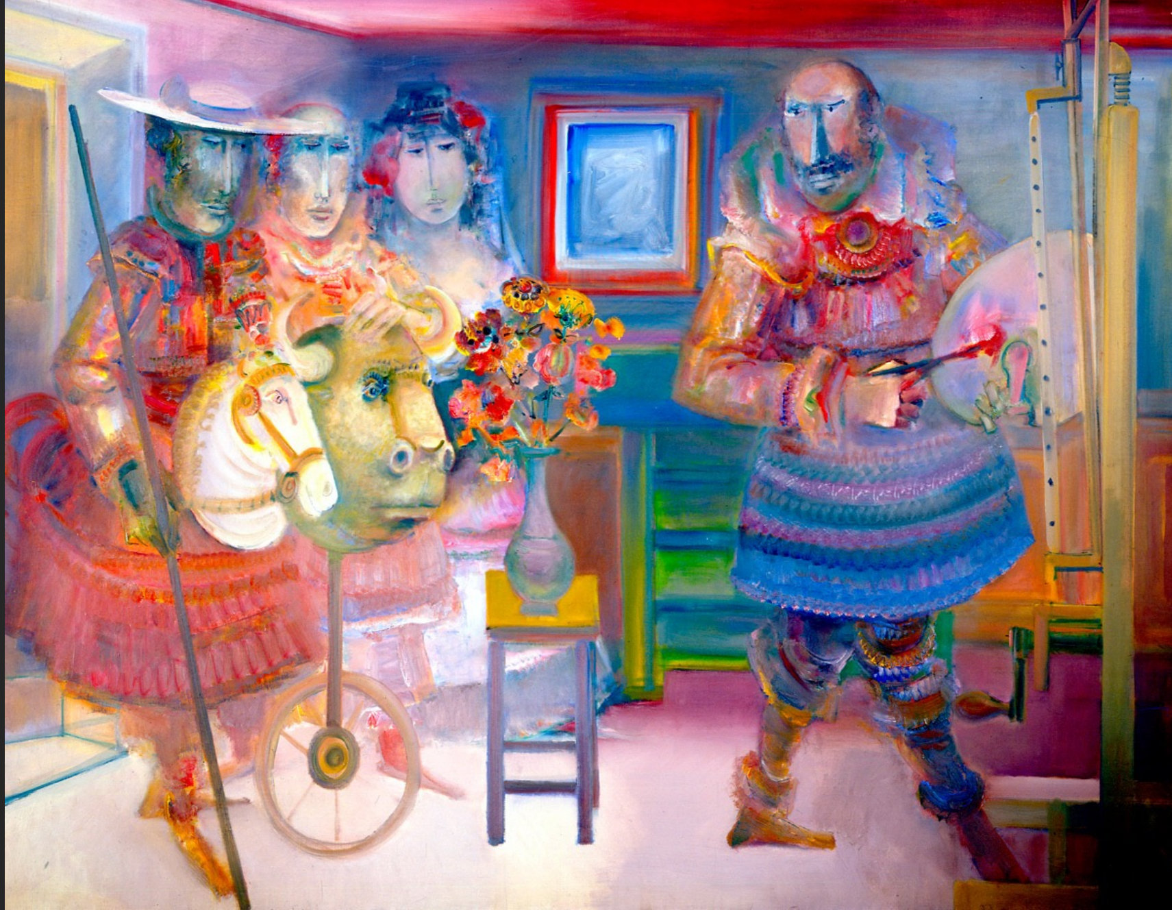
LE BOUQUET, 1974-75, huile sur toile, 204 x 265 cm