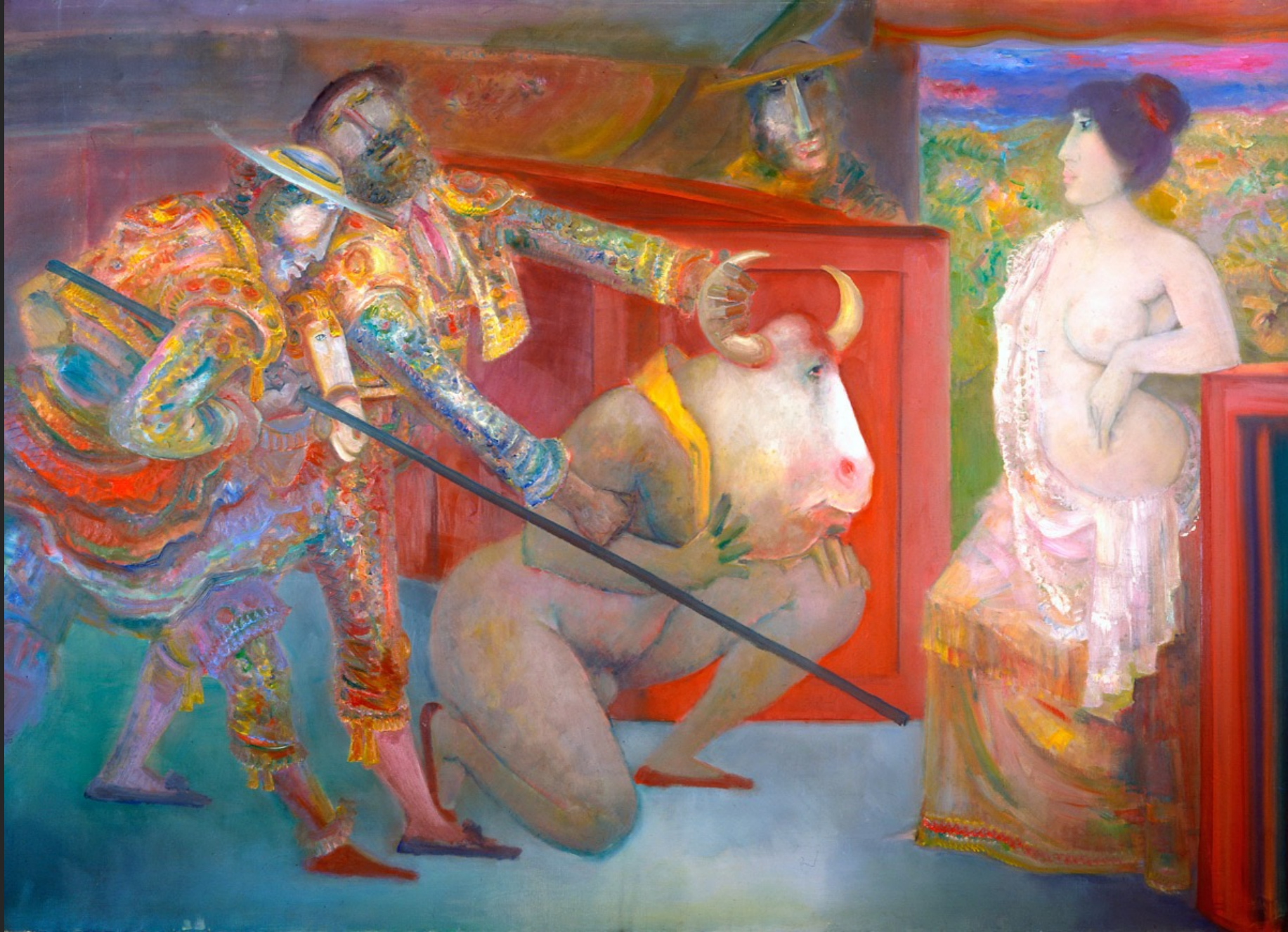
LIBERTÉ, 1974-75, huile sur toile, 204 x 285 cm