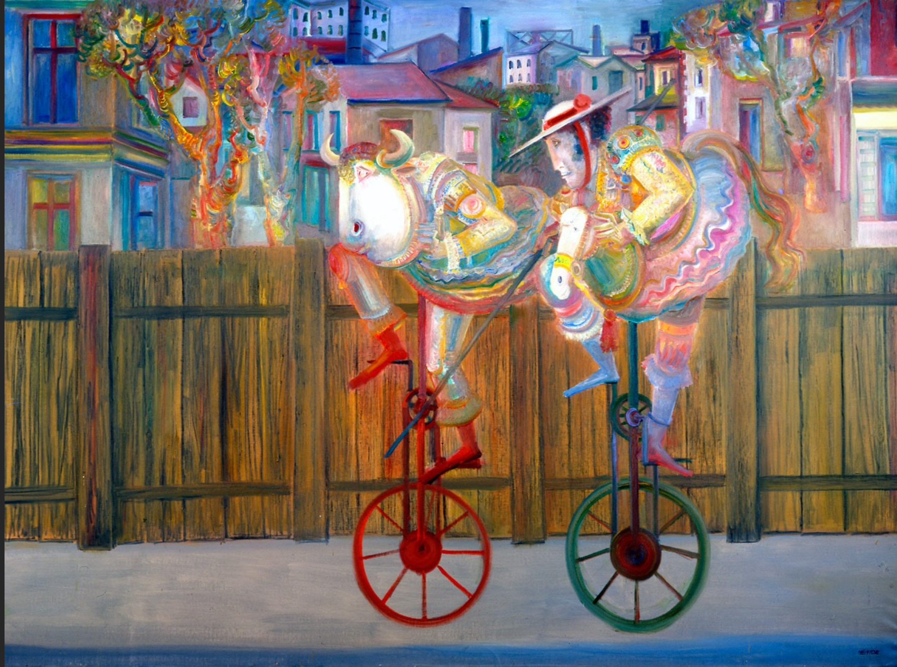
FUITE IMPOSSIBLE, 1974-75, huile sur toile, 204 x 280 cm