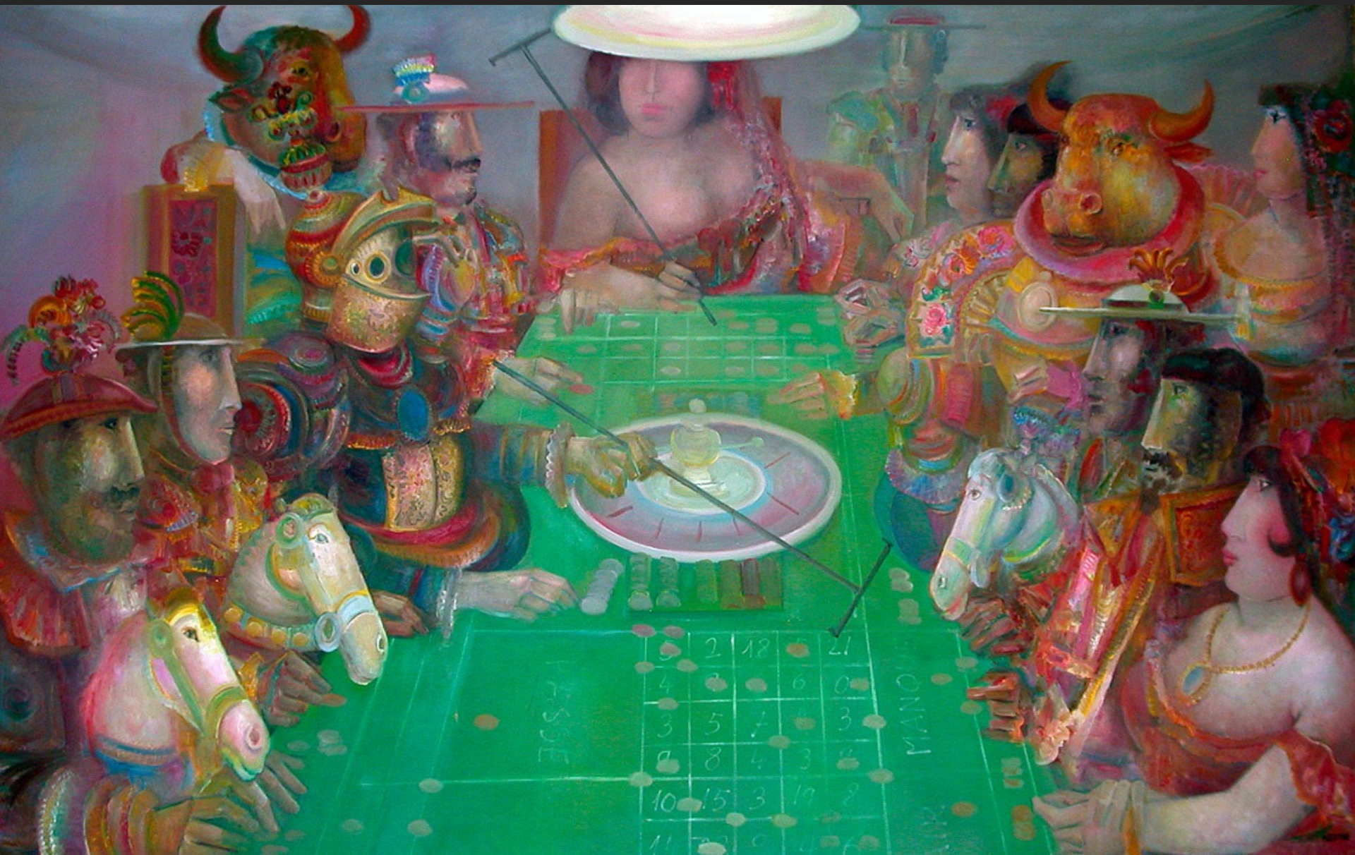
LA ROULETTE, 1974-75, huile sur toile, 203 x 317 cm