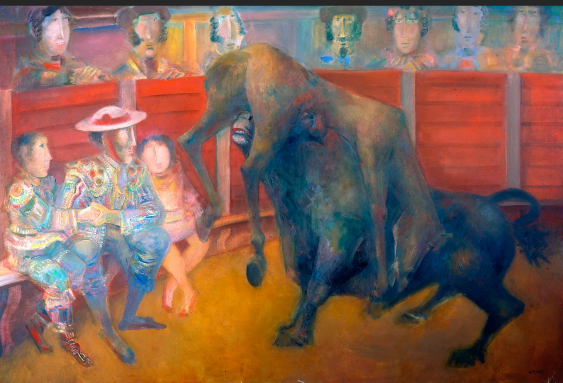
CHÂTIMENT, 1974-75, huile sur toile, 191 x 285 cm