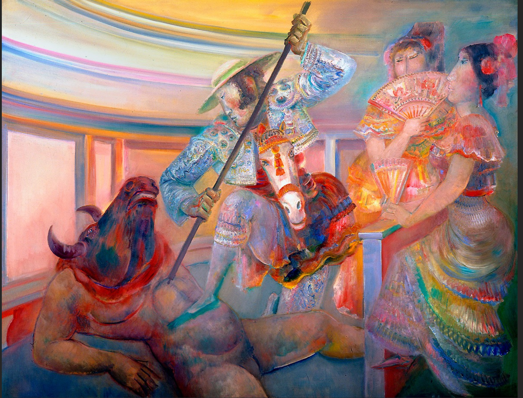
LUTTE, 1974-75, huile sur toile, 204 x 265 cm