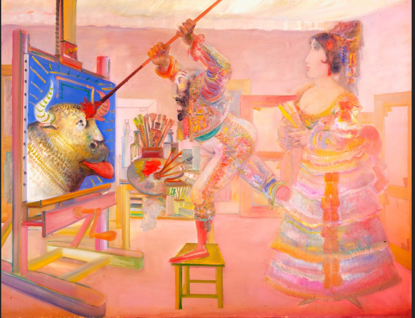
SORT LA LANGUE, 1974-75, huile sur toile, 204 x 267 cm