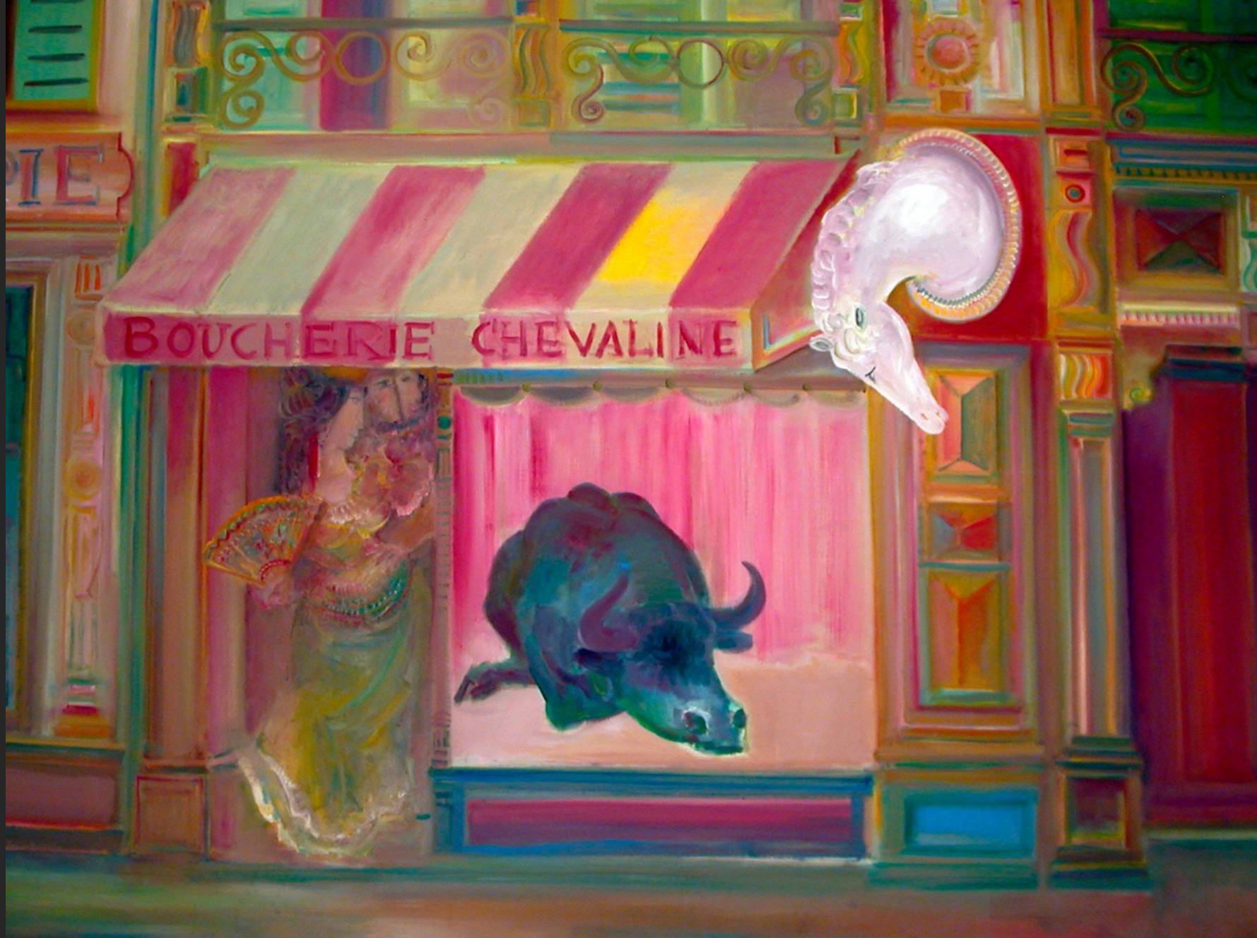
BOUCHERIE CHEVALINE, 1974-75, huile sur toile, 204 x 275 cm