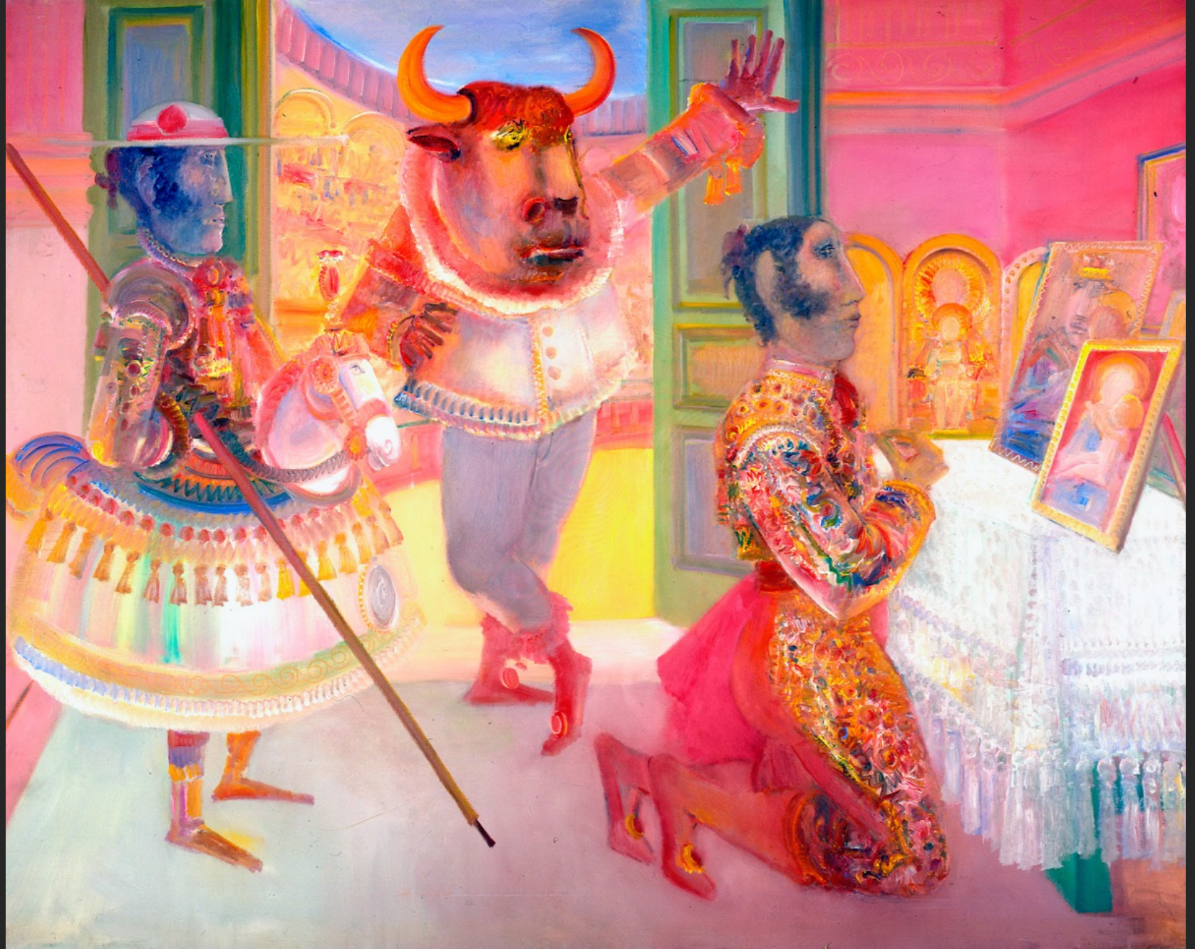
LA PEUR, 1974-75, huile sur toile, 204 x 256 cm