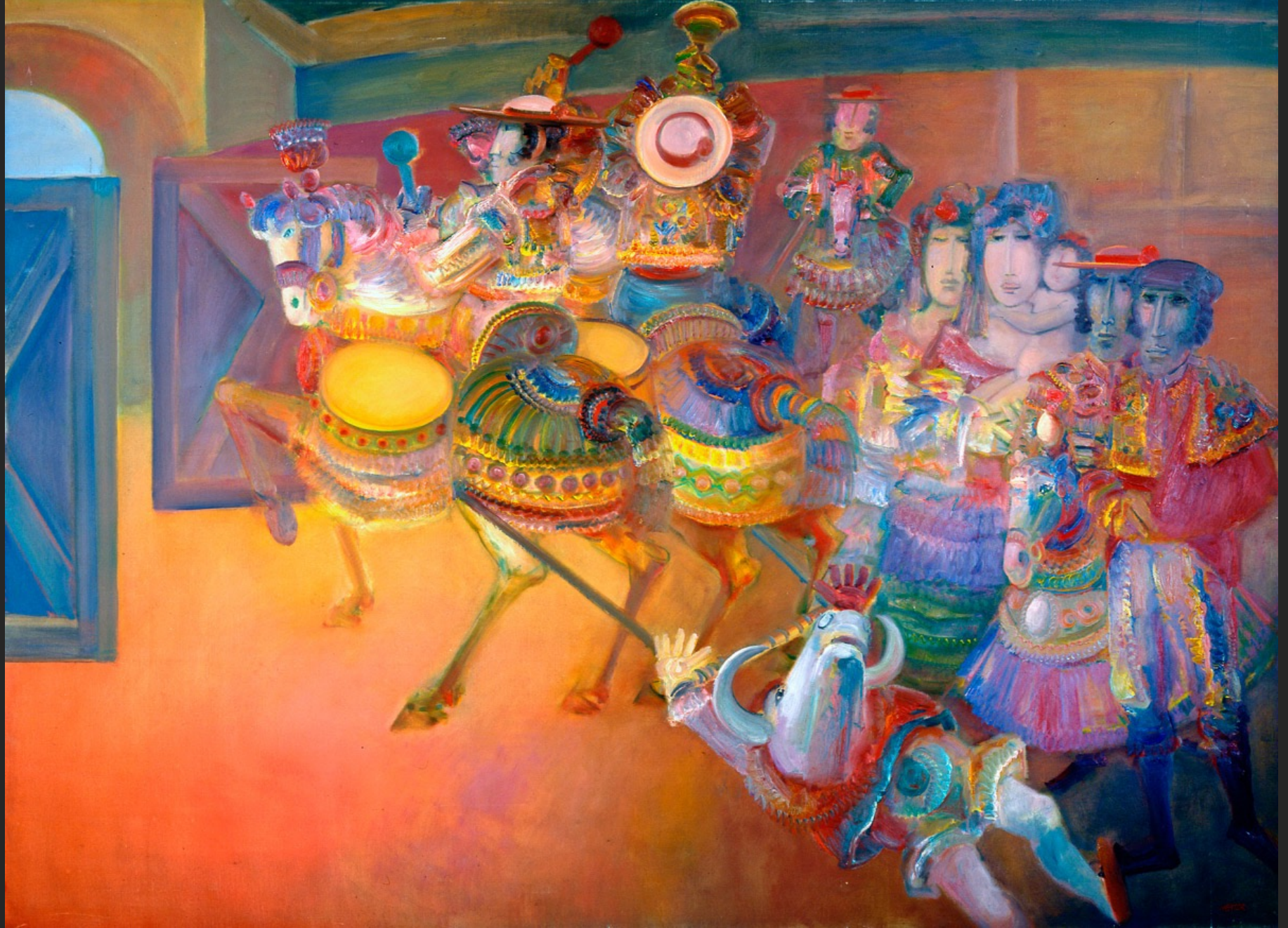
EL ARASTRO, 1974-75, huile sur toile, 204 x 276 cm