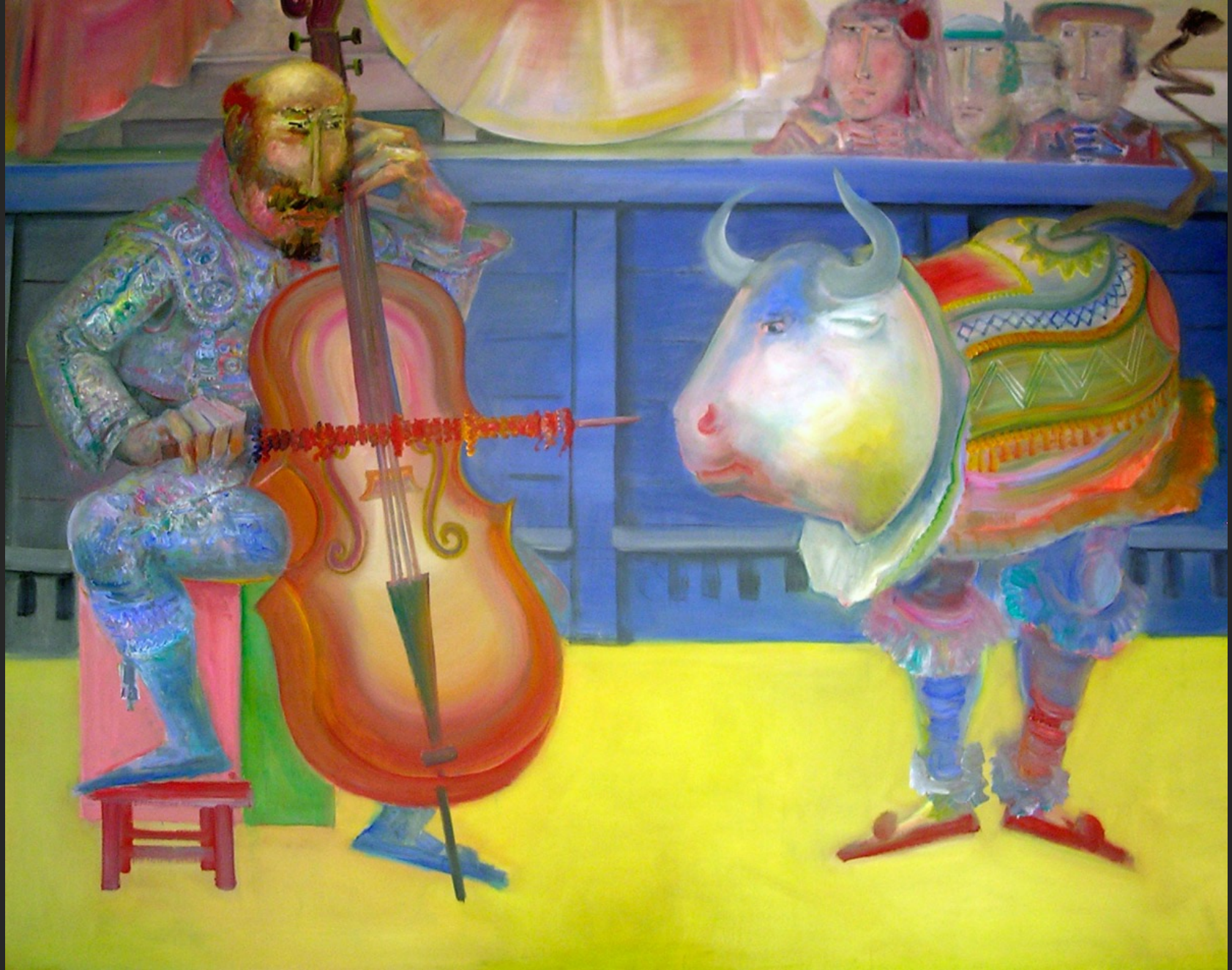
VIOLONCELLE, 1974-75, huile sur toile, 204 x 265 cm