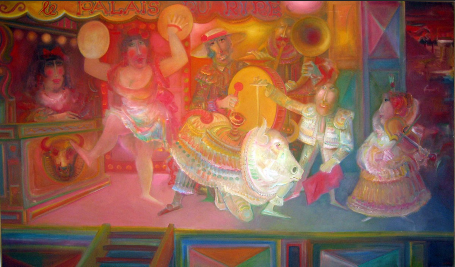
PARADE, 1974-75, huile sur toile, 204 x 341 cm