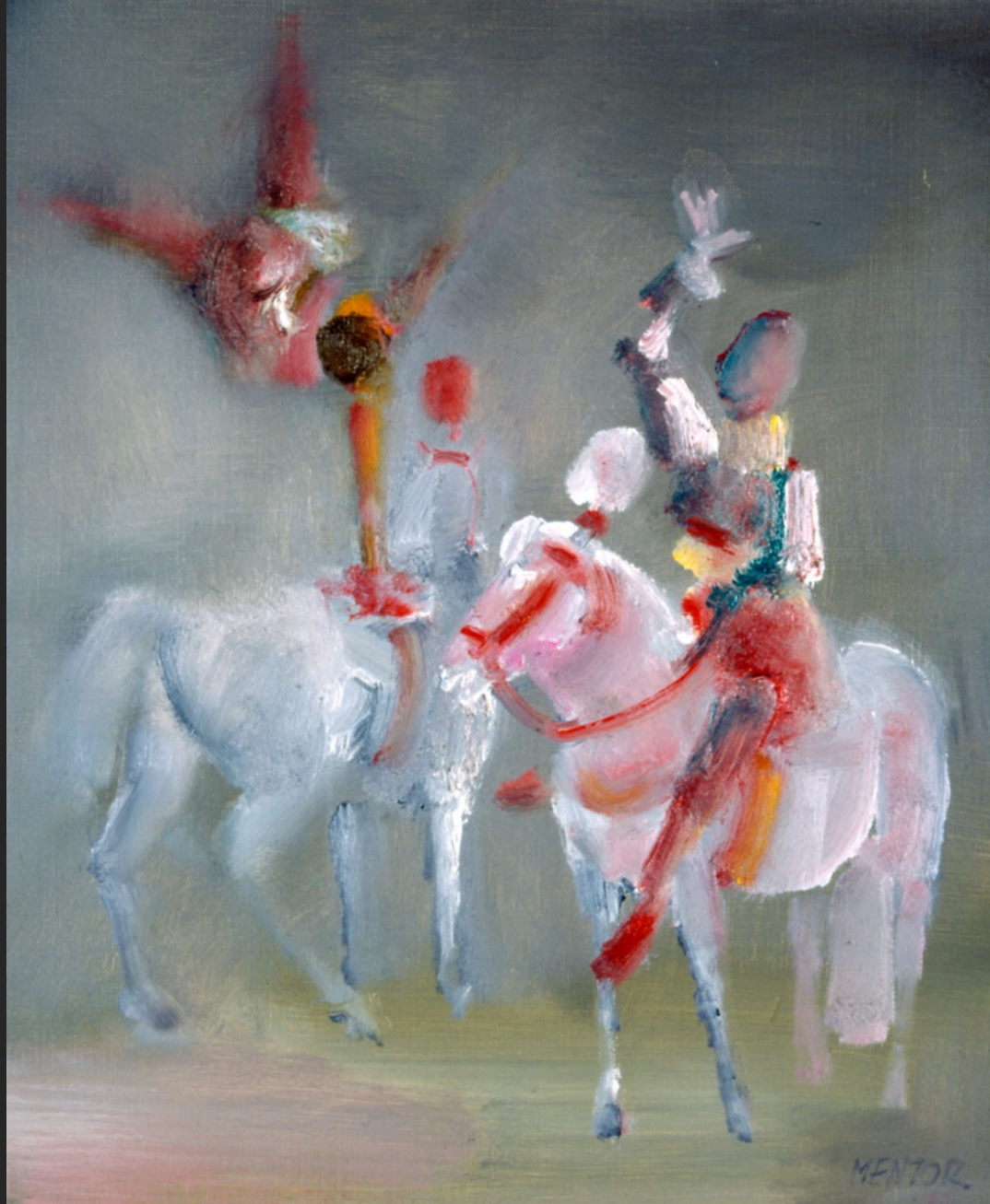
PIROUETTE AUX DEUX CHEVAUX, 1986, huile sur toile, 55 x 46 cm