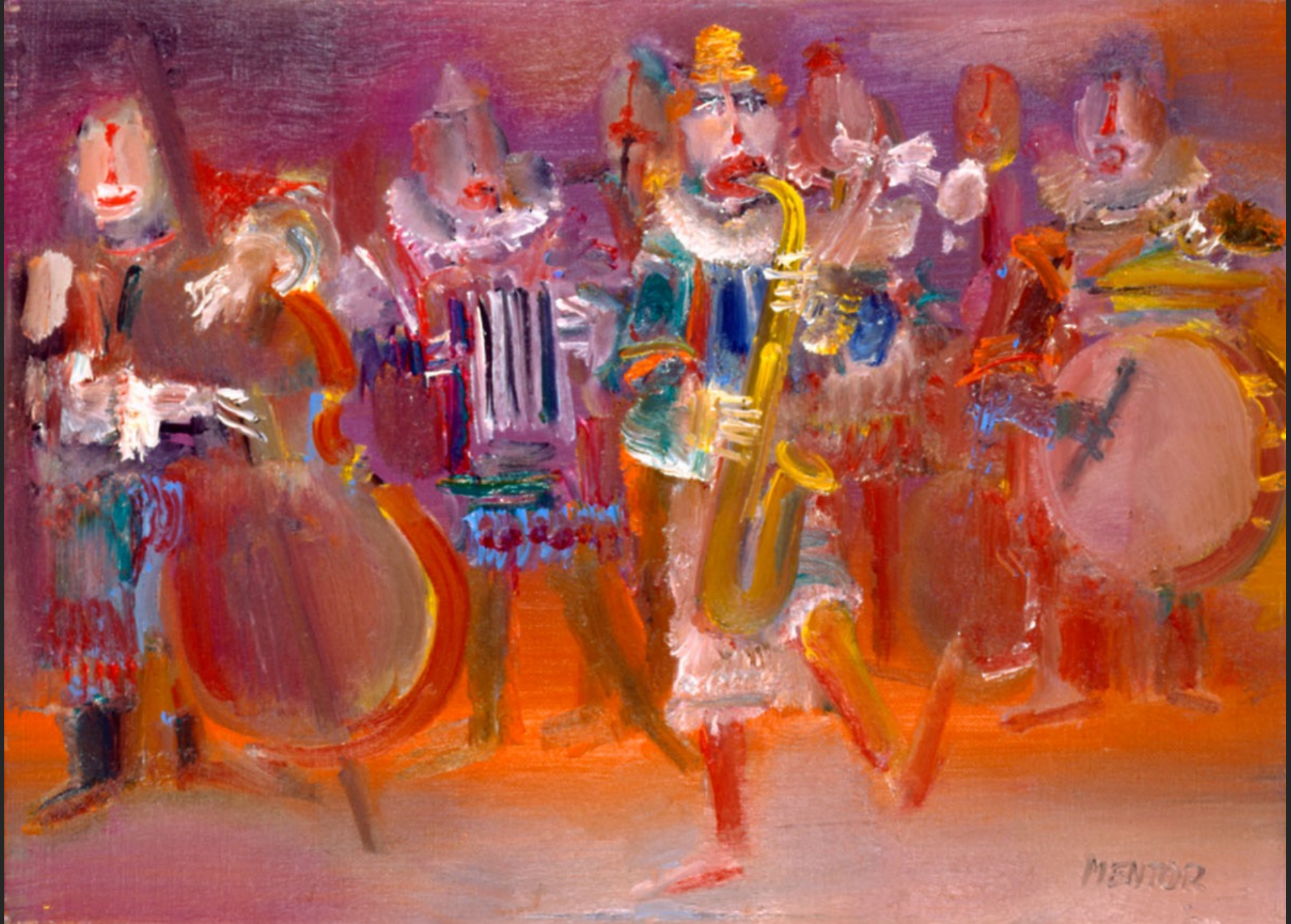
L'ORCHESTRE, 1986, huile sur toile, 46 x 55 cm