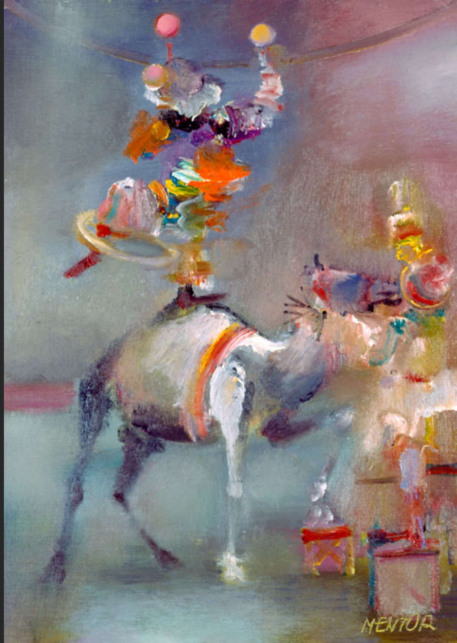
LE DROMADAIRE, 1986, huile sur toile, 55 x 38 cm