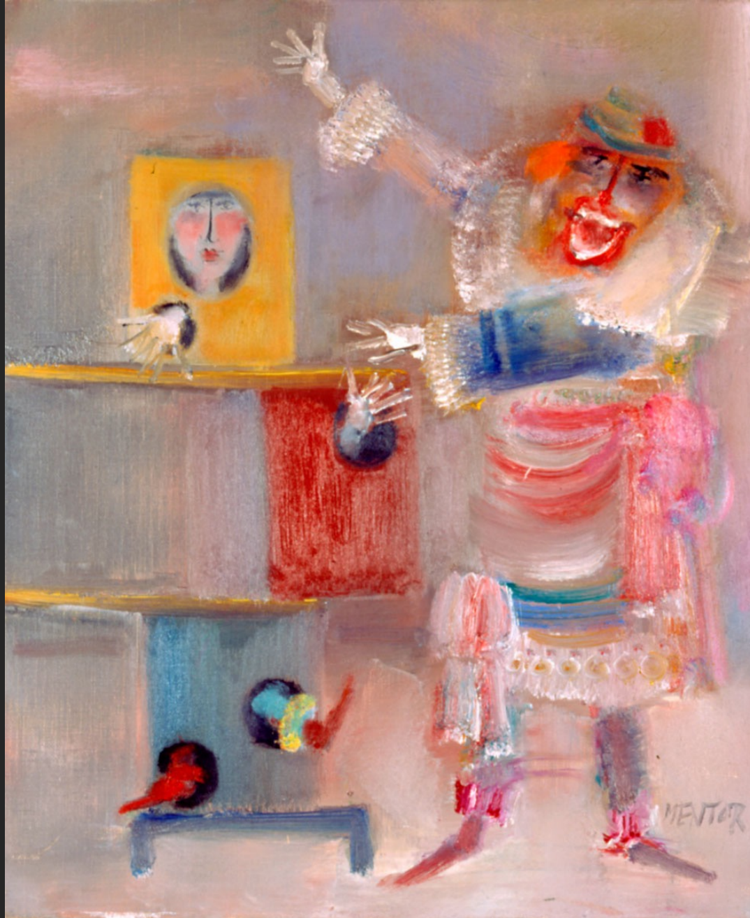
LE PRESTIDIGITATEUR, 1986, huile sur toile, 55 x 46 cm