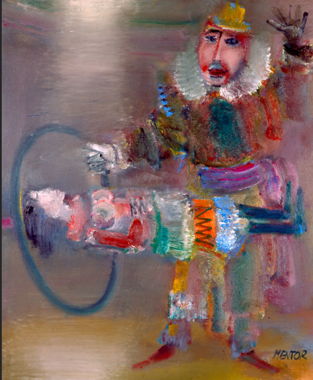
CLOWN AU CERCEAU, 1986, huile sur toile, 55 x 46 cm