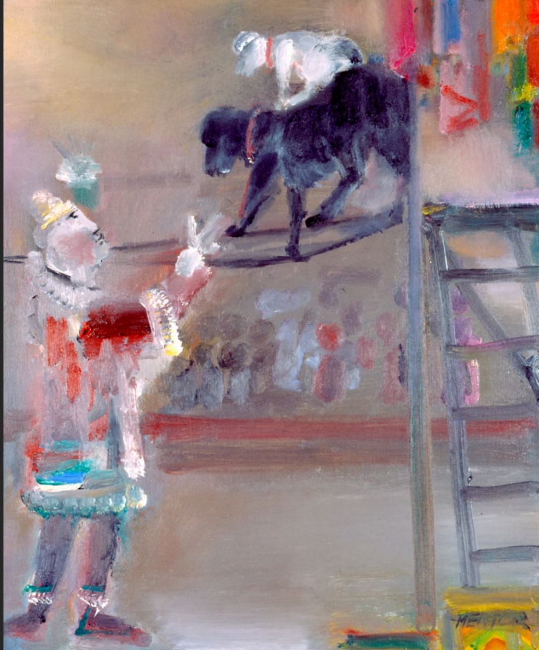
LES DEUX CHIENS FUNAMBULES, 1986, huile sur toile, 55 x 46 cm