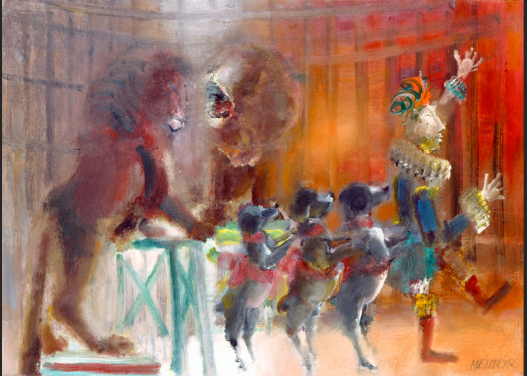
LE LION ET LES PETITS CHIENS, 1986, huile sur toile, 46 x 55 cm