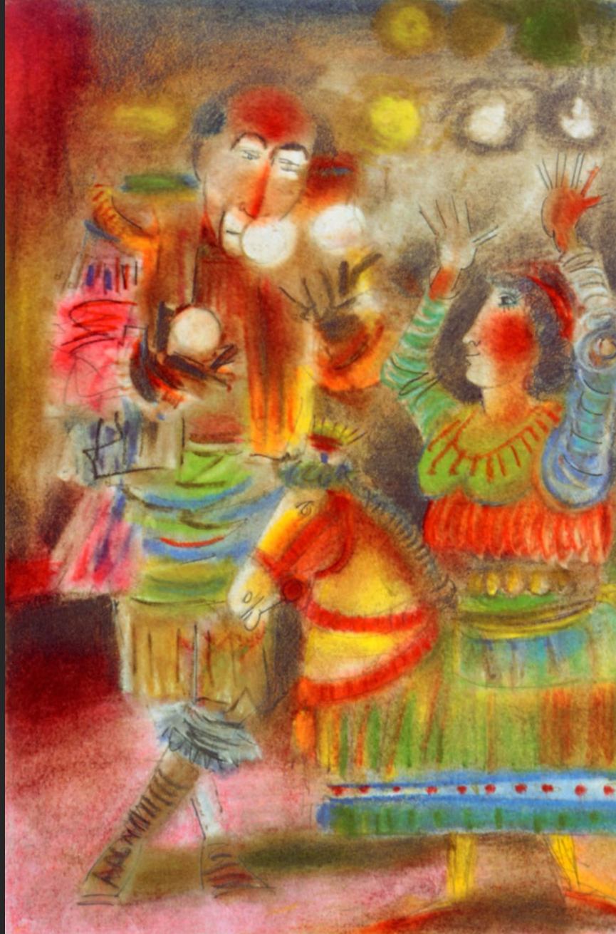
LE JONGLEUR, 1986, huile sur toile, 55 x 38 cm