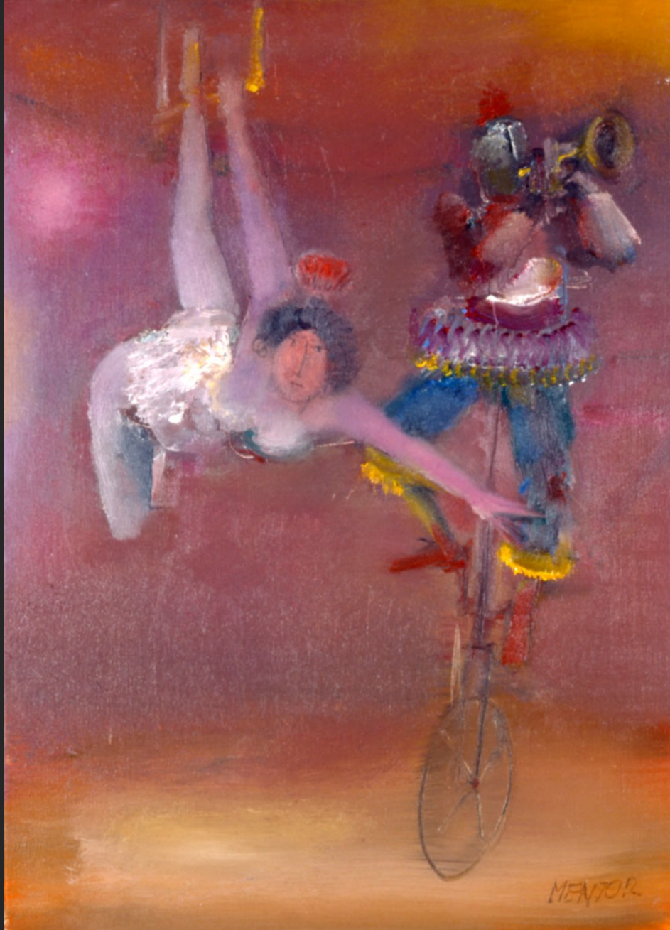
LA TRAPÉZISTE, 1986, huile sur toile, 55 x 38 cm