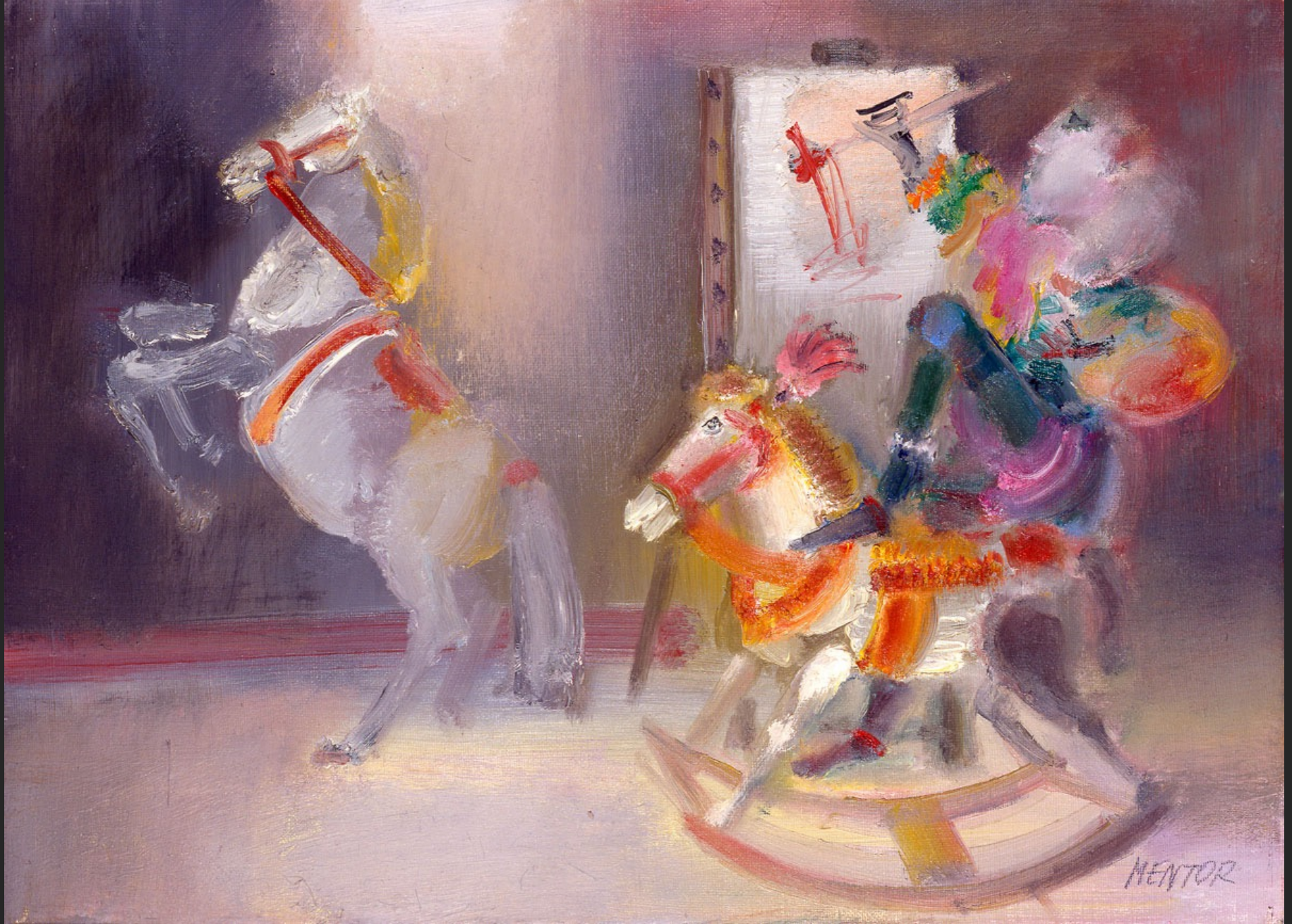
LE PEINTRE ET LE CHEVAL DE BOIS, 1986, huile sur toile, 38 x 55 cm