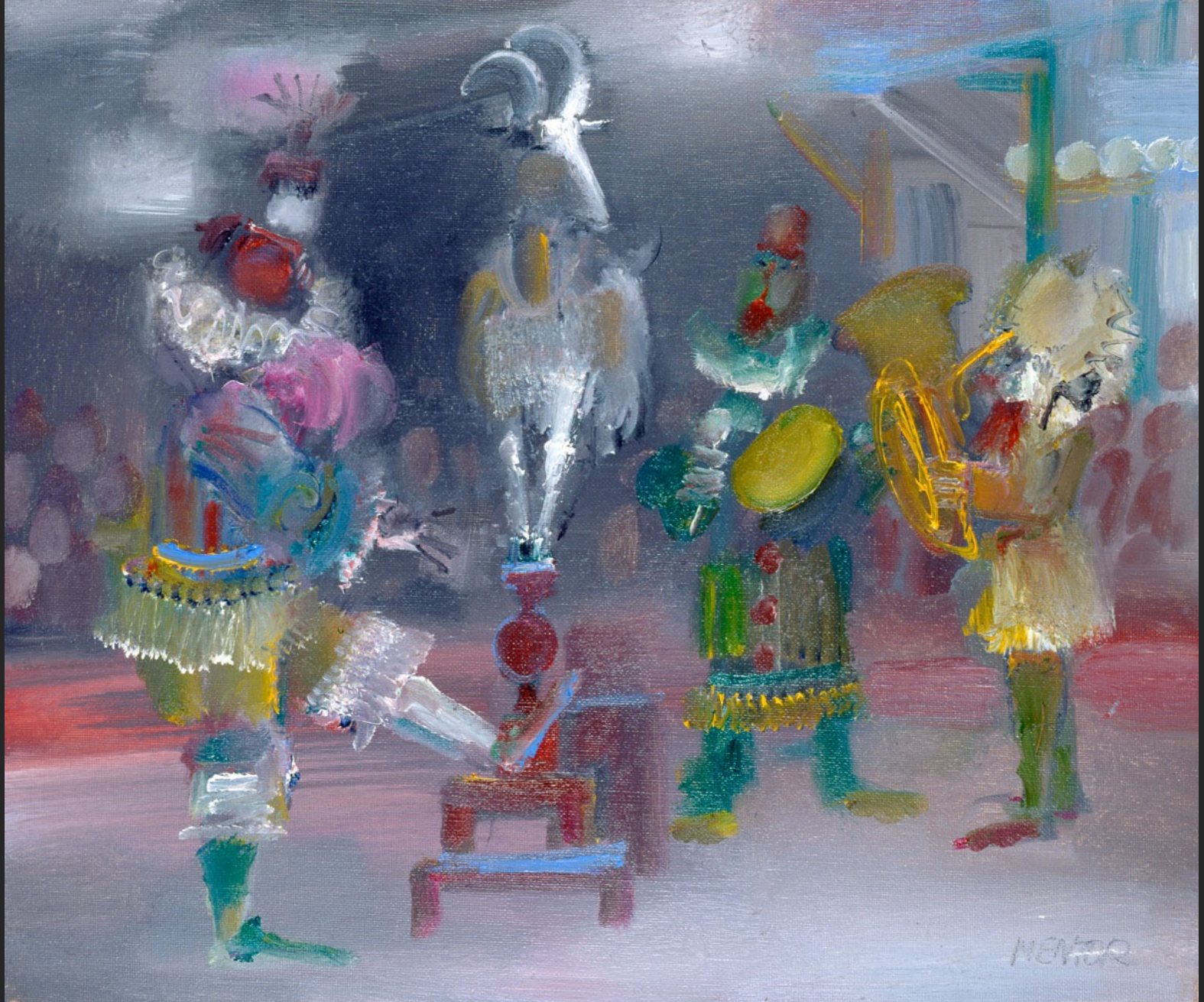
LE BÉLIER, 1986, huile sur toile, 38 x 55 cm