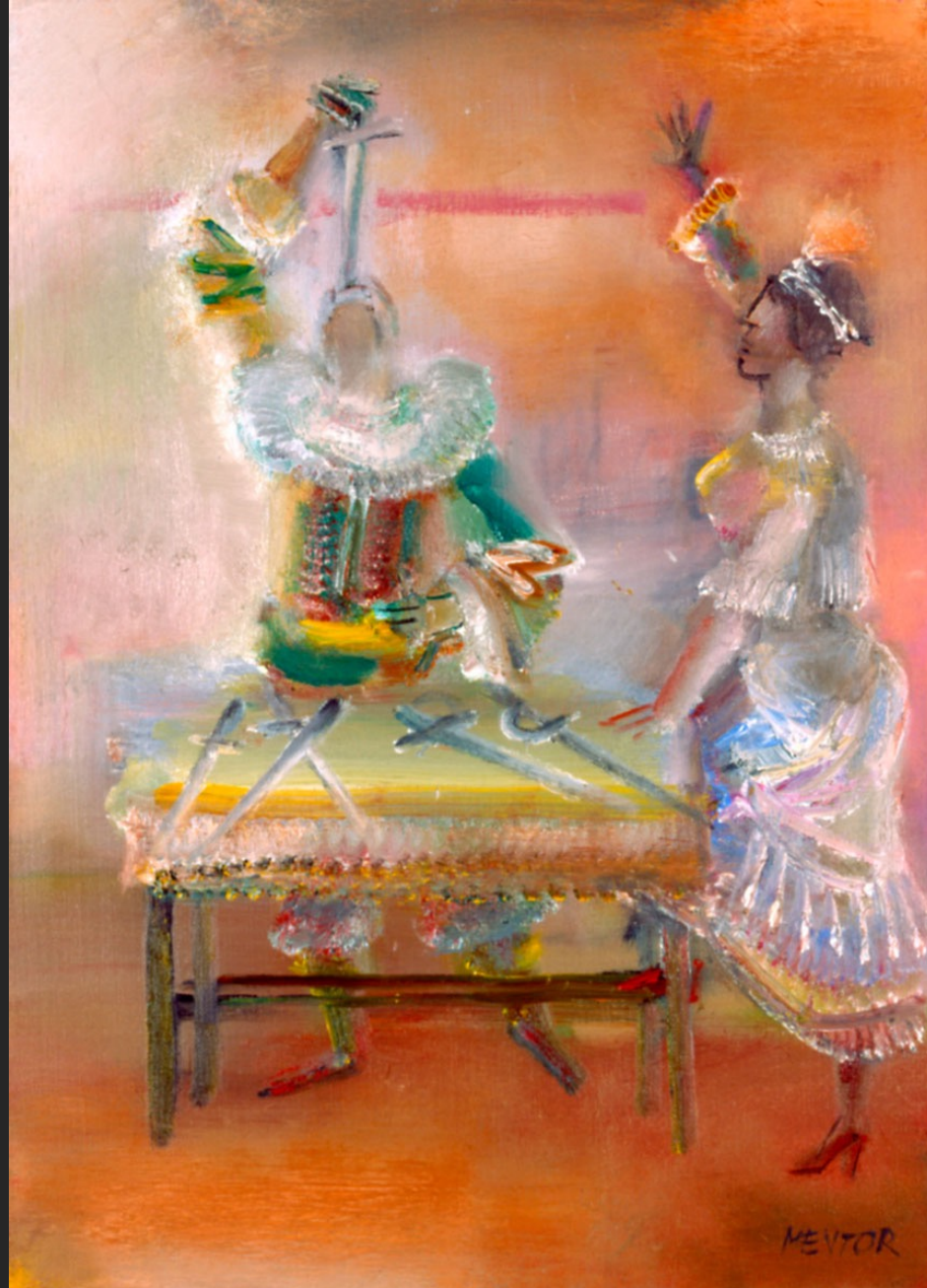
L'AVALEUR DE SABRE, 1986, huile sur toile, 55 x 38 cm