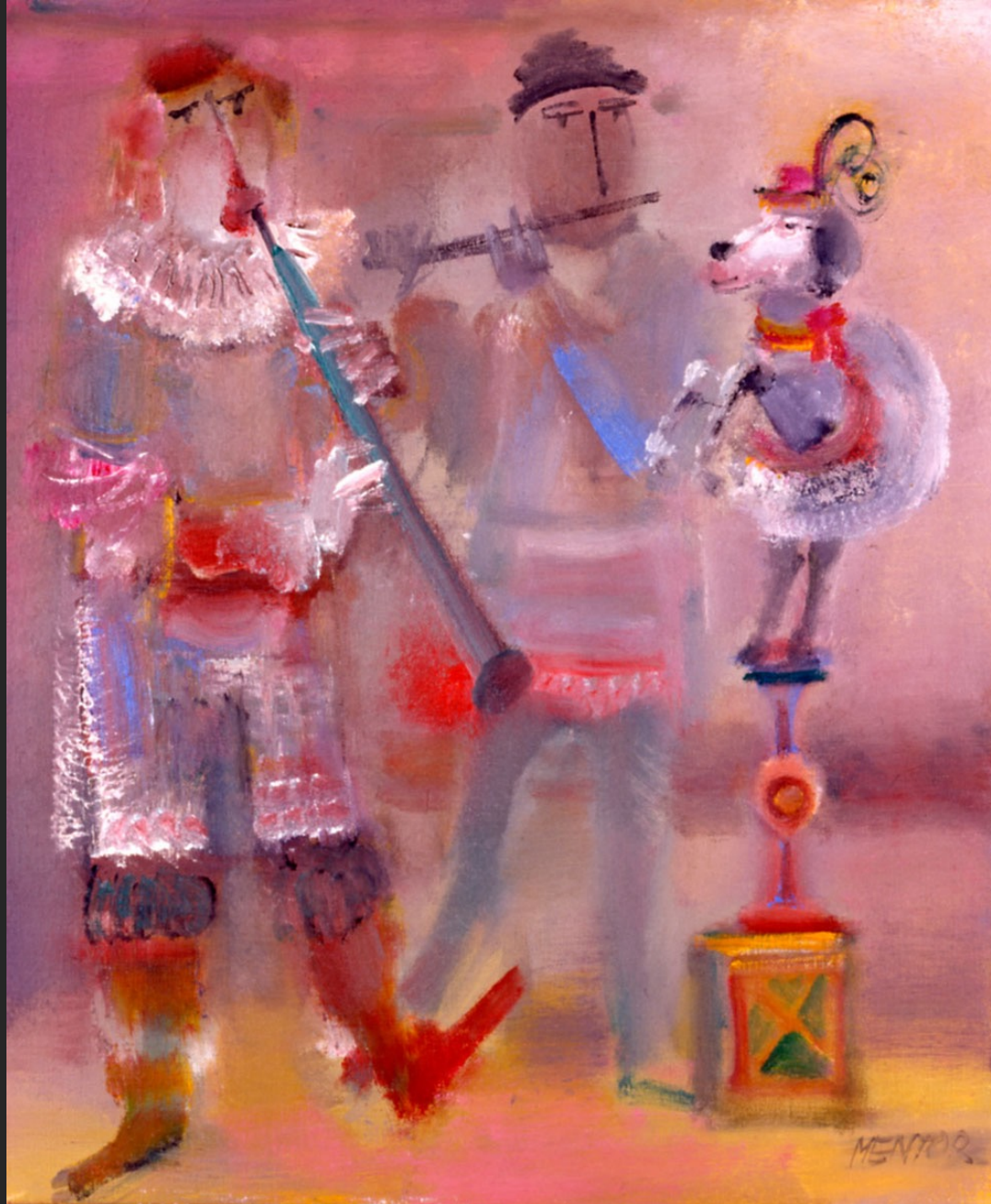
CONCERTO AU PETIT CHIEN, 1986, huile sur toile, 46 x 33 cm