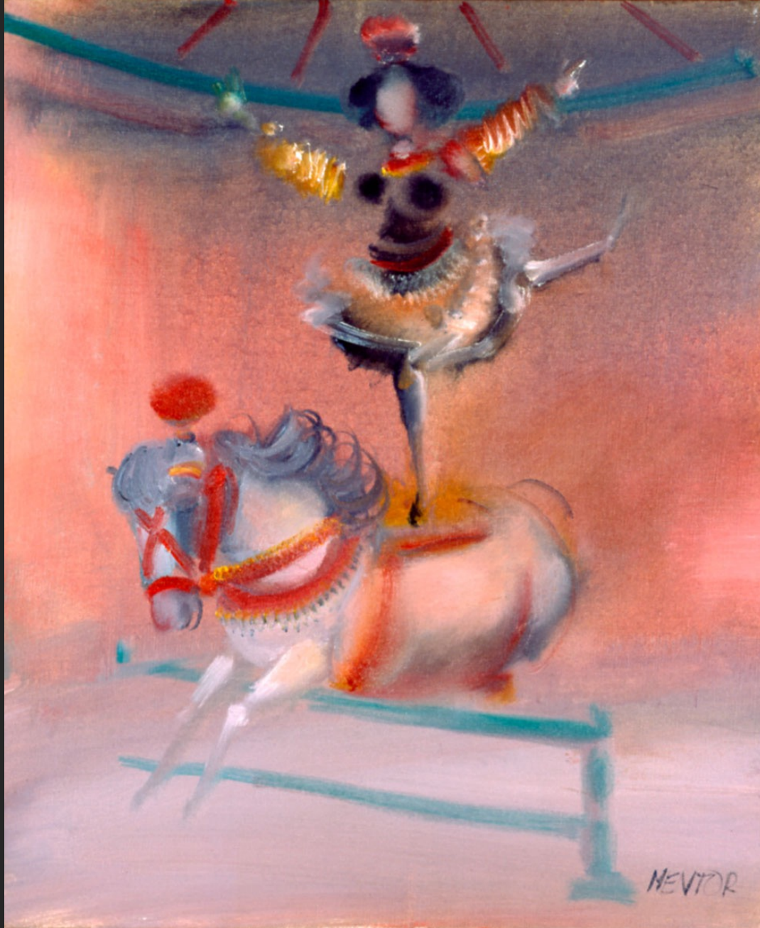
PONEY SAUTANT LA BARRIÈRE, 1986, huile sur toile, 55 x 46 cm