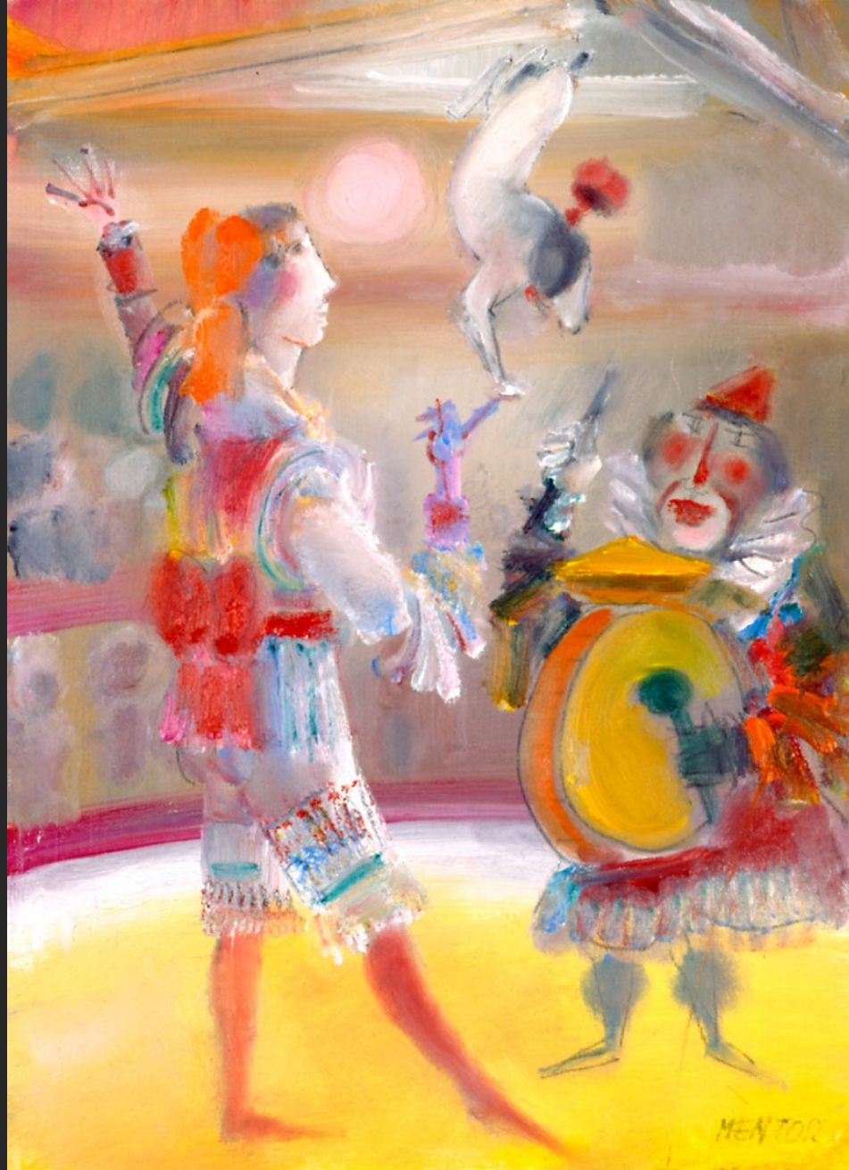
LE PETIT CHIEN ACROBATE, 1986, huile sur toile, 55 x 38 cm