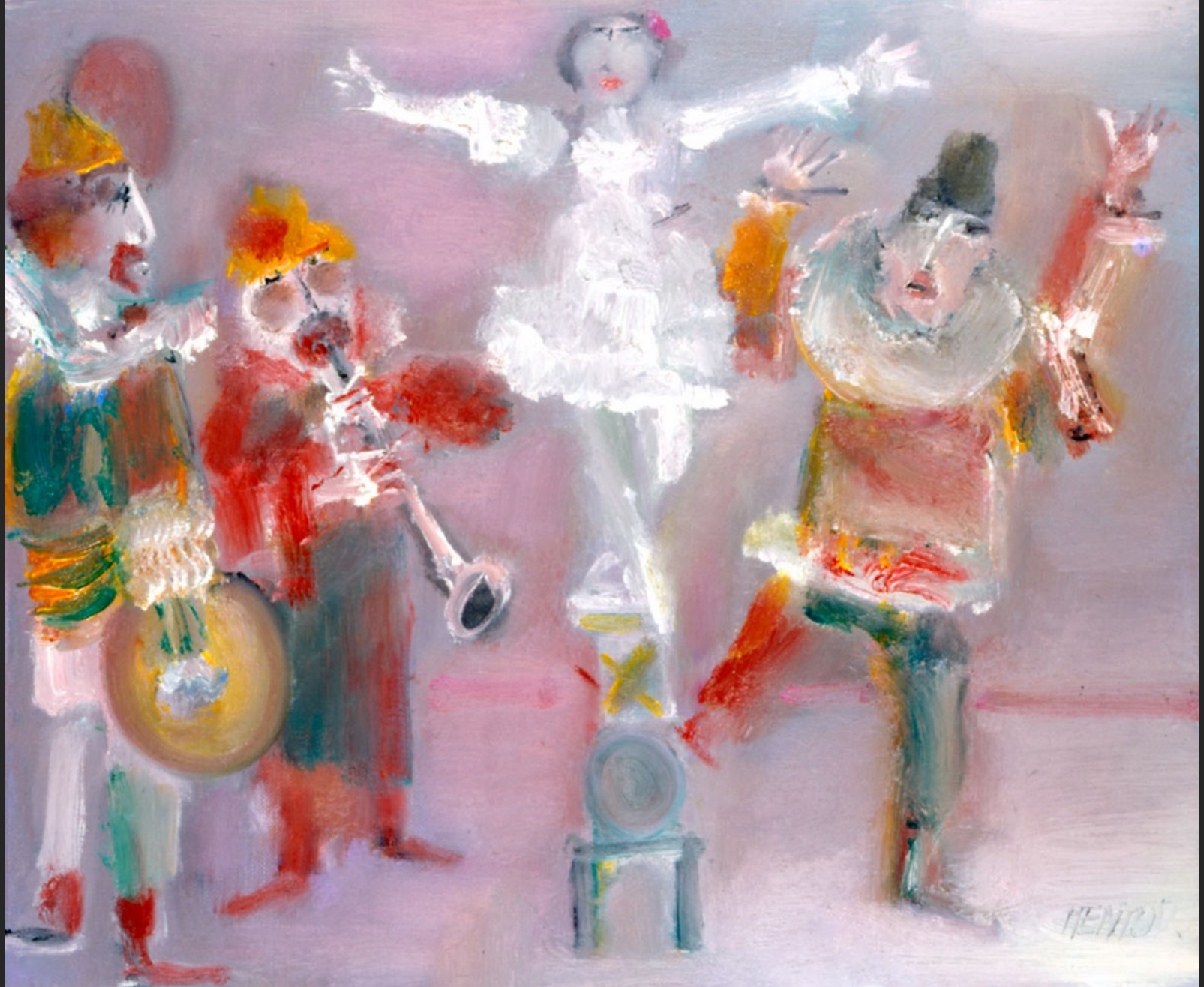
MUSICIENS ET DANSEURS, 1986, huile sur toile, 46 x 55 cm