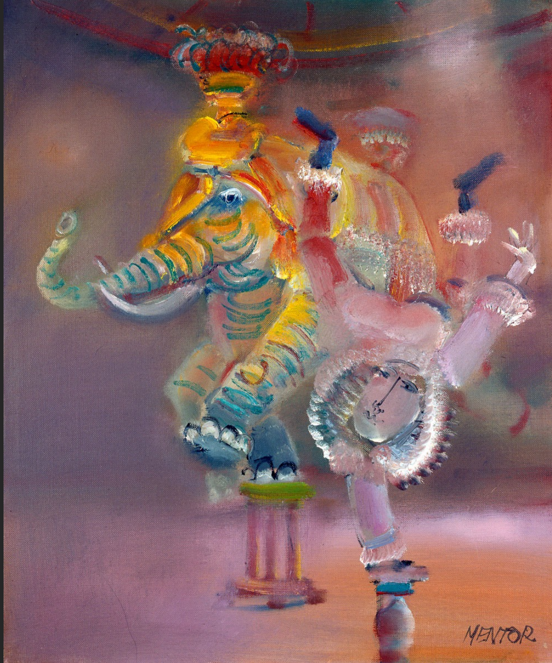
ÉLÉPHANT ACROBATE, 1986, huile sur toile, 55 x 38 cm