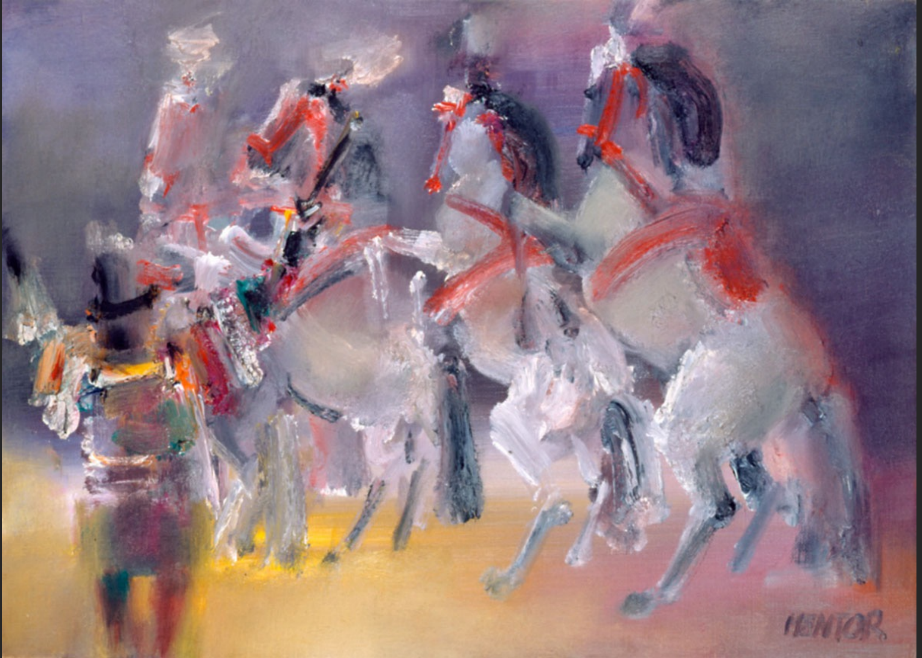
LE GRAND SAUT, 1986, huile sur toile, 46 x 55 cm