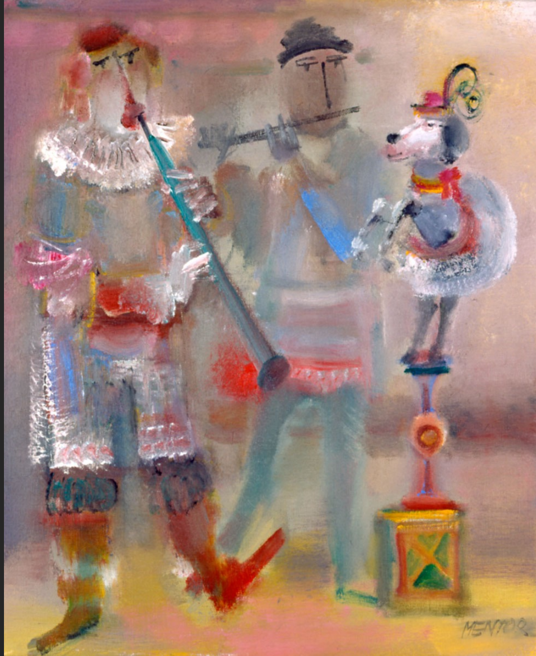
FLÛTISTE AU PETIT CHIEN, 1986, huile sur toile, 55 x 46 cm