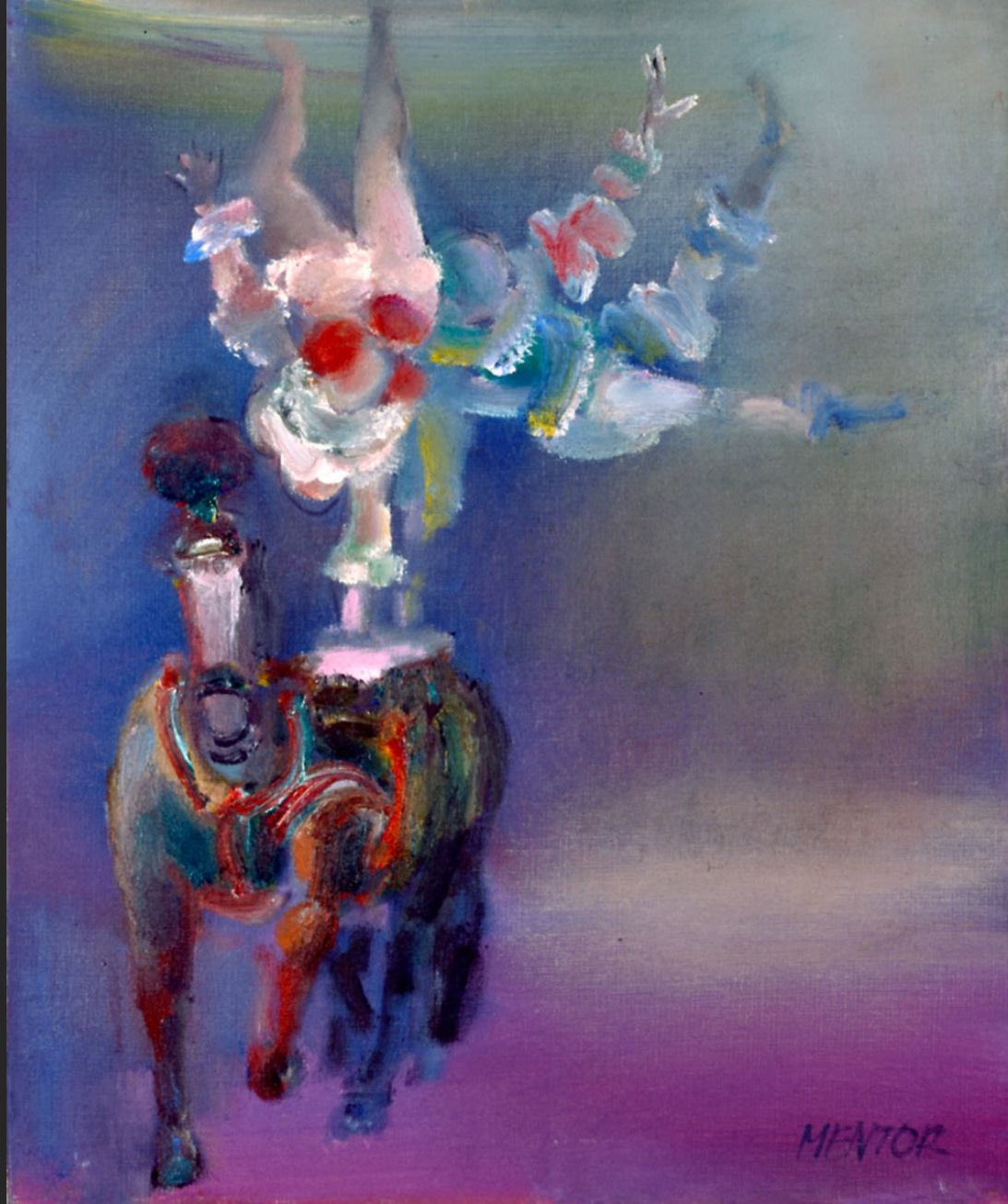
PIROUETTE SUR LE CHEVAL I, 1986, huile sur toile, 55 x 46 cm