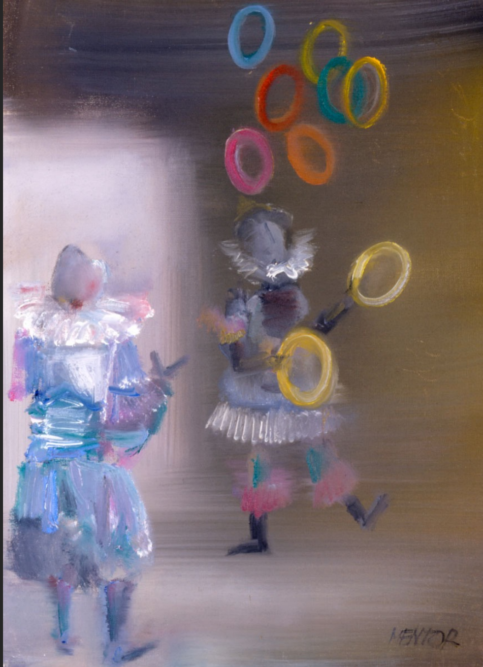
LA JONGLEUSE AUX ANNEAUX, 1986, huile sur toile, 55 x 46 cm