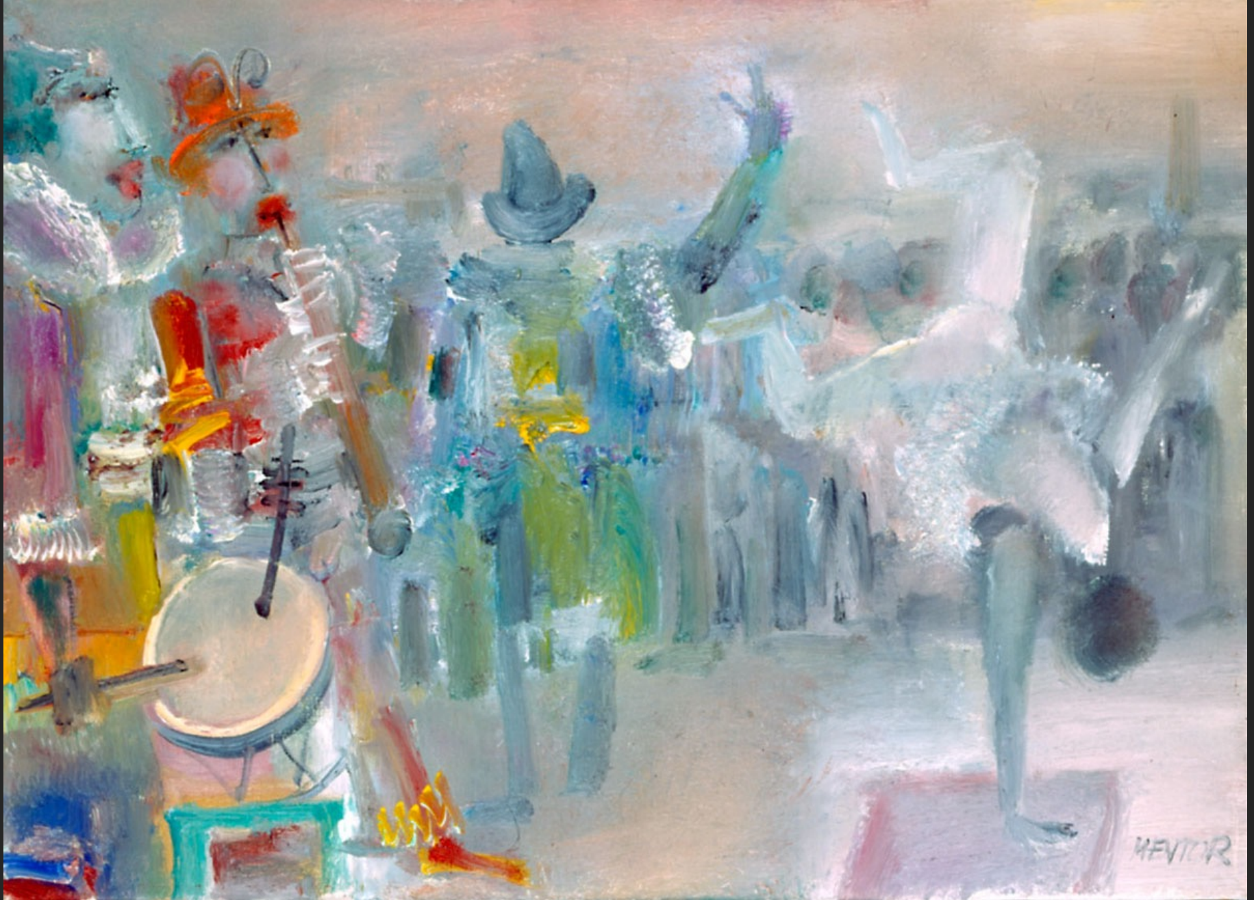
L'ACROBATE ET LES MUSICIENS, 1986, huile sur toile, 38 x 55 cm