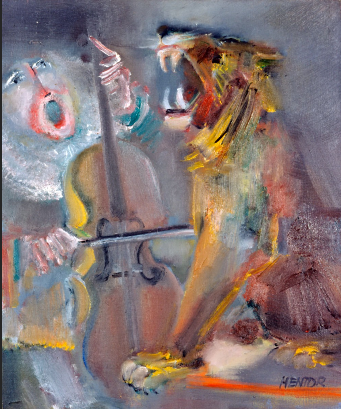
LE LION CHANTANT, 1986, huile sur toile, 55 x 46 cm