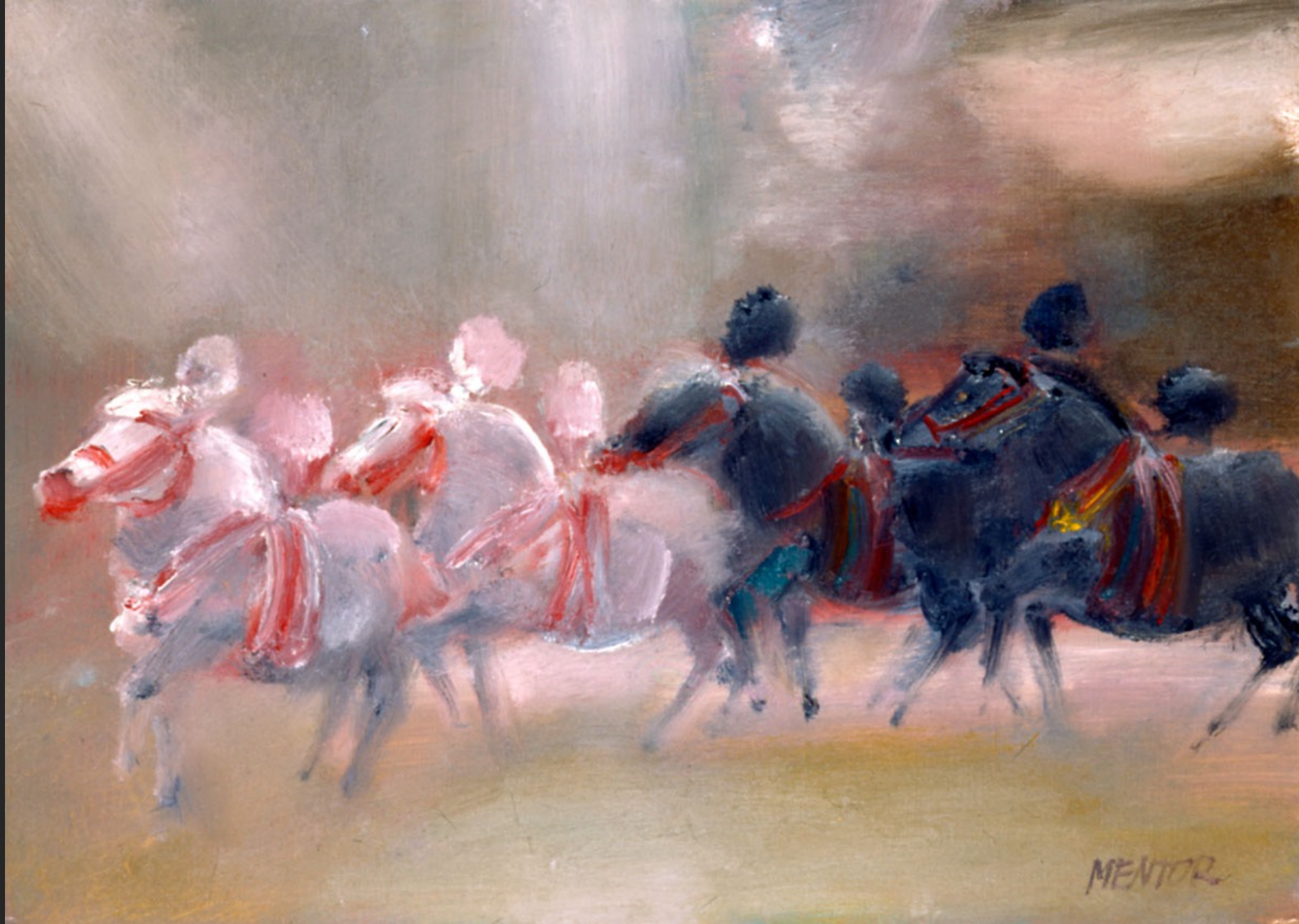
CHEVAUX GALOPANTS, 1986, huile sur toile, 38 x 55 cm