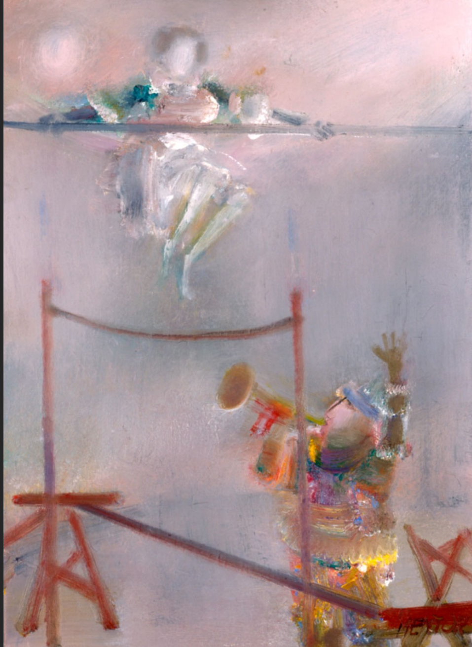
LE SAUT, 1986, huile sur toile, 55 x 38 cm