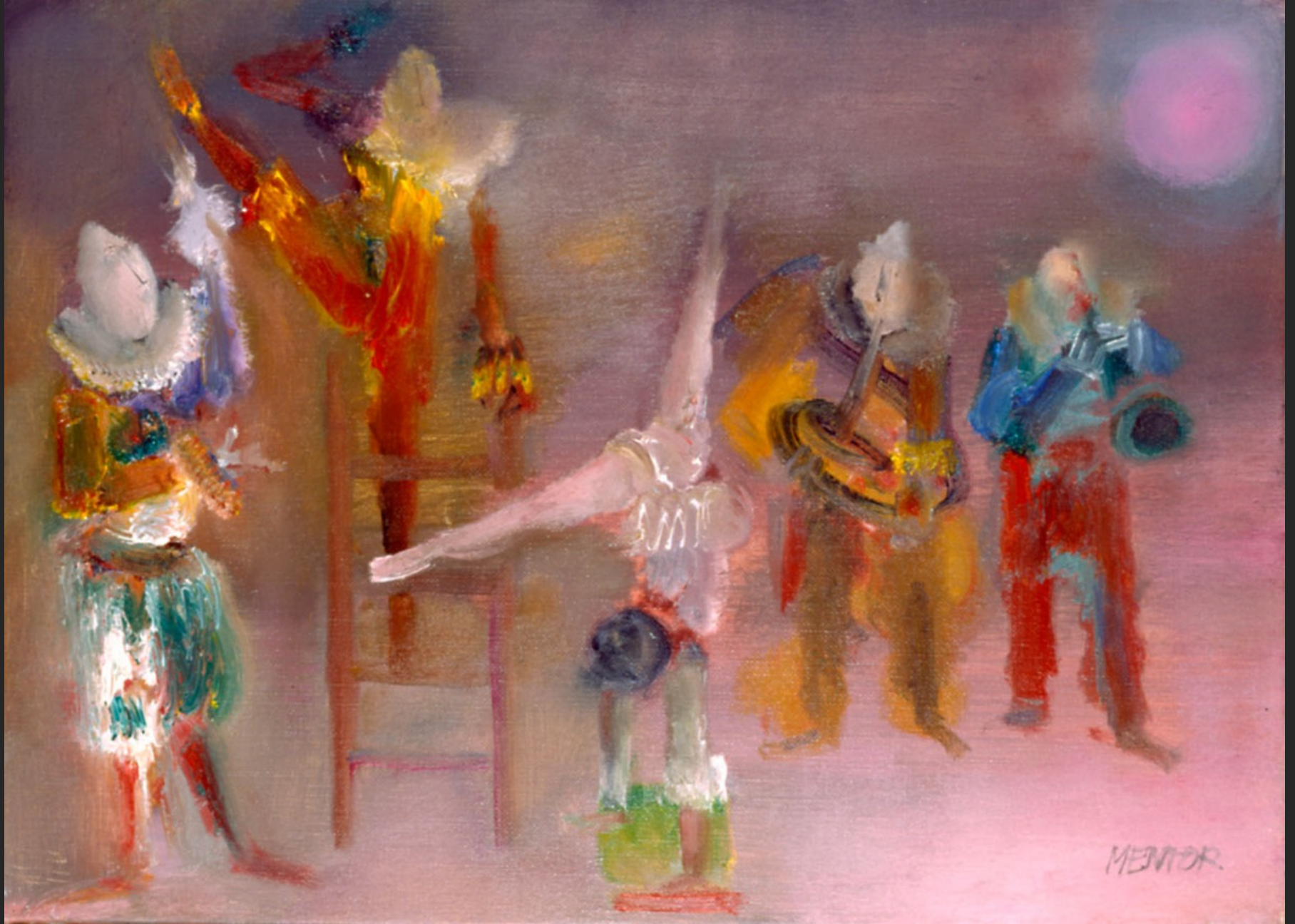
LES MUSICIENS ET LA DANSEUSE, 1986, huile sur toile, 38 x 55 cm