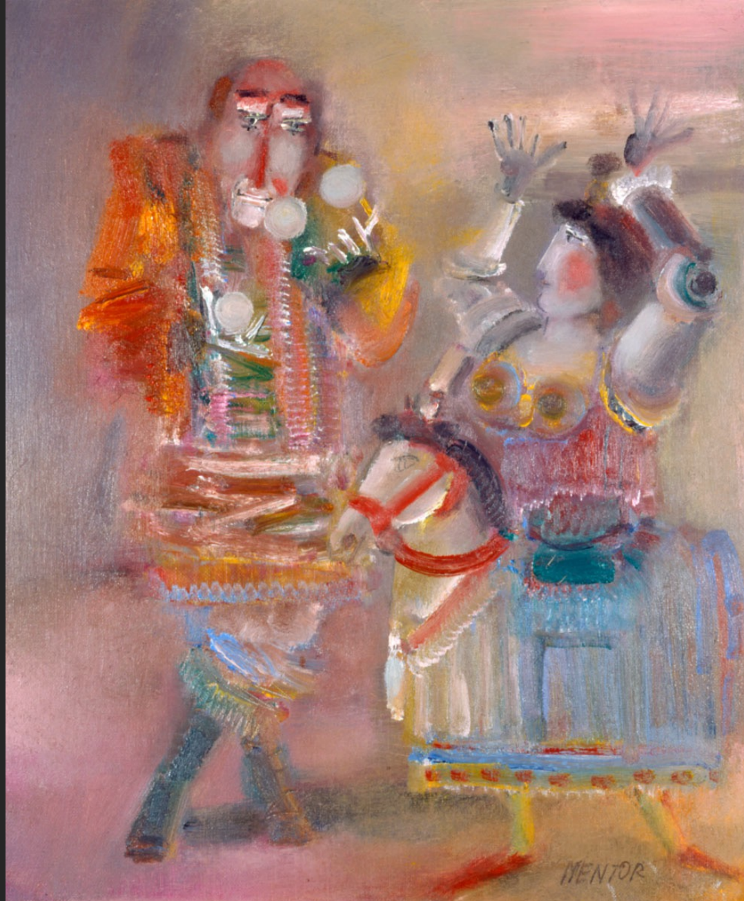
LE JONGLEUR ET LA DANSEUSE, 1986, huile sur toile, 55 x 46 cm