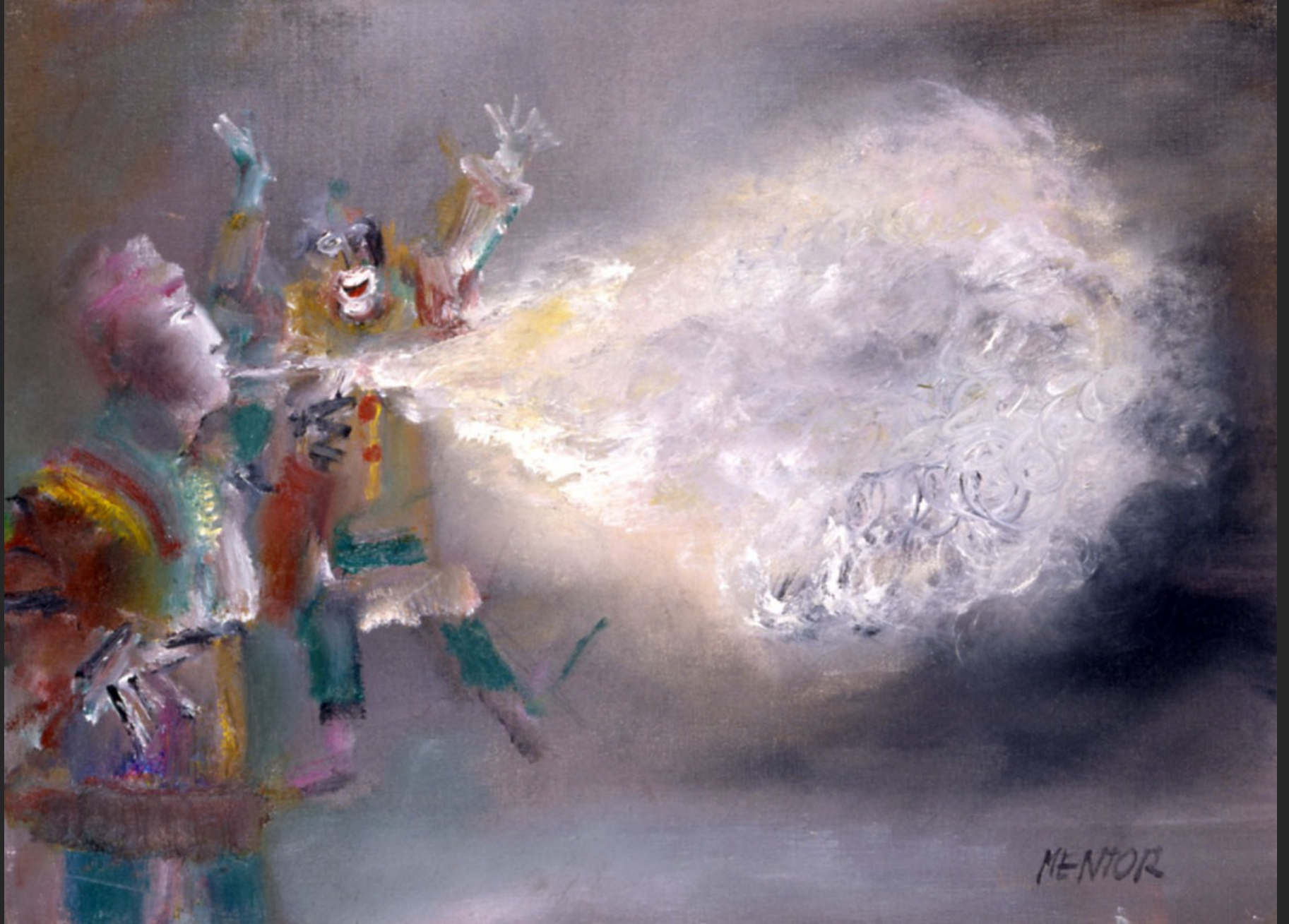
LE CRACHEUR DE FEU, 1986, huile sur toile, 46 x 55 cm