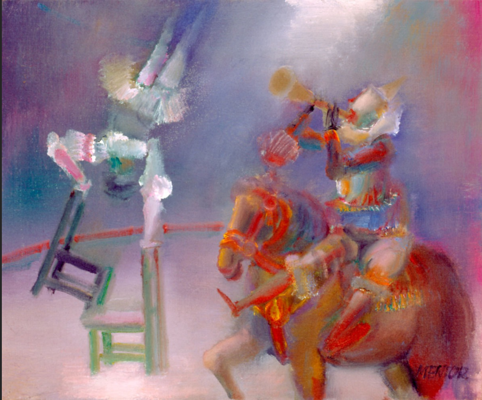
ÉQUILIBRISTE AUX CHAISES, 1986, huile sur toile, 46 x 55 cm