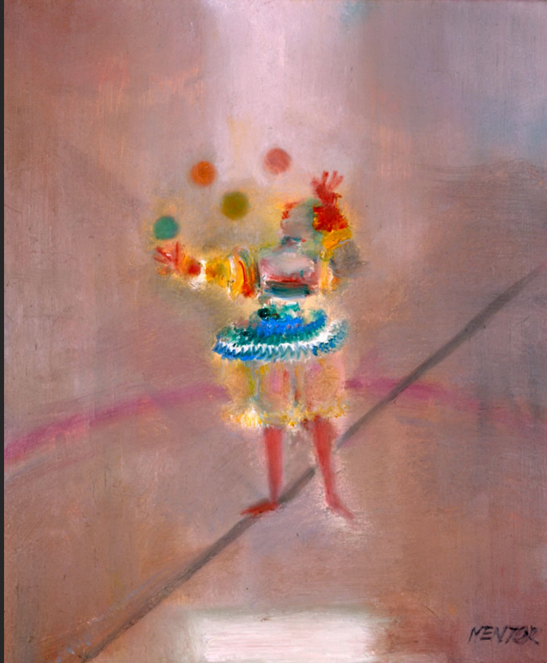
LE JONGLEUR ÉQUILIBRISTE, 1986, huile sur toile, 55 x 46 cm