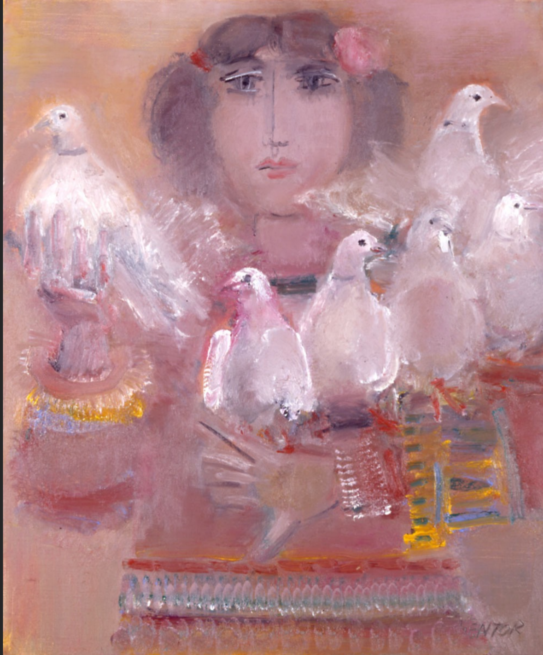
LA MAGIE DES COLOMBES, 1986, huile sur toile, 55 x 46 cm