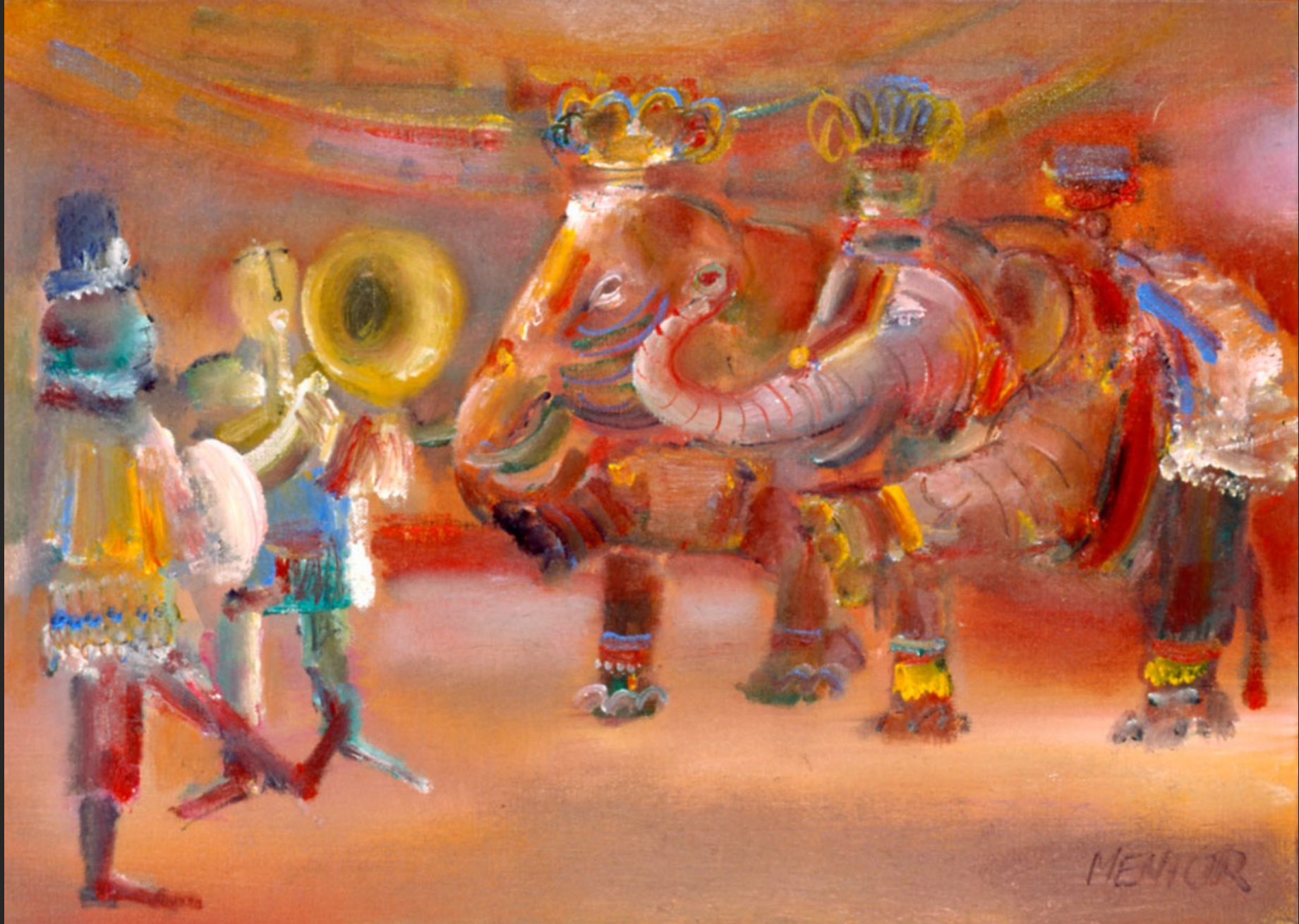
MUSICIENS ET ÉLÉPHANTS, 1986, huile sur toile, 38 x 55 cm