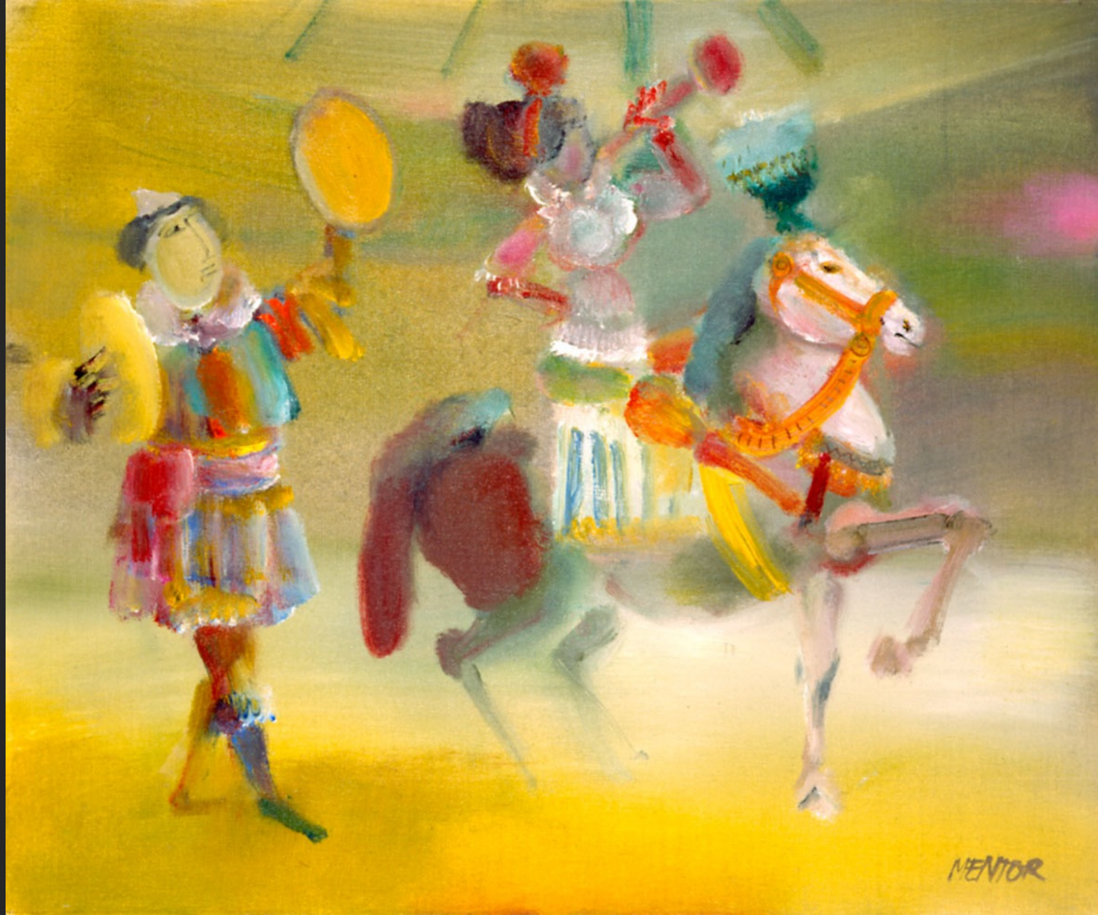
LA TROMPETTISTE À CHEVAL, 1986, huile sur toile, 46 x 55 cm