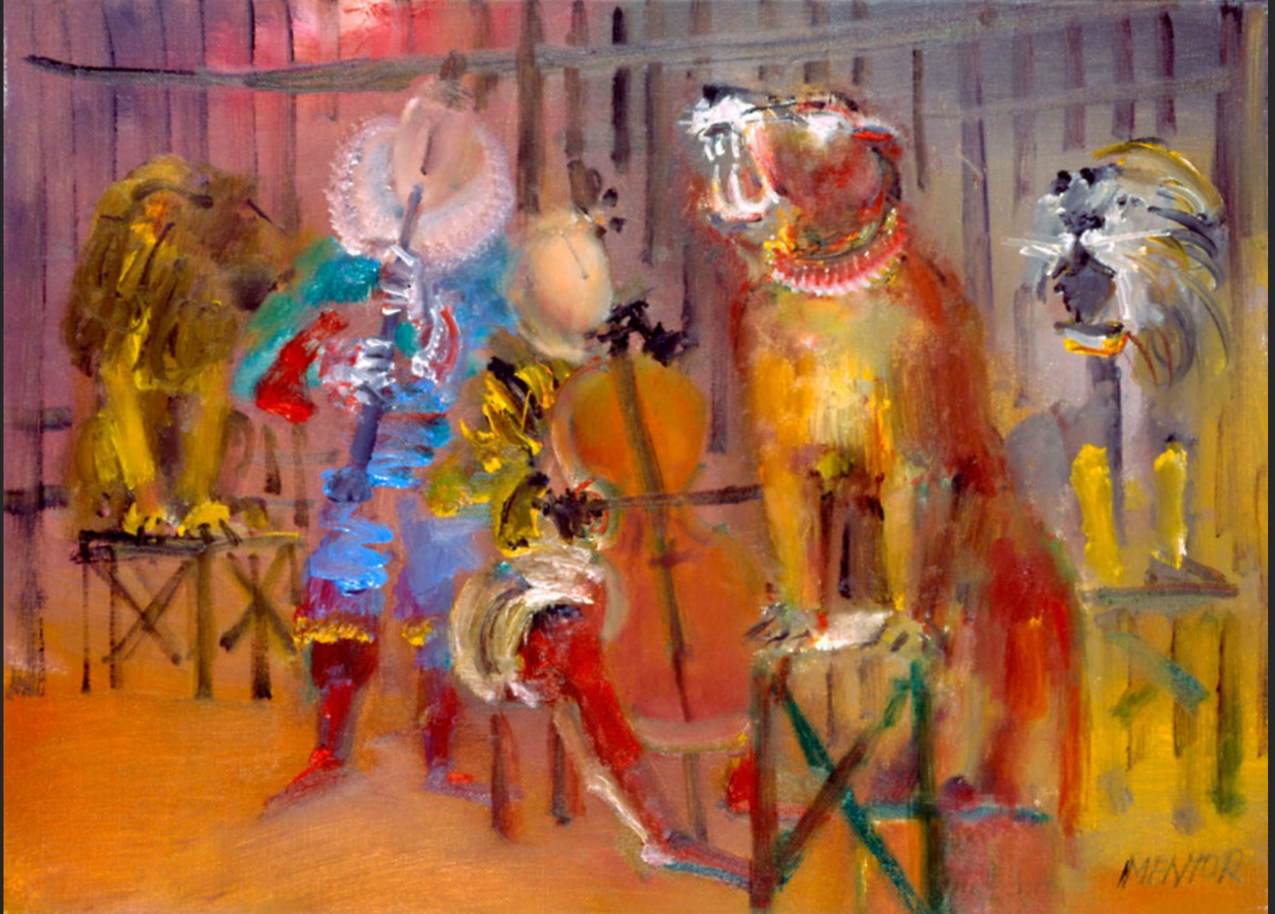
LE TIGRE CHANTEUR, 1986, huile sur toile, 46 x 55 cm