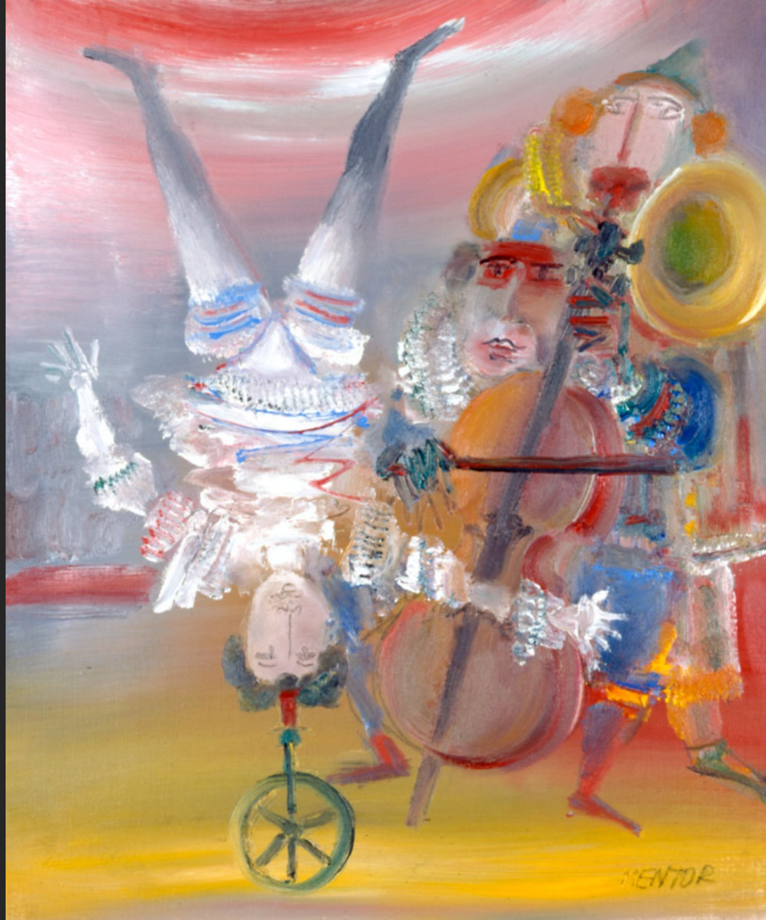
LE VIOLONCELLISTE ET L'ÉQUILIBRISTE, 1986, huile sur toile, 55 x 46 cm