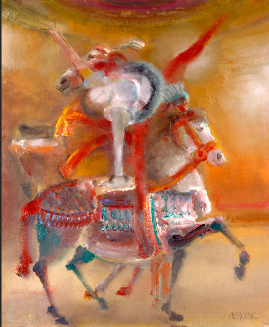
PIROUETTE SUR LE CHEVAL II, 1986, huile sur toile, 55 x 46 cm