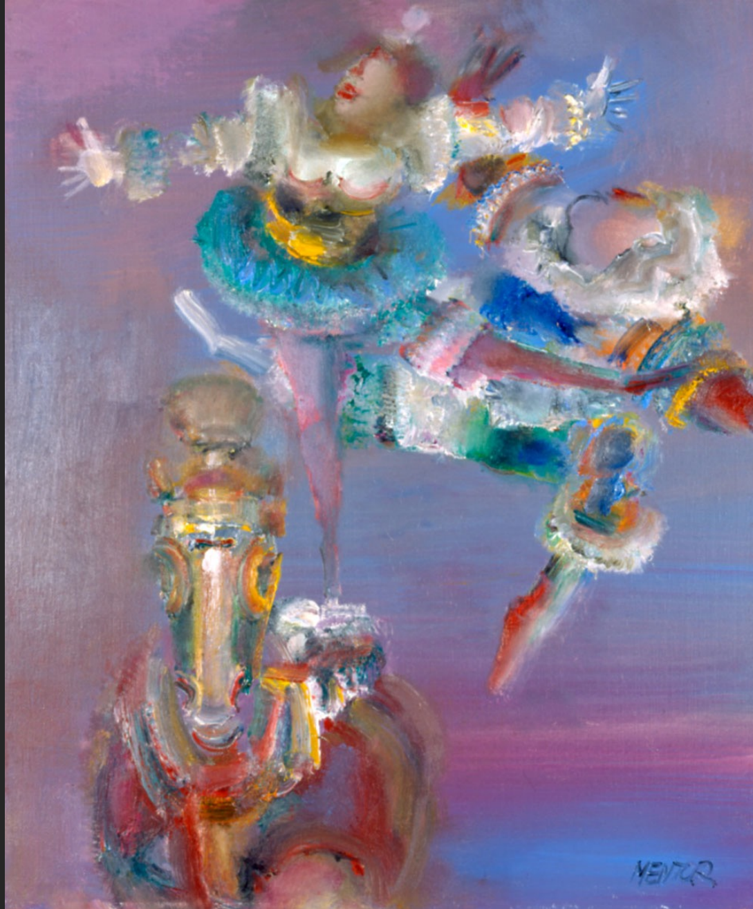
LES DEUX ÉQUILIBRISTES AU CHEVAL, 1986, huile sur toile, 55 x 38 cm