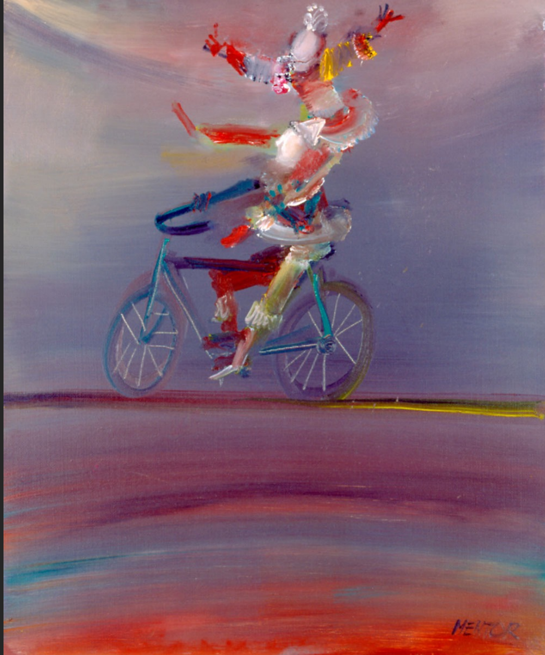
CYCLISTE ÉQUILIBRISTE, 1986, huile sur toile, 55 x 46 cm