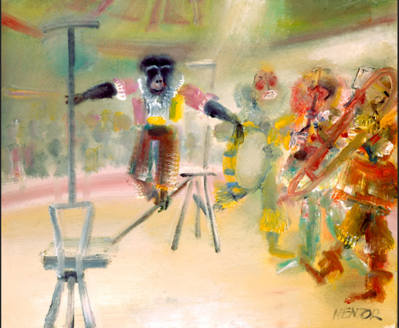
LE SINGE ÉQUILIBRISTE, 1986, huile sur toile, 33 x 55 cm