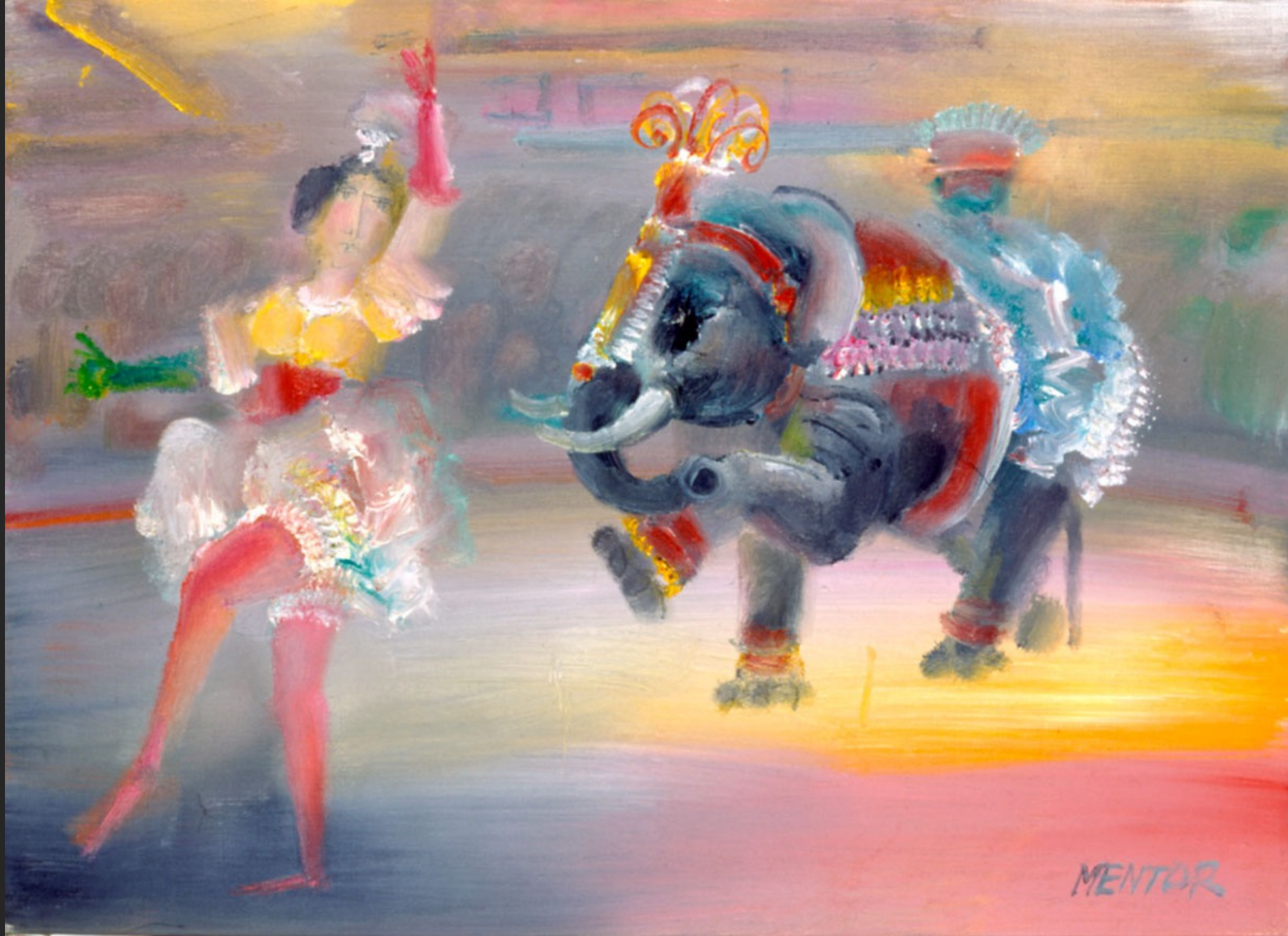
LA DANSEUSE ET L'ÉLÉPHANT, 1986, huile sur toile, 38 x 55 cm