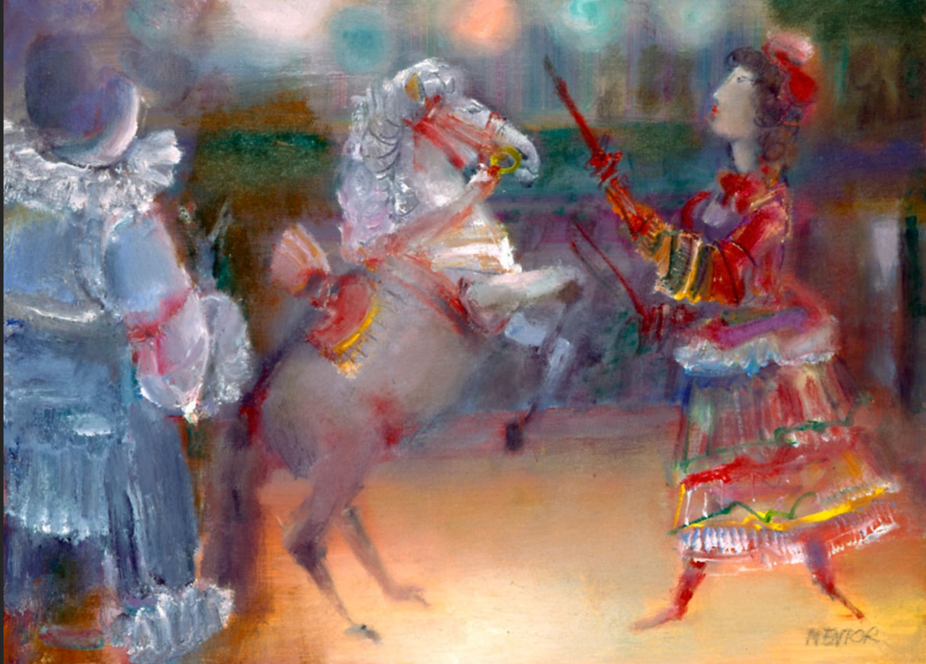
LA DOMPTEUSE, 1986, huile sur toile, 38 x 55 cm