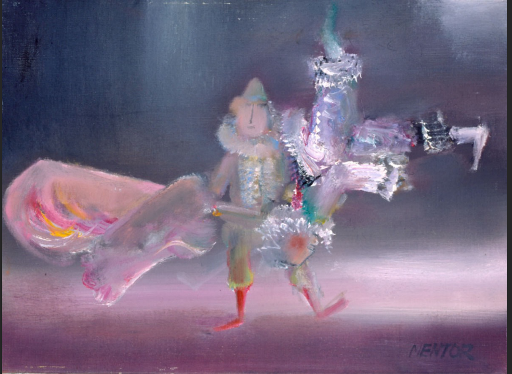
VOLTIGE, 1986, huile sur toile, 38 x 55 cm